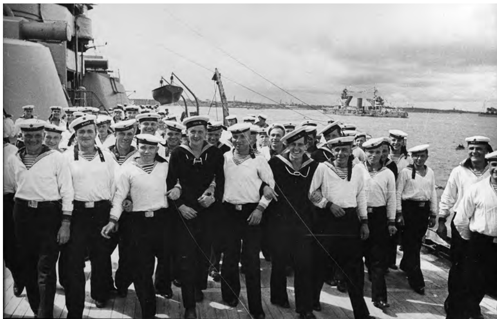
Aegna komandantuuri rannakaitseväelaste ja Punalipulise Balti laevastiku ristleja Marat madruste kohtumine 26. juulil 1940. aastal Tallinna sadamas.

Pärast merekindluste komandantuuride hõivamist esitas NSV Liidu sõjalaevastiku rahvakomissar Nikolai Kuznetsov 23. juunil nende kohta eraldi märgukirja Jossif Stalinile, NSV Liidu välisasjade rahvakomissarile Vjatšeslav Molotovile ja marssal Vorošilovile. Märgukirjas tõi ta välja, et Balti laevastikul puudub varjuline sadamakoht, sest Paldiski