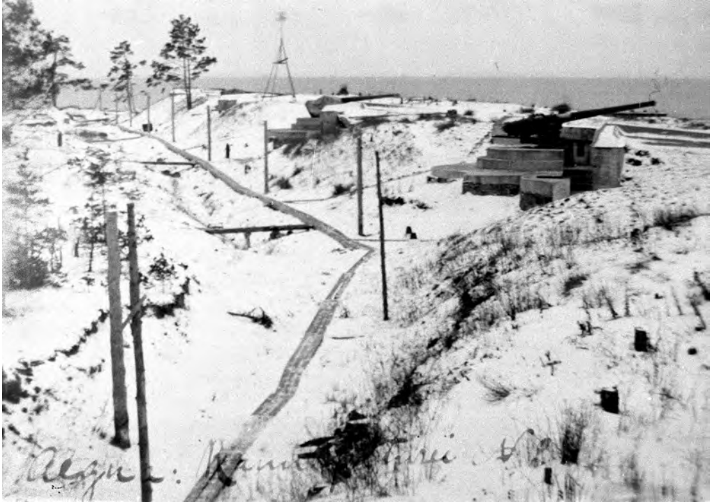
Vaade 1921. aastal Aegna merekindluse rannakaitsepatareile nr 3.

protsess 1940. aasta suvel. Konkreetsemalt tulevad käsitlemisele küsimused: 1) kuidas Punalipuline Balti laevastik merekindluste komandantuuride rannakaitsepatareid ning muu taristu üle võttis? ja 2) kuidas töötasid komandantuuride likvideerimiskomisjonid?