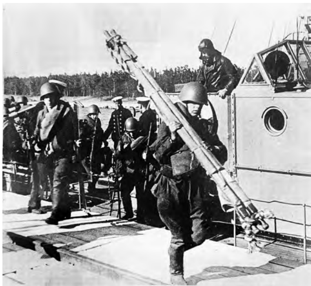
Nõukogude vägede maabumine Naissaare sadamas 17. juunil 1940.

Vene sõdurid olid jäänud laagrisse laevasadama lähedusse Naissaare idakaldal, kus ma nii-öelda neid nägin „oma silmaga“. Juhtus nimelt, et selle väeüksuse komandör käis saarel ringi, olukorraga ja ümbruskonnaga tutvumiseks – ja kuna minu ema oli ainus, kes saarel korralikku vene keelt valdas, siis astus ta vahetevahel meile sisse. Oli sõbraliku olemisega isik, ja ema katsus vahel juhust kasutada selleks, et teada saada, mida lähem aeg, peale nüüd asetleidnud pööret, võiks meile kaasa tuua.