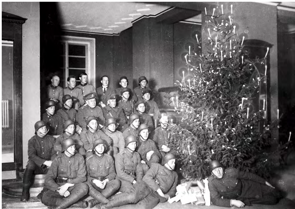
Jõulud Eesti kaitseväes 1925. aastal.