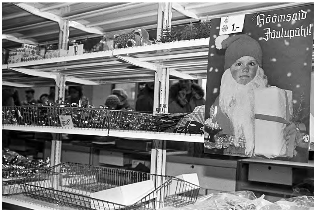
Tallinna Kaubamaja jõuluehete osakond 1990. aastal jõulude eel.