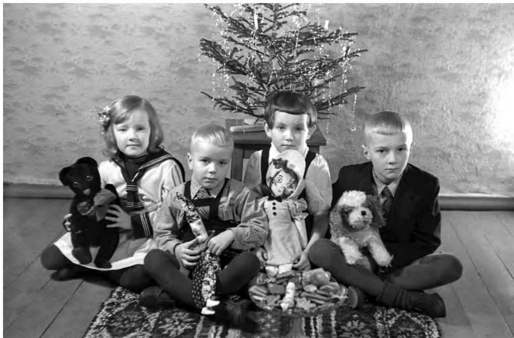
Lapsed jõulukuuse juures 1942. aastal.