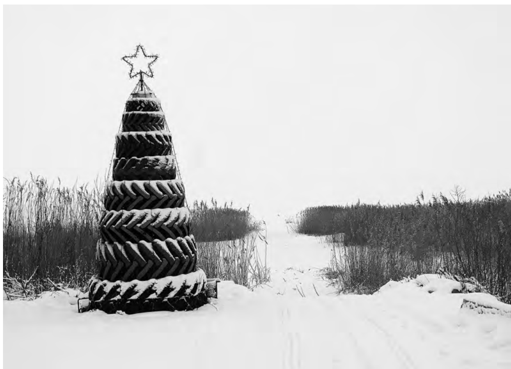
Rehvidest jõulupuu Peipsi ääres 2022. aastal.