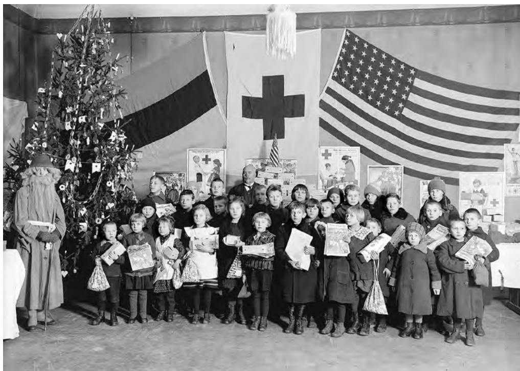
Lapsed Eesti Punase Risti jõulupuul. 1. jaanuar 1940. EFA.26.4.11