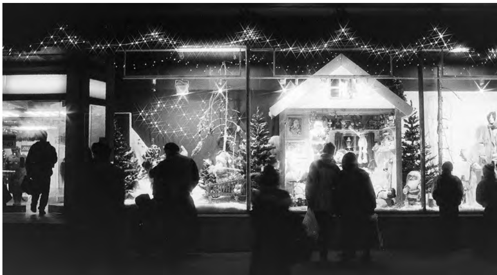
Tallinna Kaubamaja vaateaknad 1994. aasta jõulude ajal.

1993. aastal püüab fotograafi pilku Raekoja platsil mitte traditsiooniline jõulupuu, vaid hoopis välismaa auto.