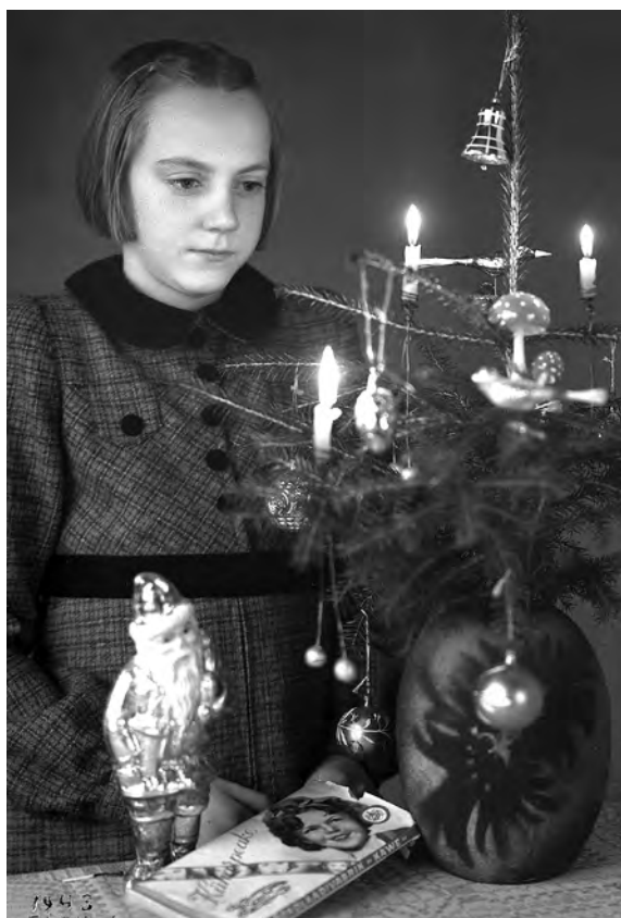
Jõulumeeleolu Järvamaal 1943. aastal.