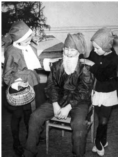
Stockholmi Eesti algkooli jõulupeol etendatakse näitemängu koolis käivatest päkapikkudest. 1962. aasta.