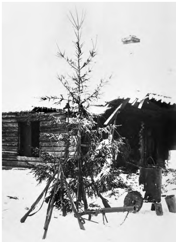
Käepäraste vahenditega ehitud jõulupuu Vabadussõja ajal 1919. aastal Ingerimaal.

metsast ise, näiteks nii, nagu seda tehti fotonurka valitud pildil 1930. aastast.