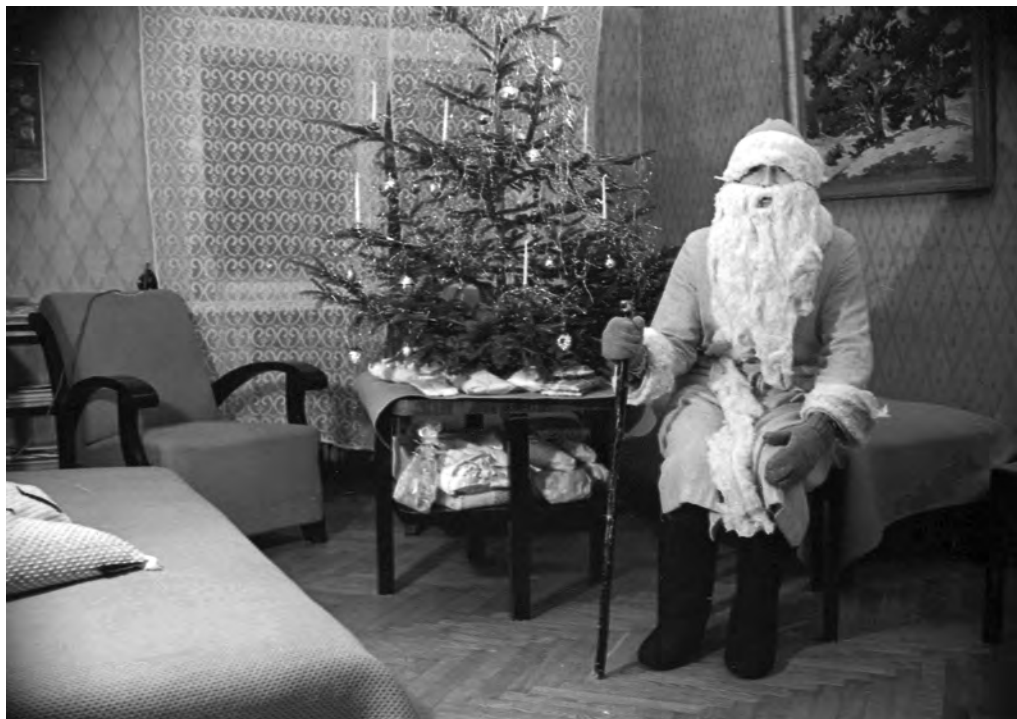
Jõuluvana elutoas kuuse juures. 1965. aasta. EFA.570.0.402963