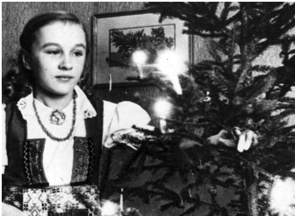
Jõulud Geislingeni põgenikelaagris 1946. aastal.