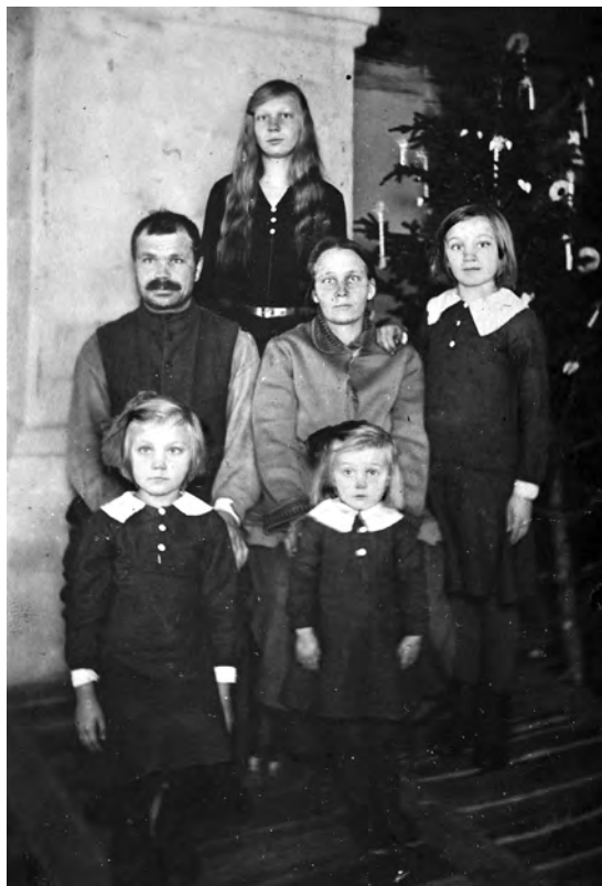
Perepilt 1930. aasta jõulude ajal.