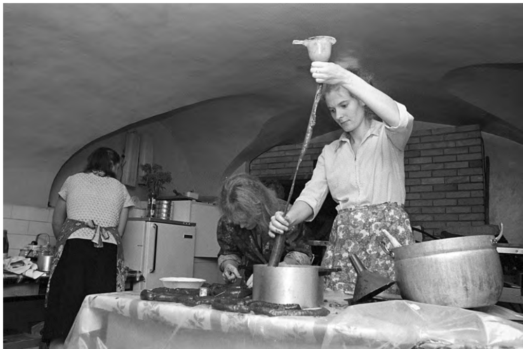
Verivorstide valmistamine taluperenaiste kursustel Sakus 1989. aastal.