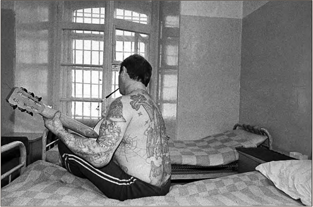
Suur-Patarei vanglas – tätoveeritud vang istub voodil. 1992.