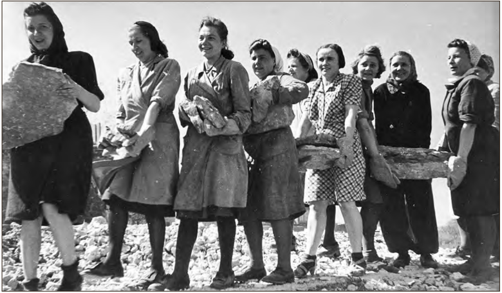
Tallinna Toidukaubastu töötajad taastamistööl Keskturul 1947. aastal.