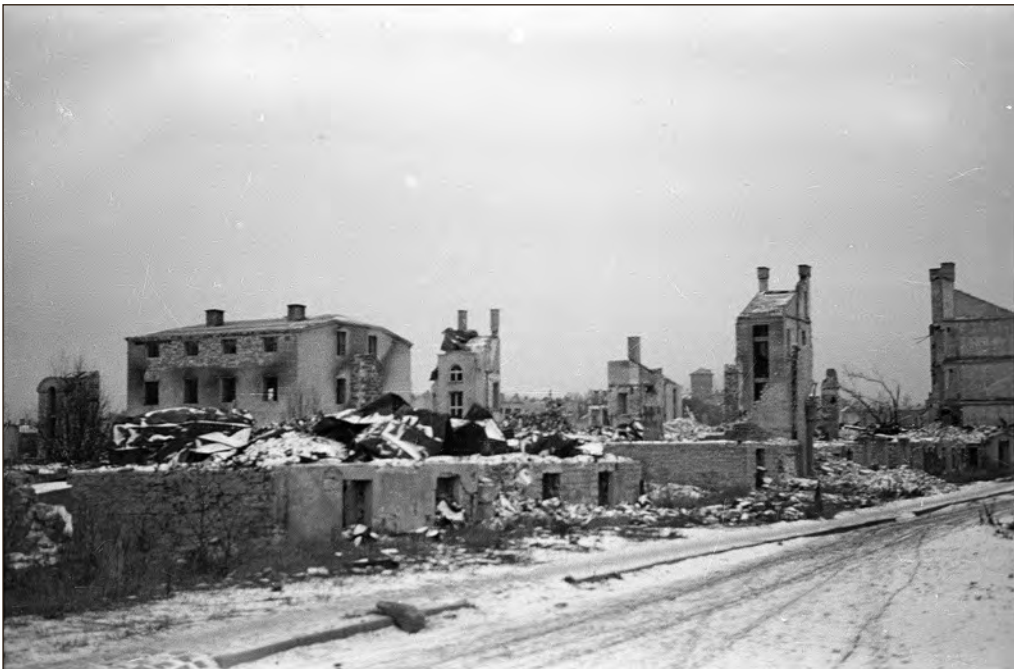
Elumajade varemed Virmalise tänaval 1945. aastal.