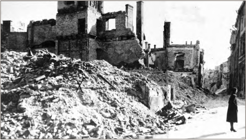
Harju tänav märtsis 1944.