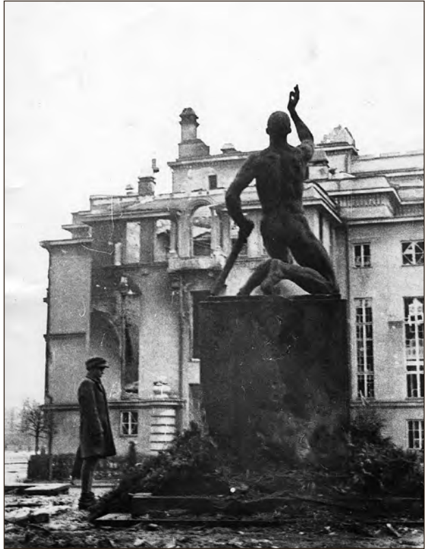
Vabadussõja monument Reaalkooli ees, tagaplaanil Estonia teater märtsis 1944.