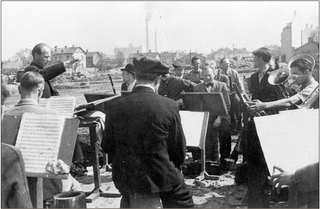
Ringhäälingu orkester esinemas turuplatsi taastamistööl mais 1947.