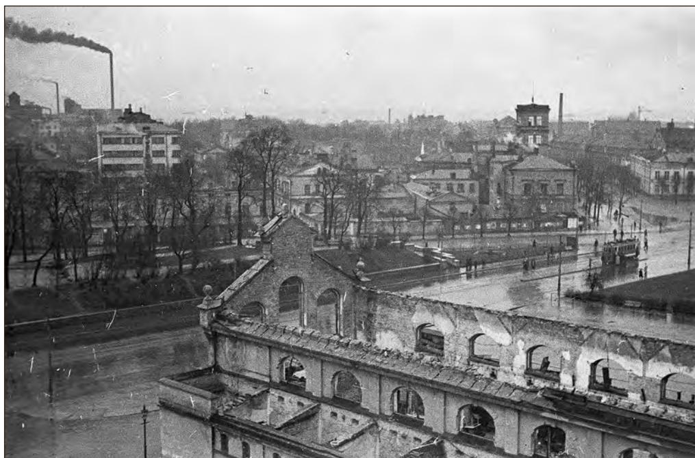
Vaade Estonia teatri varemetelt Viru tänava algusesse 1945. aastal. Esiplaanil turuhoone varemed.