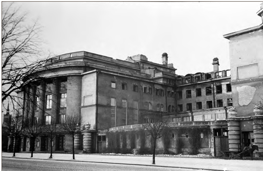
Estonia teatri varemed 1945. aastal.