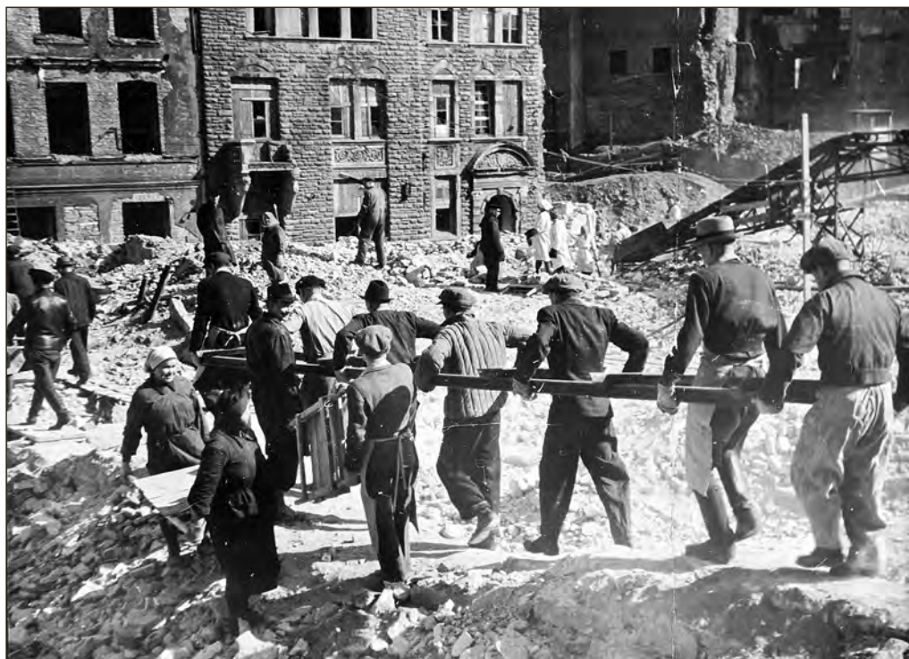
Kommunaalmajanduse ministeeriumi töötajad taastamistööl Harju tänaval 1946. aastal.