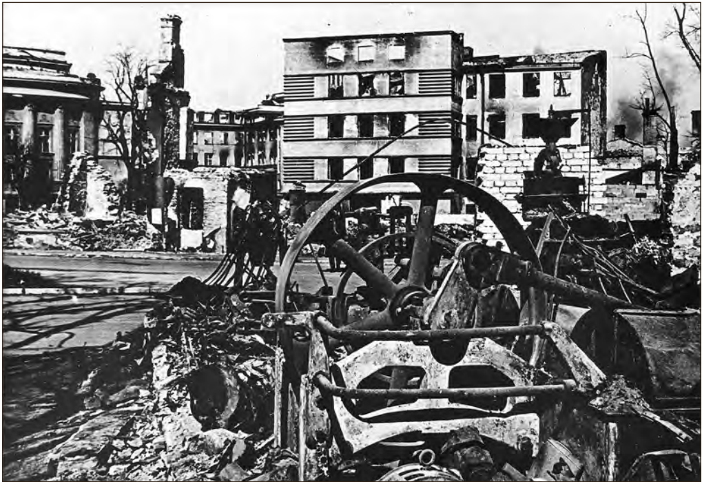
Tallinn pärast Nõukogude armee õhujõudude pommitamist märtsis 1944. Tagaplaanil Estonia teater ja Estonia puiestee.