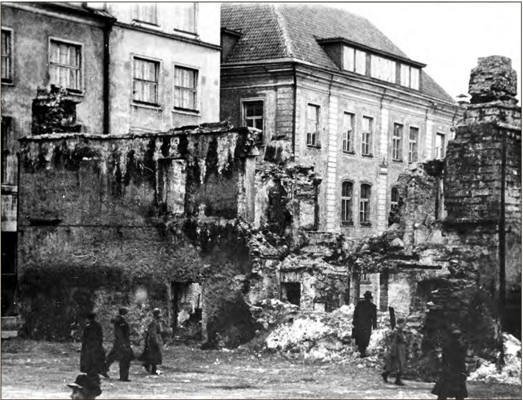
Vaekoja varem Raekoja platsil 1945. aastal.