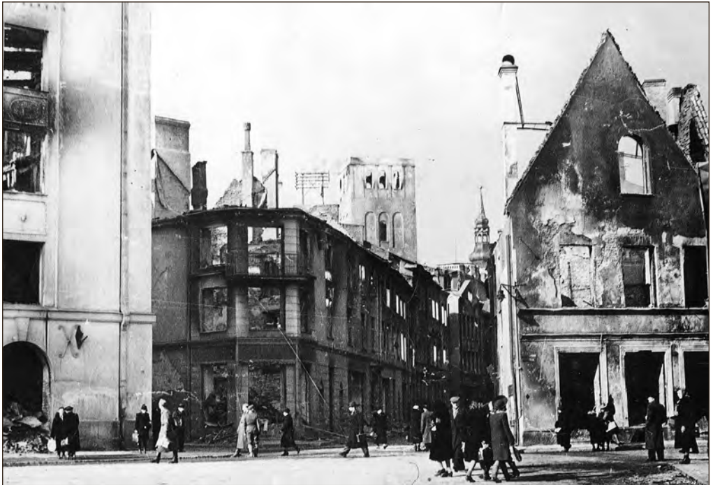
Vana-Posti, Müürivahe ja Suur-Karja nurk märtsis 1944. EFA.656.0.417312