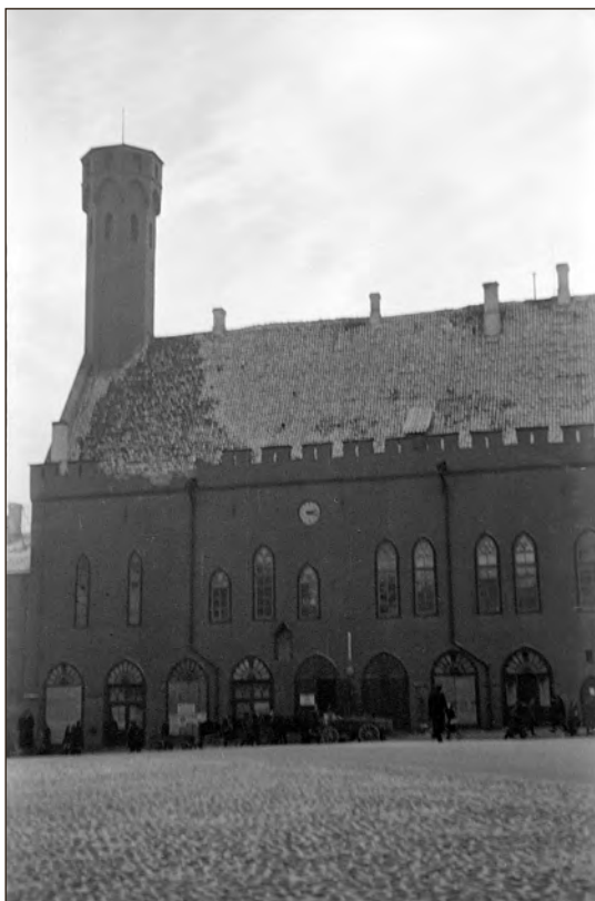
Raekoda ilma tornikiivri ja Vana Toomaseta on paljudele üllatav vaatepilt. Just nii nägi aga Tallinna raekoda välja 1944. aastal.