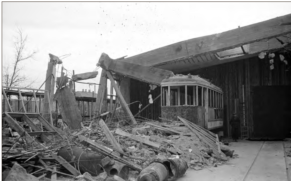
Varemetes Tallinna trammidepoo 1945. aastal.