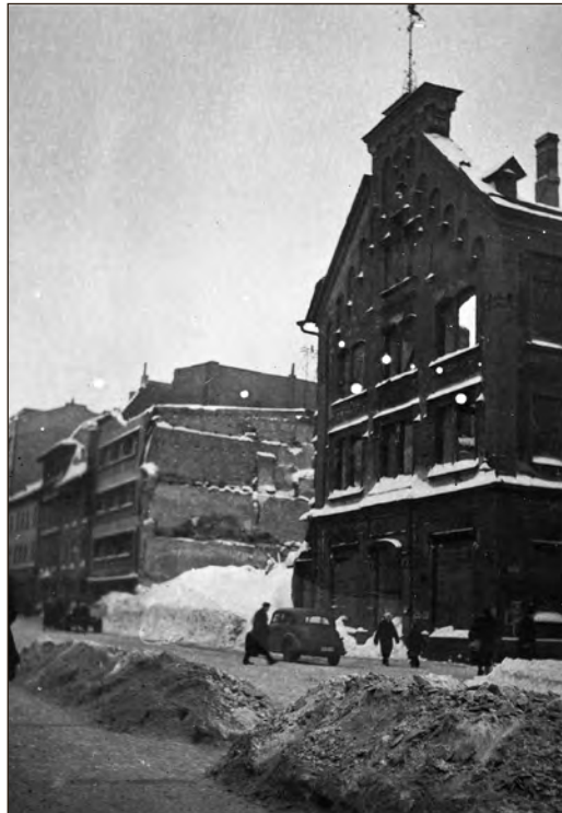
Viru tänav pärast märtsipommitamist 1944. aastal, esiplaanil kino Bi-Ba-Bo varemed.