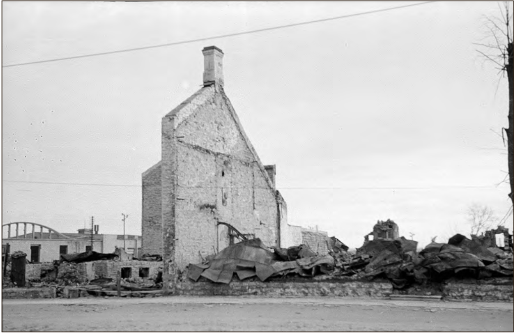
Lutheri fabriku varemed Pärnu maanteel 1945. aastal.