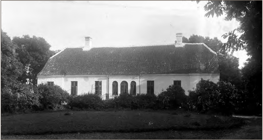
Muratsi mõisa peahoone. Foto: Friedrich von Wolff, 1923. Tartu Ülikooli raamatukogu kunstiajalooline fotokogu, F 192, A-222-1

pärane akende rida fassaadil. Ehitisel oli kaks võimsat mantelkorstnat, üks neist silindervõlviga köögiruumis. Maja all oli ristvõlvagedega täiskelder. Hoonet ümbritsev park oli vabakujundusliku planeeringuga, rühmitatud kontrastsete puudegruppide ja dekoratiivpõõsastega. Puudest domineerisid vaher, saar ja tamm. Pargis oli väike tiik ja ilusammas. Mõisahäärberi juurde viis allee. 56