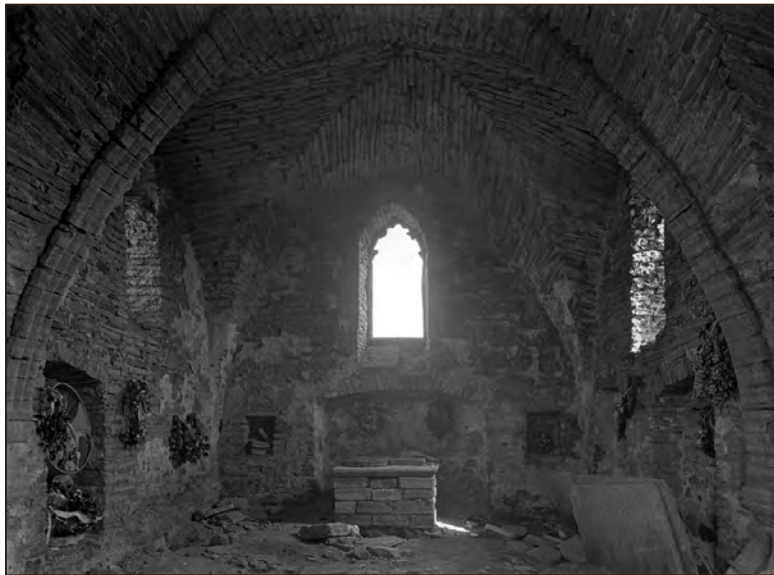
Saha kabeli interjäär 1940. Paremalt on näha kolm serviti asetatud talupoja hauaplaati. Aufnahme-Nr.: 152.362

teada kaks paest tahatud suurt hauaplaati. Esimene on dateeritud 1649. ning teine 1654. aastaga. 73 Neist kummagi tekst ei viita küll sellele, et plaati kasutati ruumis sees, kuid teisalt ei ole samast ajajärgust teada ühtki hauaplaati, mis algselt oleks olnud paigutatud väljapoole sakraalhooneid. Viimane asjaolu lubab Pirita hauatähiseid liigitada siseruumis asetsenud mälestusmärkideks. Plaadid avastati oletatavasti 1928. aastal kloostris juures asunud kalmistu ja varemte vahelise teedevõrgustiku rajamise käigus. On üsna tõenäoline, et need paiknesid luterliku abikabelina kasutust leidnud kõrvakabelis, mis jäeti arvatavasti maha tehnilise seisukorra halvenedes 18. sajandi esimestel kümnenditel. Küsimus, kas need talupoegade hauaplaadid katsid hauakambrit või maahauda, jääb senises uurimisseisus siiski lõpliku vastusetta.