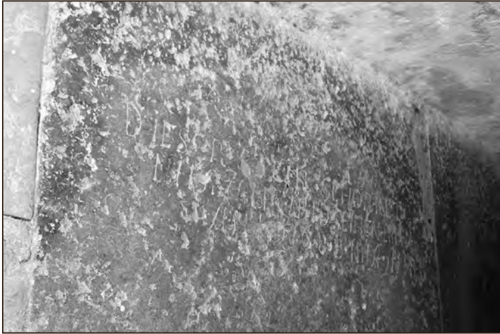
Raidkirjad Nipa Jane hauaplaadil. Foto: W. D. Jõgeda, 2018

Hansen , 3. Hulja mölder Jaan , 4. Weski Tomas Vahakulmust, 5. Muicke Tenu Palmsest, 6. Undla mölder Abram ja 7. Vohnja mölder Hans . 80 Loetelu juures ei ole küll ühtki dateeringut, kuid võib arvata, et see pärineb vahemikust 1699–1701. 81 Praeguseks on säilinud jäänused vaid Muicke Tenu hauaplaadist, mis kuni 2000. aastani paiknes Kadrina kiriku pörandas. Ainsa omataolisena on see võetud muinsuskaitse alla. 82