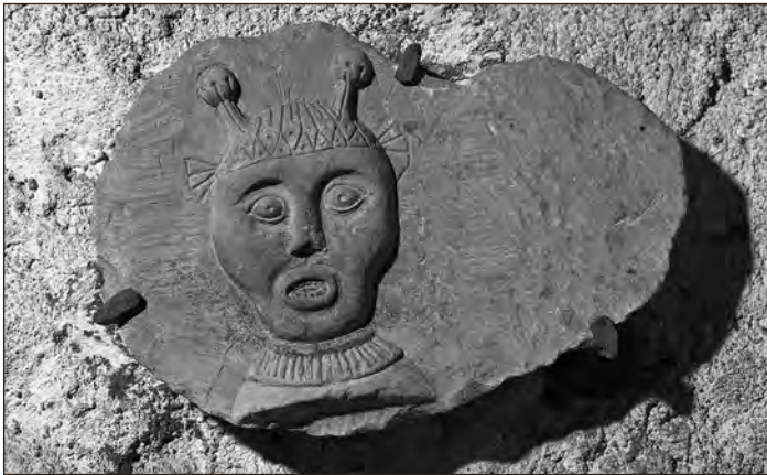
Narr. Raidkivi fragment. TLM Fn 9288:34