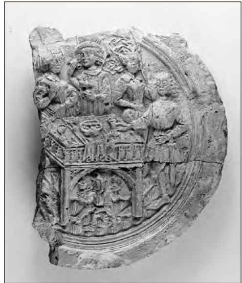
Narrikujutis 15. sajandi alguskümnenditest pärit keraamilisel plaadil. Leitud Jahu tänava arheoloogilistel väljakaevamistel Tallinnas.