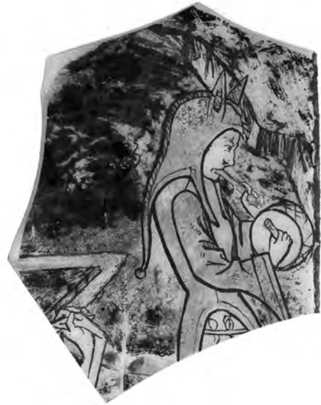
Musitseeriv narr. Jahu tänava arheoloogilistel väljakaevamistel Tallinnas leitud klaasimaalingu fragment, mis pärineb ilmselt 15. sajandist.

Visuaalseid kujutisi narridest on keskaja ja varauusaja alguse Tallinnast säilinud vähe, palju rohkem ei leidu ka allikateid selliste kunagisest olemasolust. Tuntud on tänapäeval Tallinna dominiiklaste kloostris eksponeeritud keskaegne raidkivifragment, millel on näha iseloomulikus kahe sopiga ja kuljustega kaunistatud mütsis ning hambaid paljastavat, ammuli suuga narri. 51 Selle kunstiteose algne asukoht on teadmata. Kauga aega polnud kõnealuse raidkivi kõrvale teisi samaväärseid visuaalseid kujutisi panna, alles 2018. aastal Jahu tänava arheoloogilistel kaevamistel Tallinnas välja tulnud erakordne hiliskeskaegne leiumaterjal tõi põnevat lisa. Nimelt tuli välja katke heal tasemel teostatud klaasimaalingust, millel on kujutatud vilepilli ja trummi mängivat narri iseloomulikus, s. o. eeslikõrvade ja kukeharjaga peakattes. 52 Haruldase leiuga seoses kerkib kohe üles küsimus: kas näiteks sellised võisid ehk välja näha keskaja Tallinna moosekandid? Jahu tänavalt on leitud veel peaaegu tervikuna säilinud keraamiline plaat, millel on armastajapaaridele lisaks kujutatud laua all joogikannu kõrval vedelevat narri, käes lusikas ja kauss. 53 Tõenäoliselt on plaat valminud 15. sajandi algul kusagil Kesk-Reini aladel, võibolla Mainzis, 54 ja usutavasti oli see eksponeeritud mõne tallinlase kodus, kust see aga juba sama sajandi lõpul sattus prügi hulka.