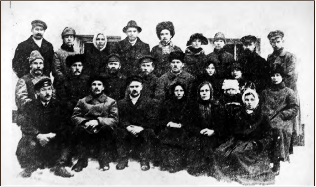
Eestist 1919. aasta detsembris Nõukogude Venemaale vahetatud pantvangid.