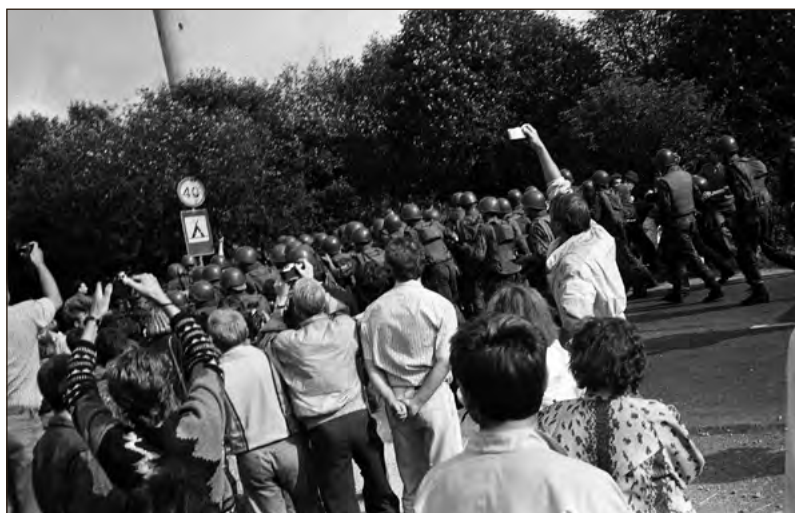
Seoses riigipöördekatsega Moskvast saadeti Eestisse Pihkva dessantdiviis, mis jõudis Tallinna teletorni juurde 21.08.1991.