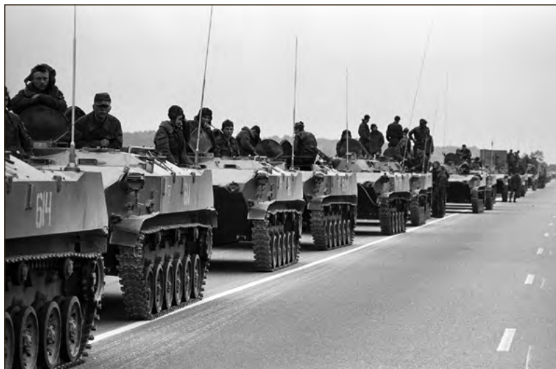
Tankikolonn on Tallinna poole teel. 20.08.1991.