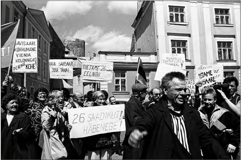
Pikett Toompeal peaminister Edgar Savisaare umbusaldushäätuse poolt ja vastu. 19.06.1991.