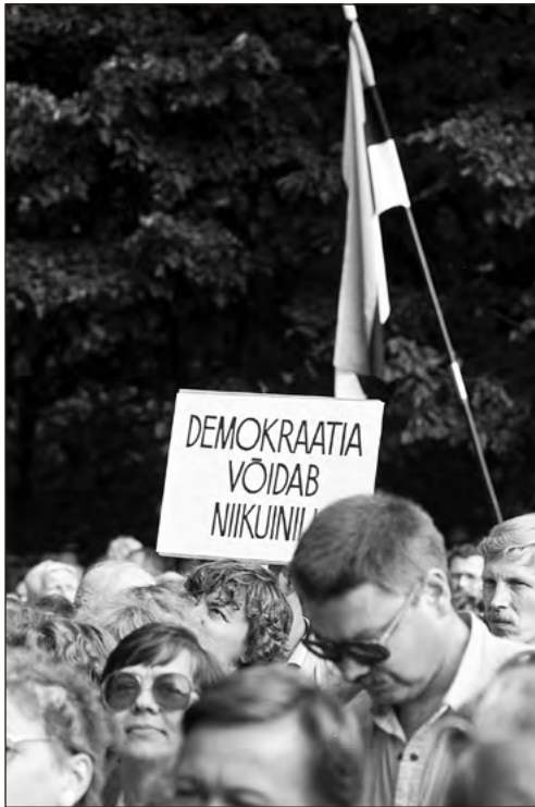
Rahvarinde korraldatud miitingul augustiputši ajal nõuti Eesti iseseisvuse väljakuulutamist. 19.08.1991.