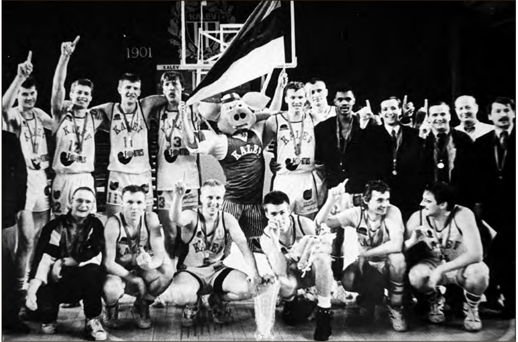
Nõukogude Liidu meistrivõistlustel korvpallis võitis kuldmedali Tallinna Kalevi meeskond, jäädes ühtlasi viimaseks selle tiitli kandjaks. 06.05.1991.