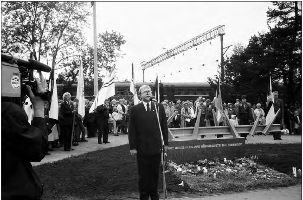
14. juunil 1941 Nõmmelt Siberisse küüditatute mälestusmärgi avamisel kõneleb ajaloolane Mart Laar. 14.06.1991.