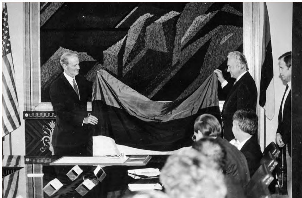
USA riigisekretär James Baker (vasakul) annab Eesti Vabariigi Ülemnõukogu esimehele Arnold Rüütli üle sinimustvalge lipu, mis seisis pool sajandit USA Riigidepartemangu vestibüülis kui Eesti annekteerimise sümbol. 14.09.1991.