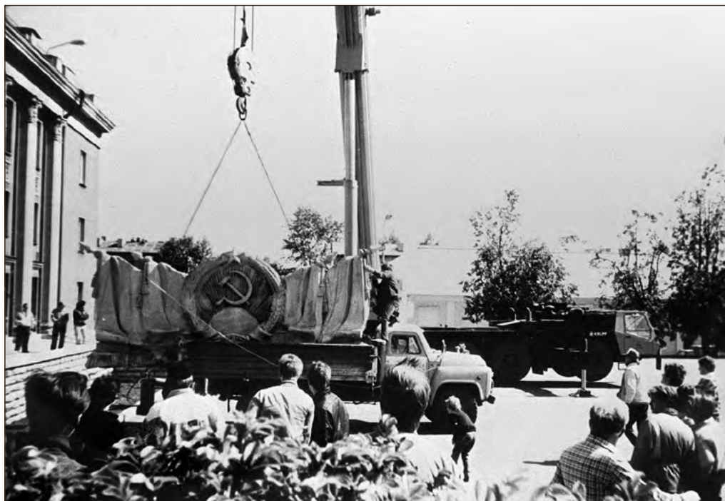
Eesti NSV vapp võetakse Jõhvi administratiivhoonelt maha juba 14. märtsil, samal päeval kui toimus referendum Nõukogude Liidu püsijäämise küsimuses. Samas olid 3. märtsi referendumi tulemused ju teada!