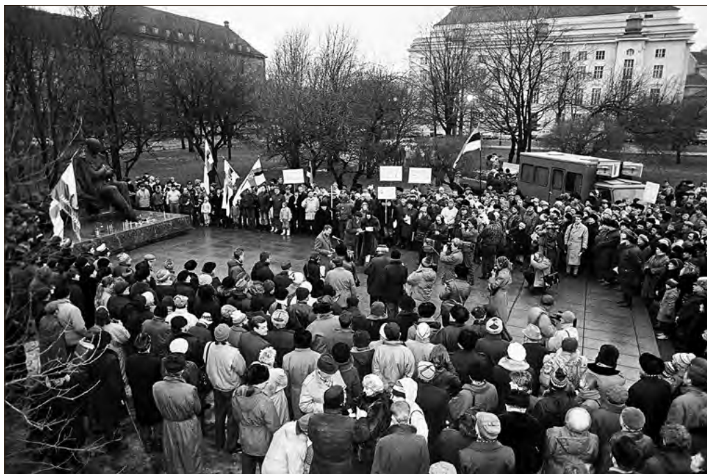
Eesti Vabariigi 73. aastapäeva tähistas rahvas A. H. Tammsaare kjuu juures 24. veebruaril 1991.