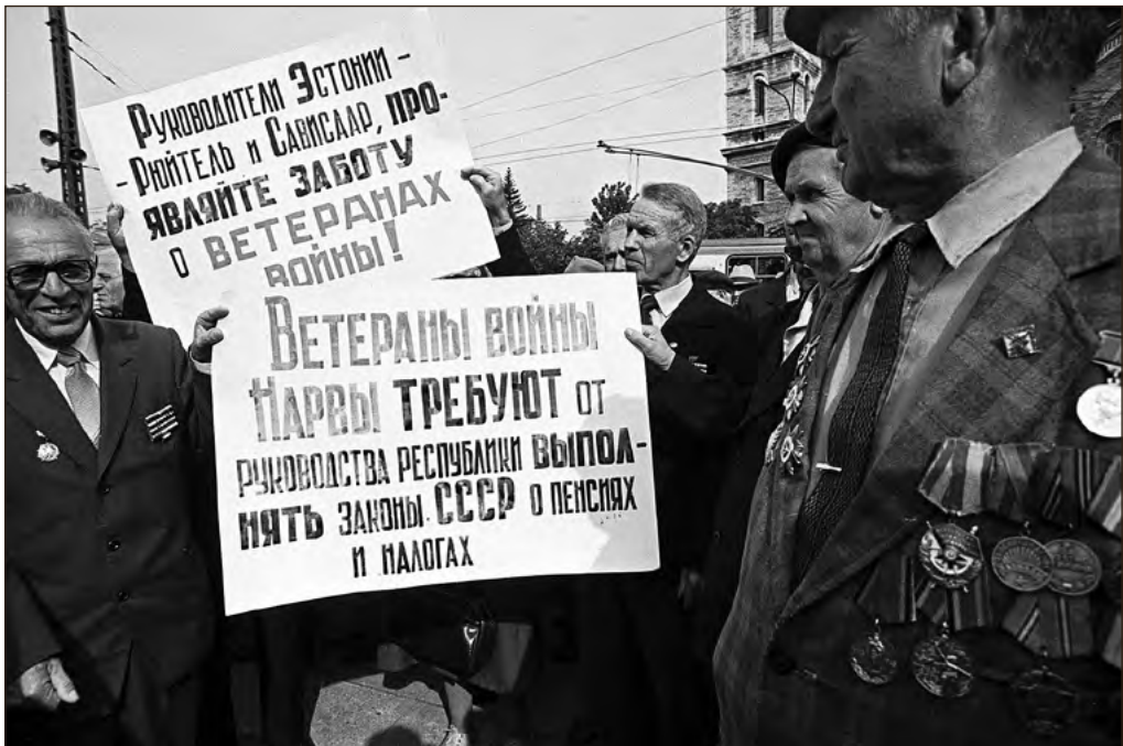
Isamaasõja veteranide ja Interrinde korraldatud miiting Toompeal nõudmistega Eesti juhtidele Rüttille ja Savisaarele hoolitseda Isamaasõja veteranide eest. Teisel plakatil on käskivas kõneviisis: „Narva sõjaveteranid nõuavad vabariigi valitsuselt NSVL-i seaduste täitmist pensionite ja maksude osas.“ 20.06.1991.