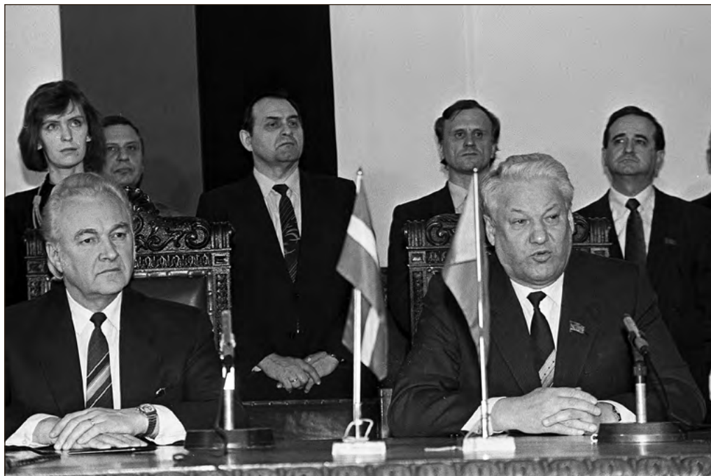
Vene NSFV Ülemnõukogu esimees Boriss Jeltsin (paremal) ja Eesti Vabariigi Ülemnõukogu esimees Arnold Rüütel Toompeal, kus kirjutati alla suveräänsuse tunnustamisele Balti riikide ja Vene NSFV vahel. 13.01.1991.