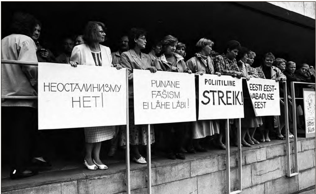
Muude rahvakogunemiste kõrval toimus üldine poliitiline streik iseseisvuse saavutamise toetuseks. Fotol Eesti Projekti kollektiiv. 21.08.1991.