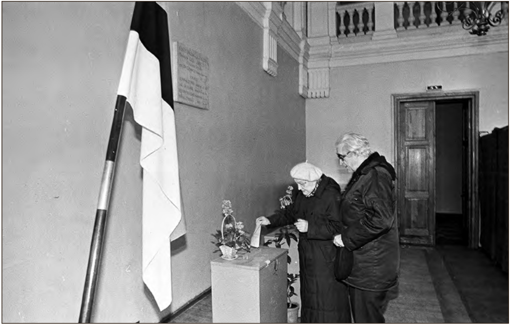
Referendum riikliku iseseisvuse ja sõltumatuse küsimuses toimus 3. märtsil. Referendumist võttis osa 82,86% hääleõiguslikest elanikest. Küsimusele „Kas teie tahate Eesti Vabariigi riikliku iseseisvuse ja sõltumatuse taastamist?“ vastas 77,83% jaatavalt. Fotol hääletajad Tallinna Reaalkoolis. 03.03.1991.