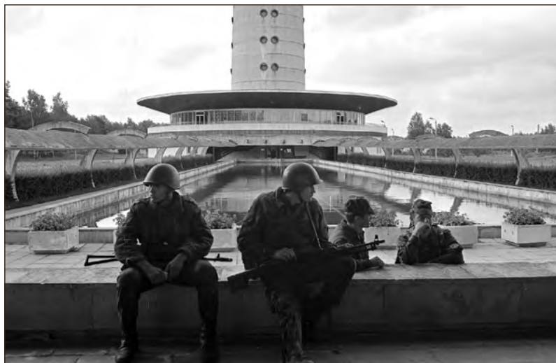
Nõukogude Armeed on jõudnud teletorni lähistele. 21.08.1991.