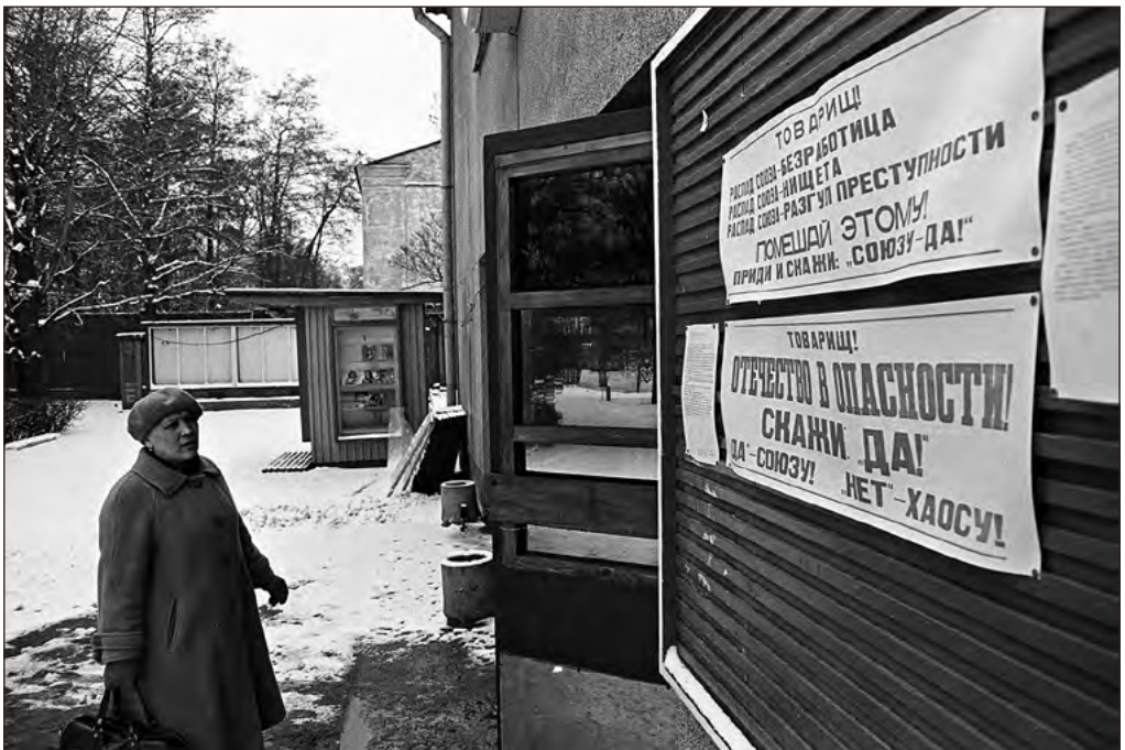
Nõukogude Liidu korraldatud referendum NSVL-i püsijäämise küsimuses. Balti Laevaremonditehase hääletuspunkti seinal on venekeelsed loosungid, mis kutsuvad ütlema liidule „jah“, sest muidu ootavad ees vaesus ja töötus. „Isamaa on hädaohus“ on teise loosungi lause. 14.03.1991.