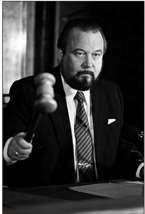
Ülemnõukogu juhataja Ülo Nugise haamrilöök kuulutas Eesti riikluse taassündi 20. augustil 1991. Tõe huvides tuleb märkida, et see foto on tehtud aasta hiljem.