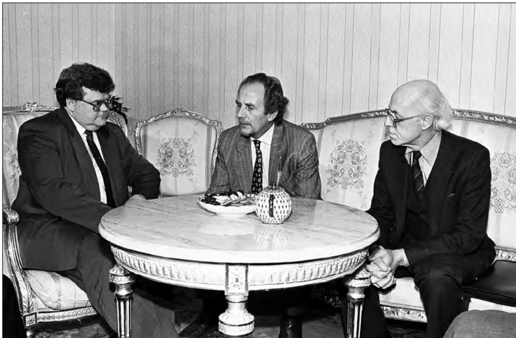
Island tunnustas Eesti iseseisvuse taastamist esimese välisriigina juba 22. augustil. Fotel on Islandi välisminister Ion Baldvin Hannibalsson (keskel) Eestis visiidil jaanuaris 1991. Temast vasakul valitsusjuht Edgar Savisaar ja paremal välisminister Lennart Meri. 24. augustil tunnustasid Eesti iseseisvumist Vene NFSV, Taani ja Rootsi.