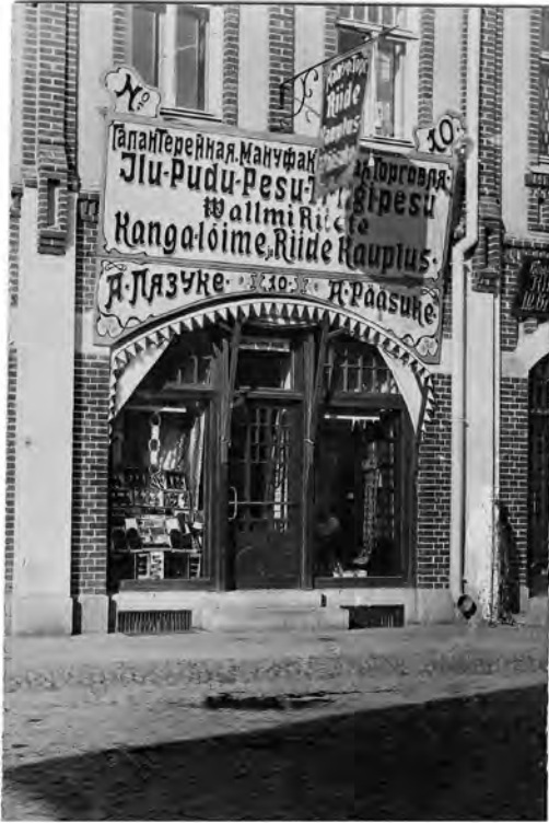
Aleksander Pääsuke's kauplus.

puudalisi kuulisi alla veeretanud, töölised ei võtnud tuult jalgu alla, tundus isegi ohtrasti punakad lõhna nende keskel, töö- niisama sõiduvõorimehed kadusid uulitsatelt rekvisitsiooni hirmu pärast ja nii jäi kogu varandus paigale.