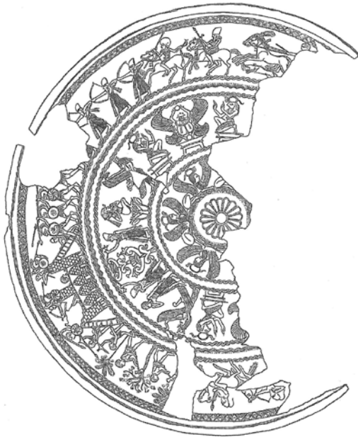
Amathusest Kyprosel ühest hauast leitud Foiniikia karikas u. 700 (Briti muuseum). Kreeka sõdurid on äratuntavad ümmarguste kilpide ja kiivreid kaunistavate harjastuttide läbi.

võtta kus tahes, mistõttu näib üritus seda täpsemalt lokaliseerida üpris lootusetu ja vahest mõttetugi. Pithekussai võis aga olla üks esimesi paiku, kus see tava kreeklastele omaks sai. 26