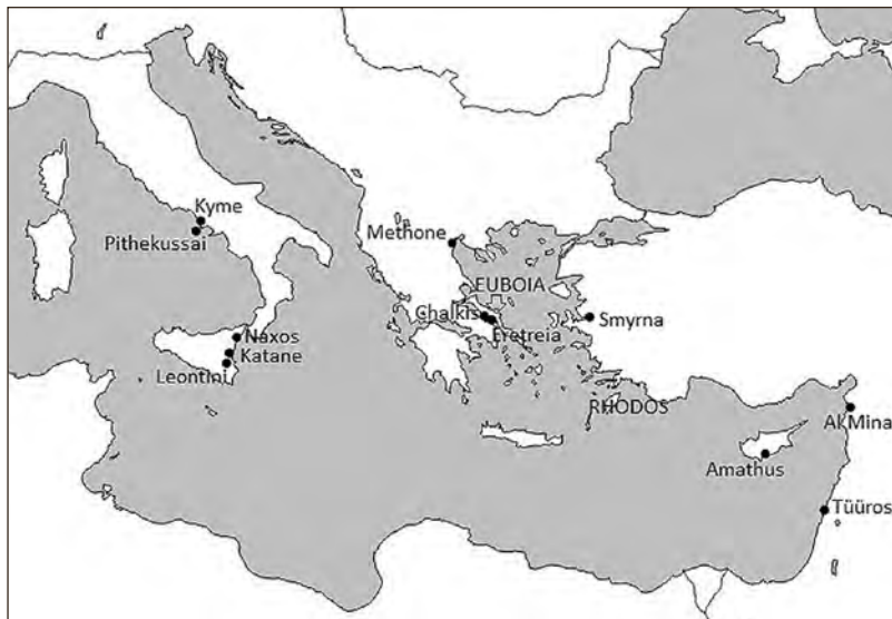
Vahemeri. Kaart: Mait Kõiv

senisest silmapaistvama esiletõusuni. Euboia omakorda oli toonase Kreeka üks arenenumaid ja jõukamaid piirkondi ning sealsed meresõitjad kõige aktiivsemad suhtlejad välisilmaga. Keraamikaleidude järgi otsustades olid euboialastel Vahemere idaosas tihedad sidemed suure foiniikia linna Tüürosega, samuti kauplesid nad agaralt Põhja-Süüria rannikuasulas Al Minas (praegune kohanimi, muistne nimi oli arvatavasti Potamoi Karōn). 7 Läänes kuulusid nende rajatud asulate hulka lisaks Pithekussai ja Kymele esimesed kreeka asundused Sitsiilias – Naxos (praeguse Taormina juures), Katane (Catania) ja Leontini. 8 Paratamatult puutusid euboialased kõikjal kokku kaubanduspartnerite ja konkurentide foiniiklastega, kes juba hiljemalt 9. sajandist peale Vahemere lääneosas seilasid ja selle rannikule ning saartele oma asulaid rajasid. Suurel määral motiveerisid nii foiniiklasi kui ka kreeklasi Hispaania ja Itaalia metallivarud. 9