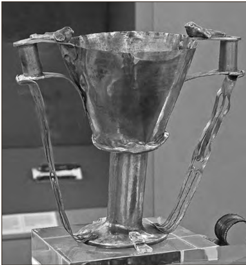
Kuldõu Mükeene 16. sajandi ülikuhauast (Ateena arheoloogiamuuseum).

Kõike seda silmas pidades näib tõenäoline, et isegi kui Pithekussaist leitud peeker kuulus Nestori-nimelisele mehele (või oli kingitud sellenimelisele poisile) kätkes ta ometi ka vihjet kangelaseepikast tuntud kuulsale jooginõule. Loomulikult polnud Pithekussai savist jooginõu tõsimeeli mõeldud esitama kuulsa kangelase väärismetallist karikat, mis oli pealegi kaunistatud tuvidega ja nii suur, et teda täidetuna vaevalt keegi peale Nestori tõsta jaksas. Pigem oli tegemist mängleva, peaaegu iroonilise viitega kuulsale esemele, mis tõi markantselt esile erinevuse suure muistse metallanuma ja elegantselt kerge kaasaegse savipeekri vahel. Kas seeläbi viidati