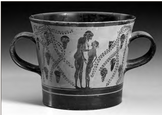
6. sajandi veinikruus (Bostoni kaunite kunstide muuseum). Figuuride kohale kirjutatud sõna kalos – „ilus“ – on tavapärase viide poisi atraktiivsusele.

Millal see komme alguse sai, on vaieldav. Juured võivad ulatuda muistsetesse initsiatsiooniriitustesse, mille raames täisikka pühitsetavaile noortele said mitmetes kultuurides muu hulgas osaks soovahetust simuleerivad rollimängud. Kuid konkreetseid tõendeid paiderastia kohta leiab alates 6. sajandist eKr., ja siis juba hulgaliselt nii vaasimaalist kui ka luulest. On arvatud, et see kajastub ka Patroklose ja