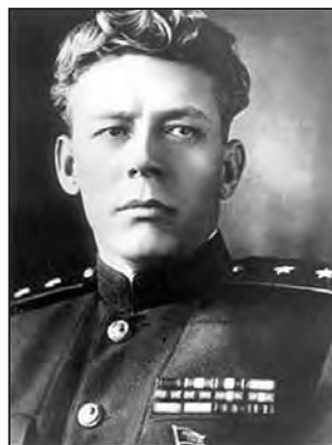
Mitme küüditamisoperatsiooni üldjuht kindralleitnant Sergei Ogoltsov.

Kattenimede kasutamine küüditamisoperatsiooni puhul on seletatav MGB toimikupõhise operatiivarvestuse asjaajamistavadega, kus kattenimede kasutamine oli operatsioonide või operatiivtoimikute, näiteks agentuurtoimikute puhul reegel. Ukraina operatsiooni puhul on