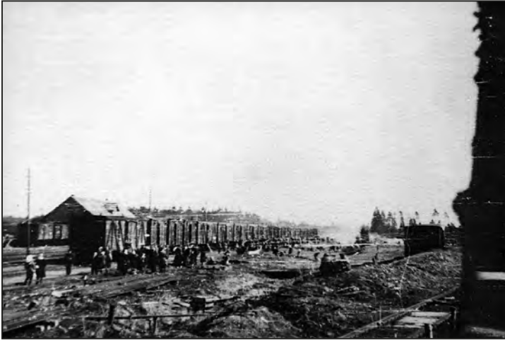
Selle allkiri võiks olla: „Priboi“ Lätis: Stende pealelaadimispunkt 25. märtsil 1949. Foto: Janis Indriks. Läti okupatsioonimuseum, OMF 6533-2

kattenime „Zapad“ (vene k. Lääs) ja piirkonna seos ilmne. Reeglina sama kattenime, mida oli juba analoogsel puhul kasutatud, uue operatsiooni kohta enam ei tarvitatud.