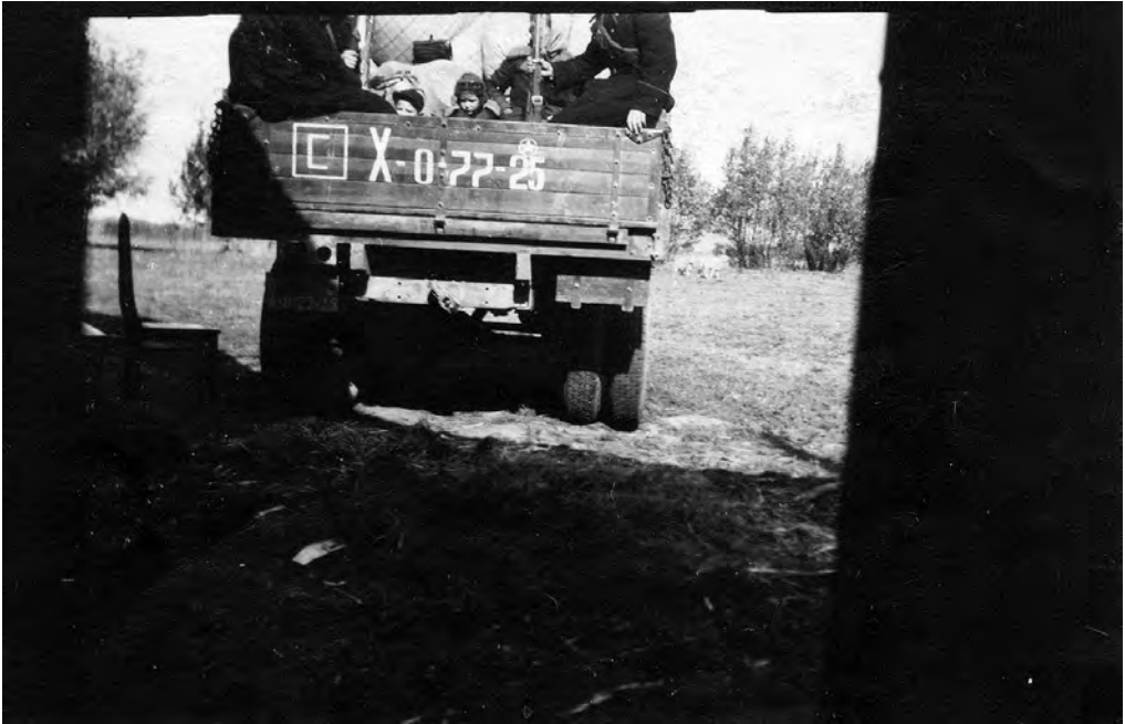
Salaja võetud pilt küüdiautost Kaunase lähedal Leedus operatsioonist „Osenj“ (Sügis) oktoobris 1951.

Lõpetuseks võime tõdeda samamoodi nagu kümme aastat tagasi: on veel vara öelda, et märtsiküüditamine on läbi uuritud ja et me teame sellest kõike. 52