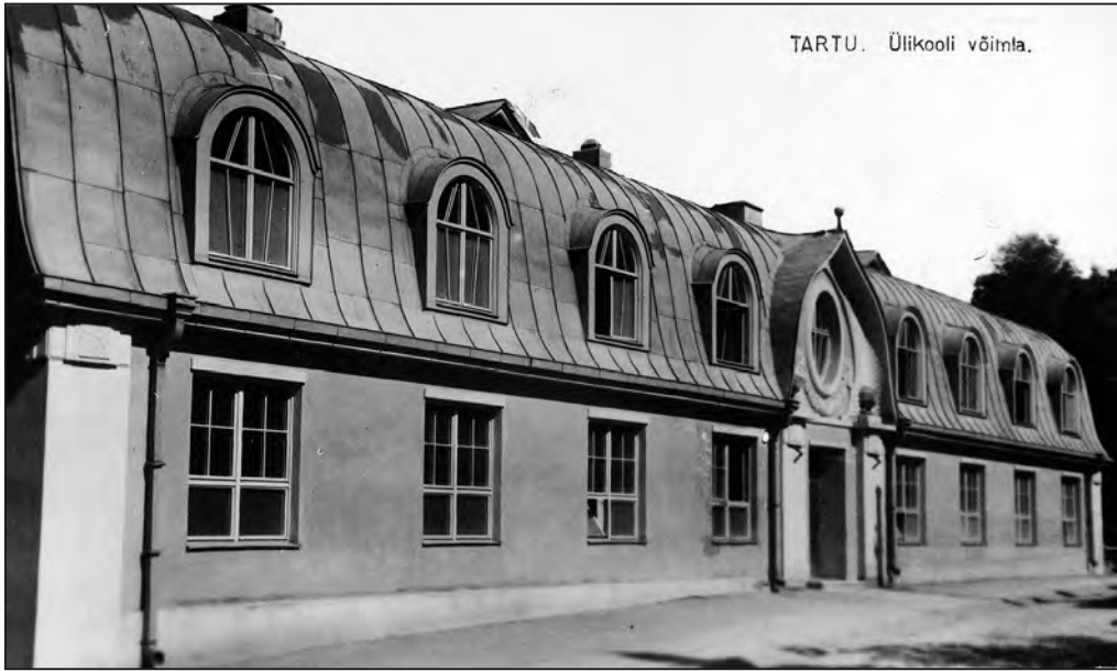
Tartu Ülikooli võimla 1931. aastal.