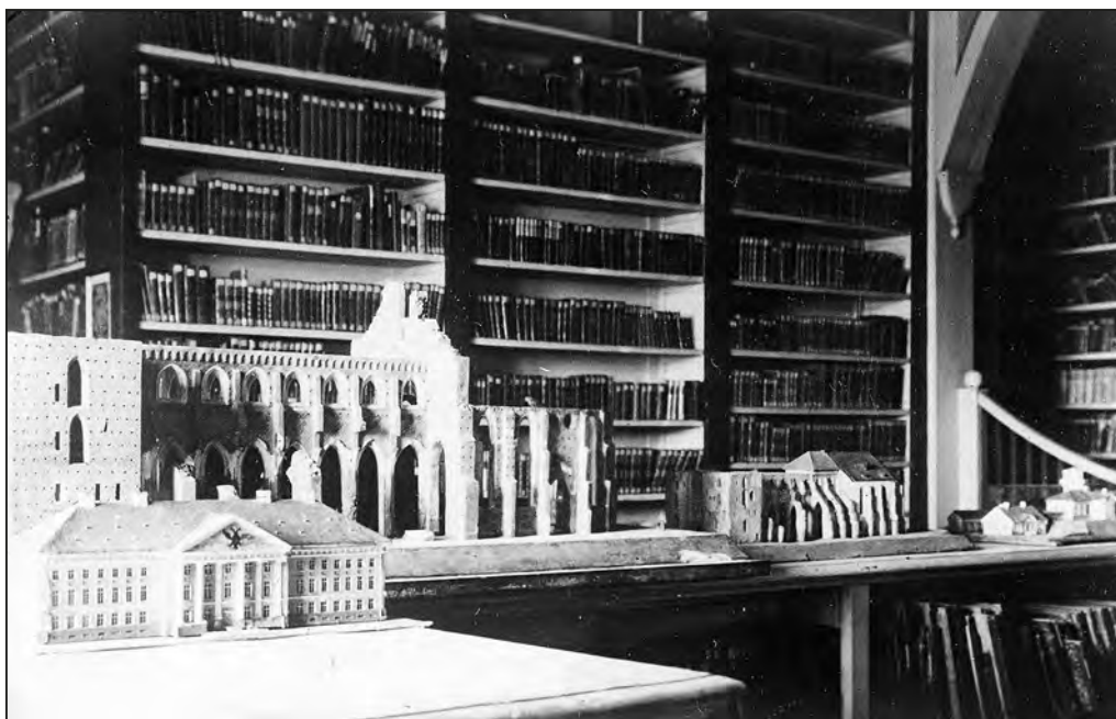
Tartu Ülikooli raamatukogu hoidlaruum. Meeldetuletuseks, et peamiseks tarkuseallikaks olid veel raamatud. 1930.