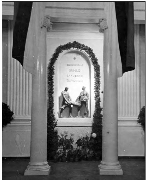
Rahvusülikooli 20. aastapäeva tähistati suurejoonelisemalt. Sel puhul avati mälestustahvel Vabadussõjas langenud üliõpilastele. 01.12.1939.