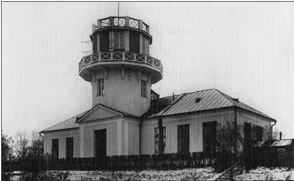
Tartu Ülikooli tähetorn 1934. aastal.