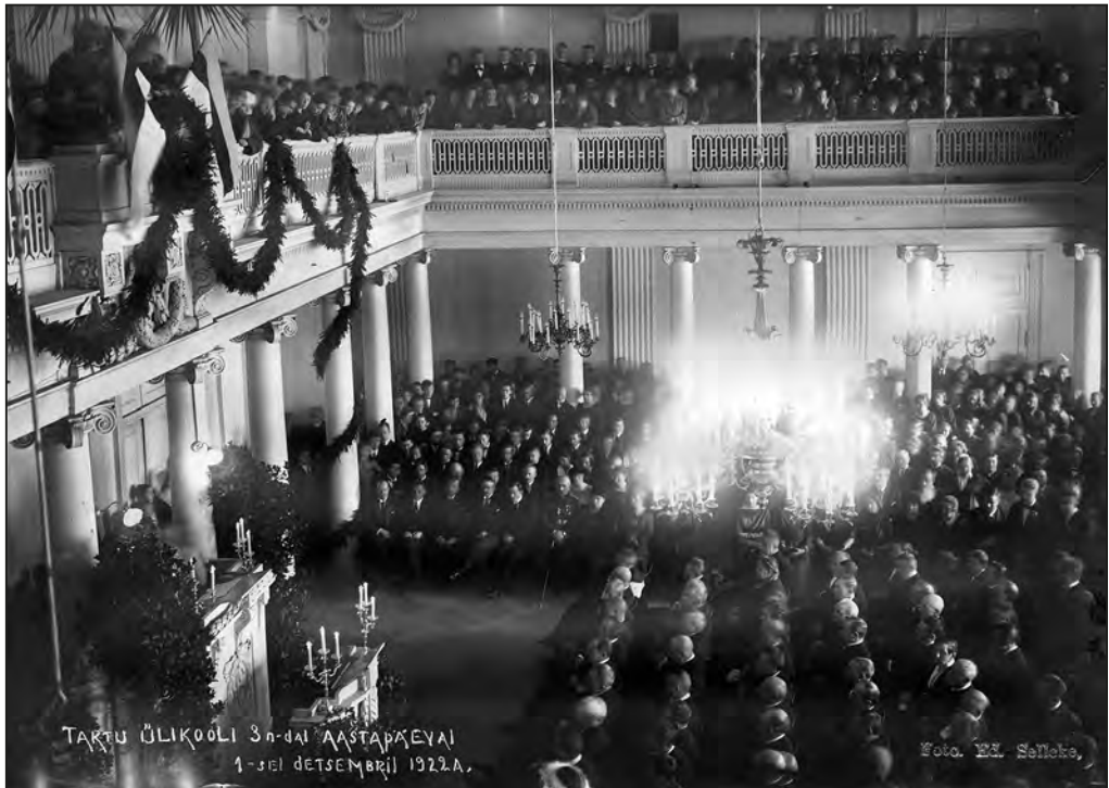
Rahvusülikooli kolmanda aastapäeva aktus Tartu Ülikooli aulas 1. detsembril 1922.