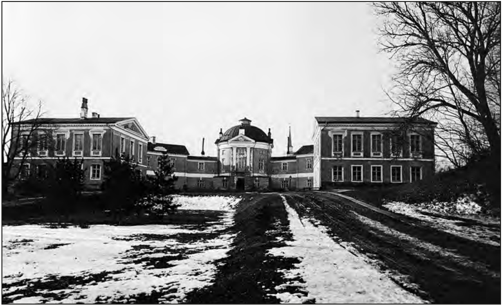
Tartu Ülikooli vana anatoomikum 1940. aastal.