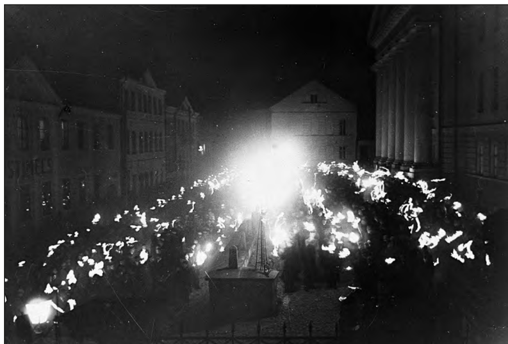
Kevadine tõrvikutega rongkäik on vanimaid ja tuntumaid üliõpilaste traditsioone. Rongkäik on jõudnud peahoone ette. 01.05.1940.