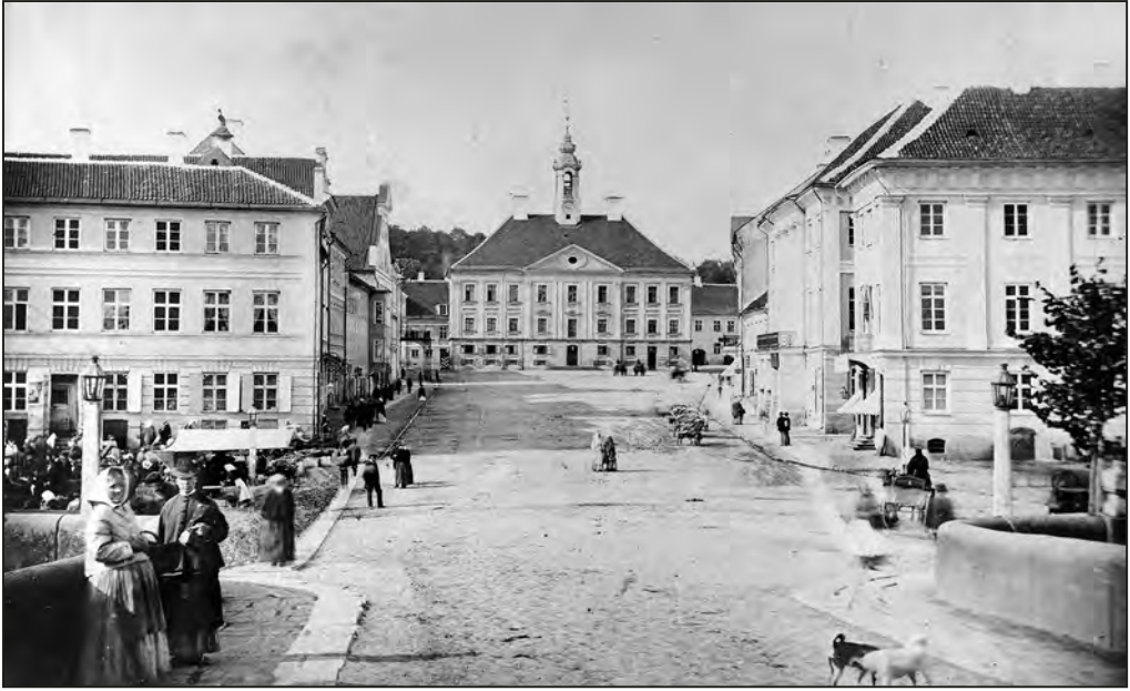
Vaade raekojale 1930. aastatel.