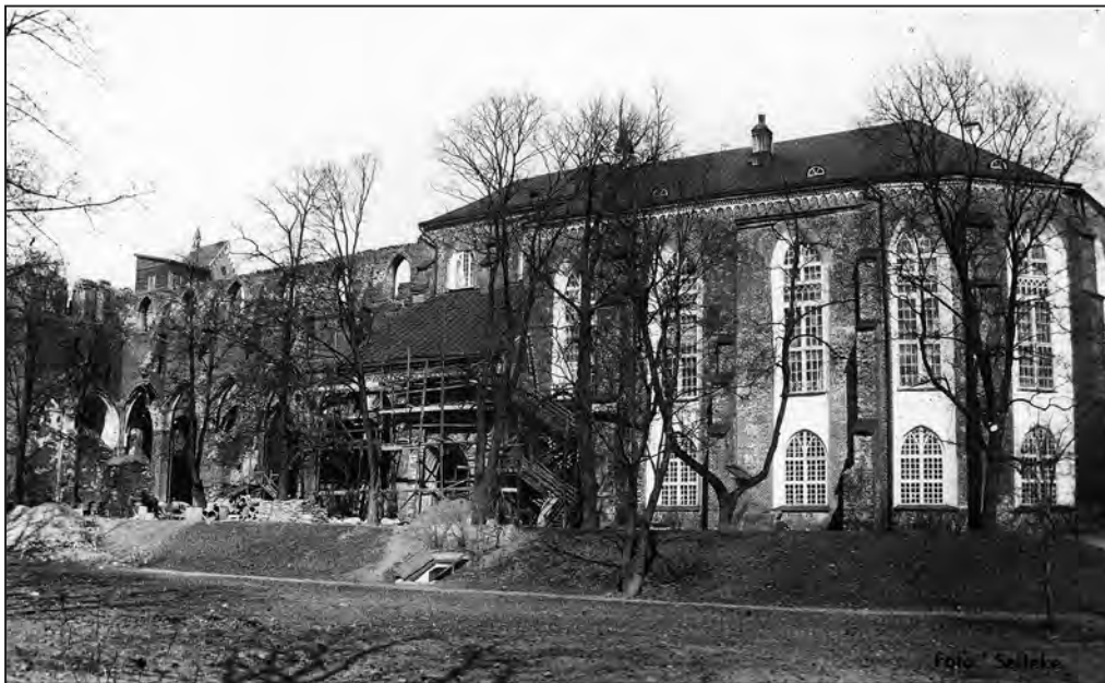
Tartu Ülikooli raamatukogu Toomemäel 1927. aastal.