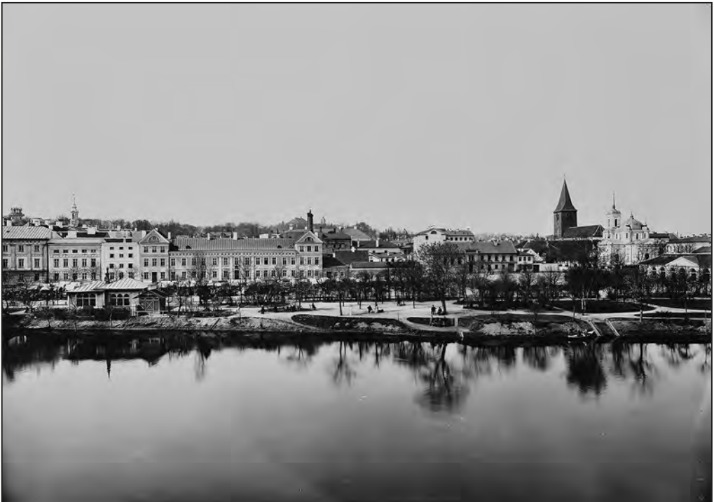
Tartu vaade Emajõe kaldalt 1914. aastal. EFA.7.7.47