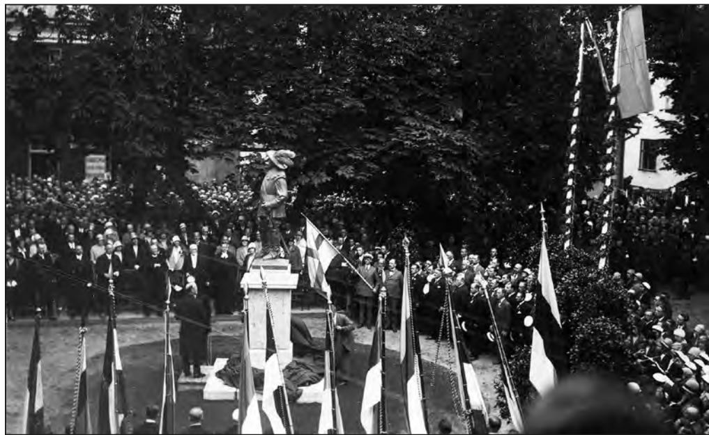
Rahvusülikool pidas meele Tartu Ülikooli asutajat, Rootsi kuningat Gustav II Adolfit, kelle skulptuur avati 26.06.1928.