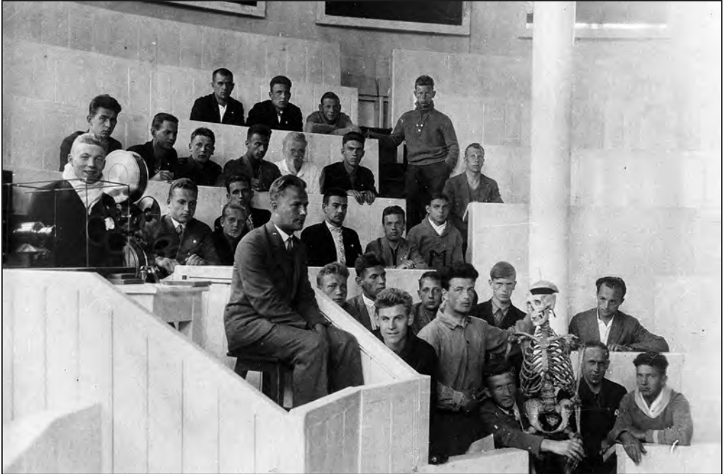
Üliõpilased loengus vana anatoomikumi ringauditooriumis.1930. aastatel.