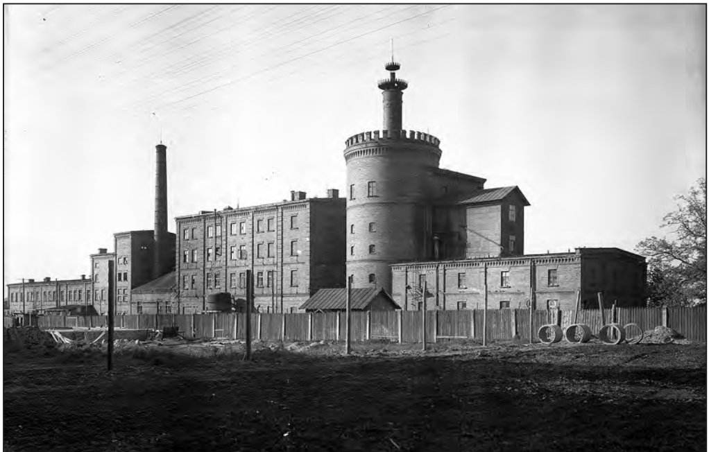
Tartu õlevabrik 1940. aastal. Kahtlemata oluline asutus ülikoolilinna jaoks.