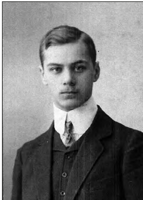
Alfred Rosenberg Reaalkoolis 1909. Repro

Alfred Rosenberg oli Moskvast üle elanud oktoobripöörde, kogenud sellega kaasnenud anarhiat ning bolševike vägivaldat. Temast sai veendunud antikommunist, kes kogu oma järgnevas elus seostas kommunismi teooria ja praktika juutidega. 30. novembril 1918 pidas ta Tallinnas mustpeade majas ettekande marksismist ja juutidest, sõitis järgneval päeval koos lahkuvate Saksa sõjaväelastega Berliini ning peagi sealt edasi Münchenisse. Eialgu ei leidnud Rosenberg revolutsioonimeelses linnas tööd, kuid õnneks – või pigem õnnetuseks – kohtus literaadi ja kirjastaja Dietrich Eckartiga, kellele kuulus oluline roll natsionaalsotsialistlike töökspidamiste levitamisel. Tema kirjastus ostis ühe aastakümneid tagasi asutatud ajalehe ja kujundas selle ümber NSDAP häälekandjaks nimega Völkischer Beobachter. Rosenbergist kujunes Eckarti kaastööline, ta