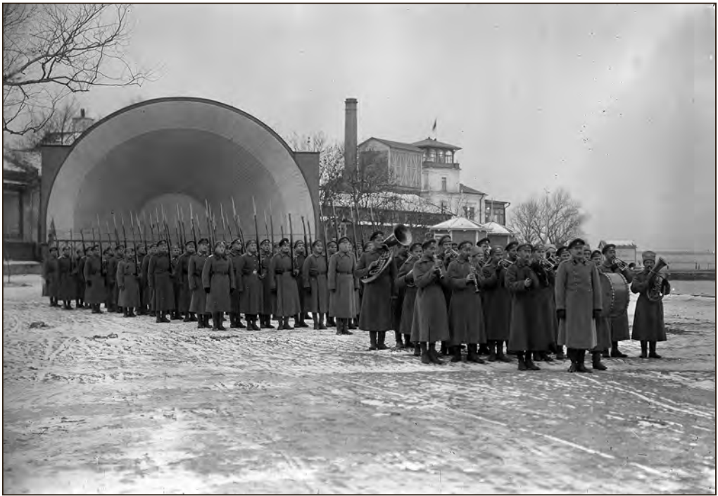
1. eesti polgu õppekomando ja orkester Haapsalu kuursaali ees.