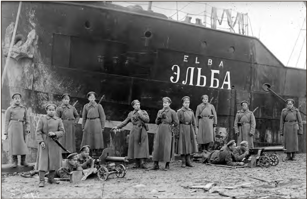
1. eesti polgu kuulipildujate komando enne Muhu operatsiooni.