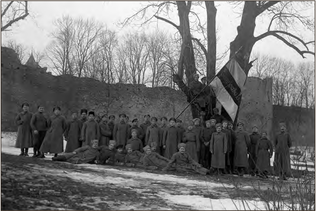
1. eesti polgu 4. rood Haapsalus.