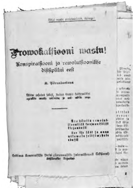
„Provokatsioon vastu!“ – Illegaalseks levitamiseks riidele trükitud variant.