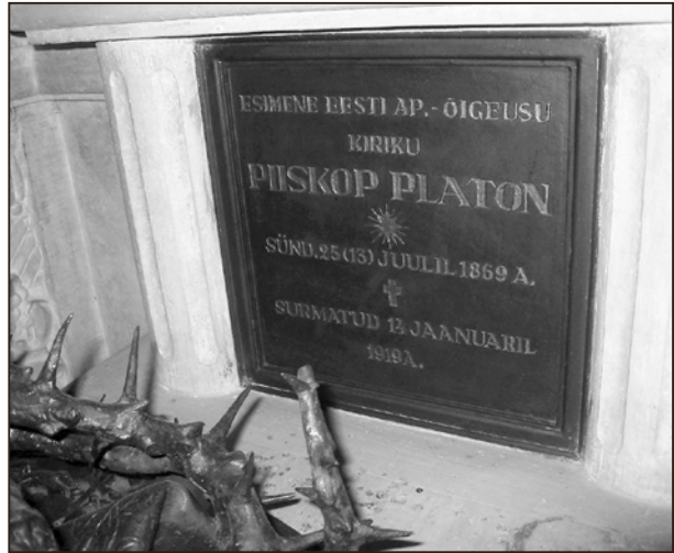
Nimeplaat piiskop Platoni hauamonumendil.