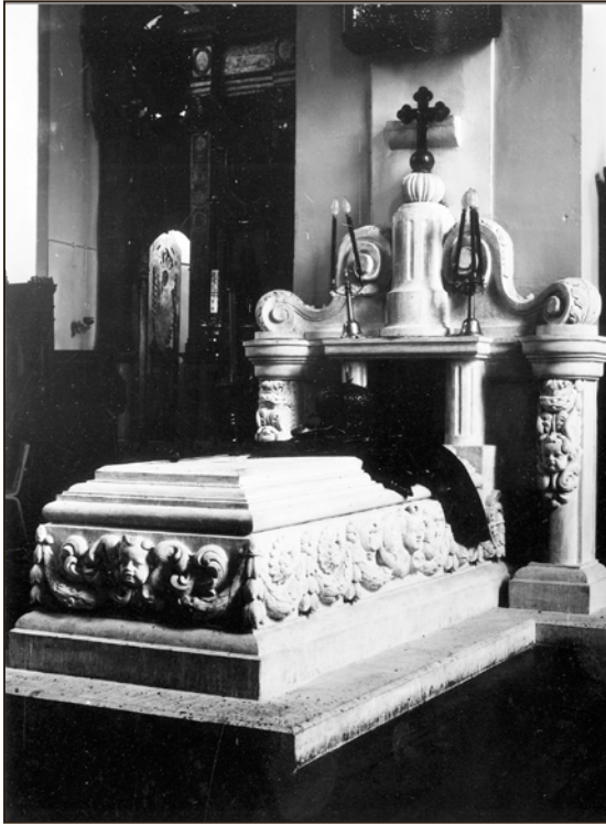
Piiskop Platoni sarkofaag.

tasse sinna pesa ehitavad ning oma laulu ja elava liikumisega kogudust röömustavad.