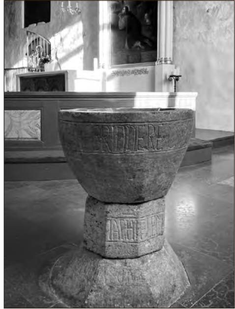
Siuntio kiriku ristimiskivi, u. 1550.

Tallinna meistriks, 21 ent kas see nii oli, jääb esialgu lahtiseks, sest siinsetest arhiiviallikatest pole õnnestunud tema kohta andmeid leida. 22