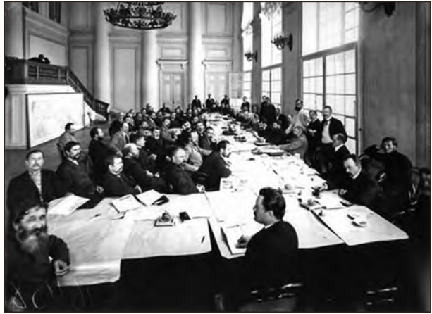
I Riigiduumaa agraarkomisjon. Repro

Rahvuslike, konfessionaalsete ja regionaalsete fraktsioonide algatuslikku rolli duumas on hinnatud tagasihoidlikuks, mida ei saa öelda näiteks poolakate ja eesti-läti saadikute kohta. Balti-teemaliste projektide algatajate ja esitajate kohta annab teavet ülevaatele lisatud nimekiri. Mittevene saadikute ühistegevusest rahvuslike nõudmiste esitamisel kõneleb lisatud dokument 1915. aastast.