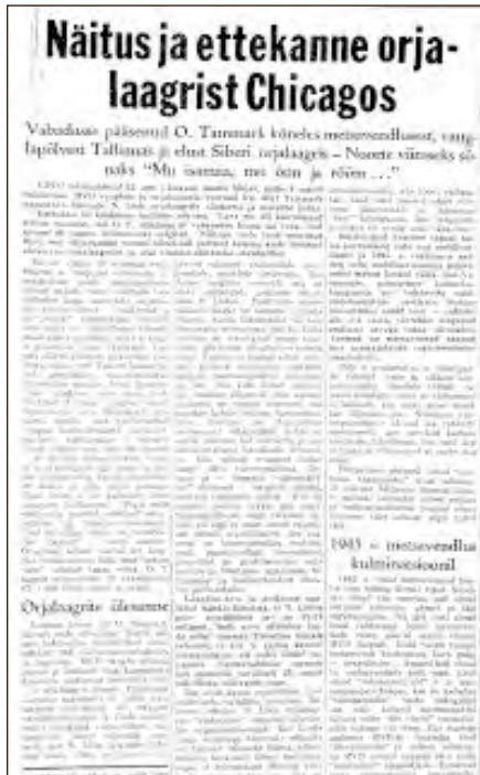
Näitus ja ettekanne orjalaagrist Chicagos. – Vaba Eesti Sõna = Free Estonian Word : Estonian weekly, 7. mai 1959.

lõpul on kohe vaja relvastatud mehi Kodu-Eesti pinnal korra loomiseks ning peidetud relvad ja laskemoon tuuakse kohe välja Eesti korravalve üksuste varustamiseks. Kuid teatavasti jäi see kõik unistuseks. [– –]