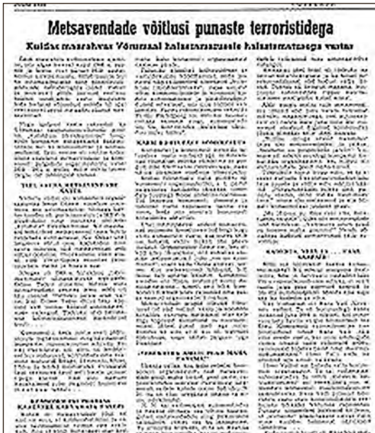
Metsavendade võitlusi punaste terroristidega. – Võitleja, 1. juuni 1958.

sõkaldest eristada. Üldistavalt jääb silma üsna kõver pilt, kuid see on ka mõistetav esiteks allikate ebamäärasuse tõttu, teiseks arvestades konteksti. Tonaalsus polegi suunatud otseselt metsavendluse objektiivsele kajastamisele, rõhuasetus oli üldisemalt suunatud „kannatavale kodumaale“ ja sedakaudu ka vastupanuvõitluse eksponeerimisele. Sellele lisaks veel mingil kujul suunatud külma sõja propagandana, mis kajastab üldist vastupanu igal pool NSV Liidu okupeeritud piirkondades või selle mõjusfääri langenud riikides.