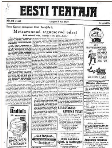
Metsavennad tegutsevad edasi. – Eesti Teataja, 6. mai 1950.

kalt fantaasia valdkonda kuuluvaid detaile või meelevaldseid üldistusi.