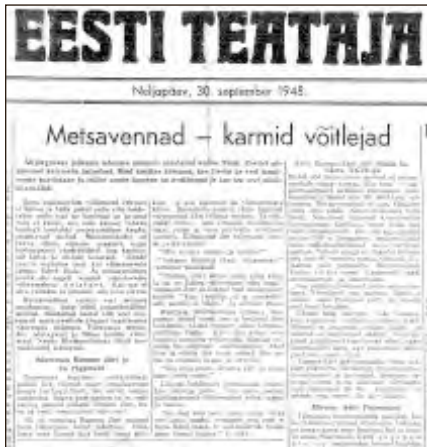
Metsavennad – karmid võitlejad. – Eesti Teataja, 30. september 1948.