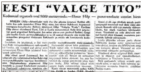
Eesti „Valge Tito“. – Vaba Eesti Sõna, 18. veebruar 1950.

Informatsiooni Eestis toimuva kohta avaldati ajakirjanduses jooksvalt. Tundub, et suuresti tugineb see avalikele allikatele (s. t. sovetlikud ajalehed, raadio, repatrieerimisametkondade propagandamaterjalid, aga ka nopped Lääne ajakirjandusest), millele on lisatud põge-