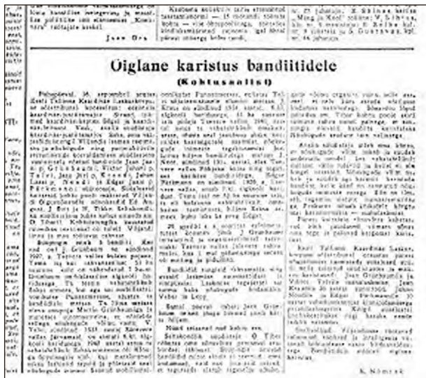
Õiglane karistus bandiitidele. – Postimees, 21. september 1945.

koju tagasimeelitamiseks ning mõistagi ei kajastanud see kirjavara otseselt relvastatud vastupanu või muid „kodanliku natsionalismi“ ilminguid. Kuid pagulaste mõjutamisel rakendati parema puudumisel ka ENSV ajakirjandust, eelkõige partei keskkomitee väljaannet Rahva Hää, mis oli oluline mõjutusvahend järgnevatel aastatelgi. 67