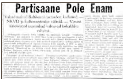
Partisaane Pole Enam. – Vaba Eesti Sõna = Free Estonian Word : Estonian weekly, 12. aprill 1952.

Näiteks üks lõik 1951. aastast: „Küsimusele, kuivõrd on õnnestunud metsavendlusel end säilitada üle nende pikkade aastate, eriti nüüd, kus üksiktalud on sunnitud kolhoosidesse, vastas mees kodumaalt järgmiselt: „Minu lahkumine Eestist sündis küllalt kaua aega tagasi, nii et ma sellele küsimusele võin vastata ainult kaudselt.“ 18