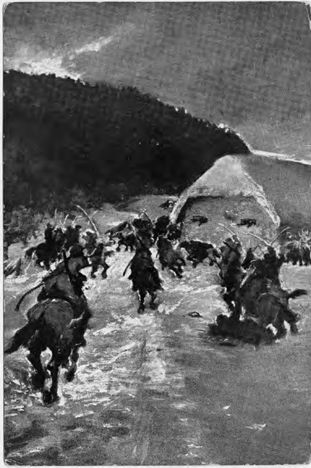
N. Jasnetzky. Esimese ratsapolgu eelsalga kokkupõrge vaenlase ratsaväega Munamäe all märtsis 1919. Postkaart. Ajaloomuuseum. AMF26962

küsiti vaid 5 senti. 142 Kui veel võrdlusi tuua, siis 1 sendi eest sai koolijüts kaks tilgakommi (tänapäeva mõistes vist Lehmakese komm) ja Tallinna turul tuli kahe kanamuna eest välja käia 12 senti, kümne suitsuräime eest 7–12 senti, üks sidrun maksis 8 senti, sama hind oli peakapsal. 143 Kõik muu oli juba kallim kraam. Sestap võis nii mõnigi kooliõpilane müügileiti ees mõtisklema jääda, kas kümme tilgakommi või värviküllane postkaart. Üsna krõbedast hinnast hoolimata tuleb lugeda tubliks saavutuseks, et üle poole värvilistest postkaartidest realiseeriti. Paraku pole meil teada, kas hinda alandati ja missugused olid müüginäitajad paar aastat hiljem.