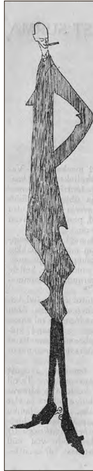
Eduard Viiralt. Eesti I kunsti ülevaate näituse kataloog. Juuli 1919 ◀◀