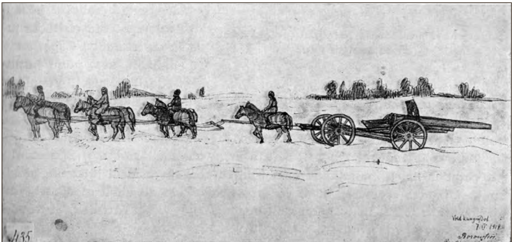
Voldemar Kangro-Pool. Joonistus. 2. suurtükiväe 7. patarei (Kuperjanovi partisanide patarei) rännakul. 7. IV 1919. EVS 1, 1937, lk. 407