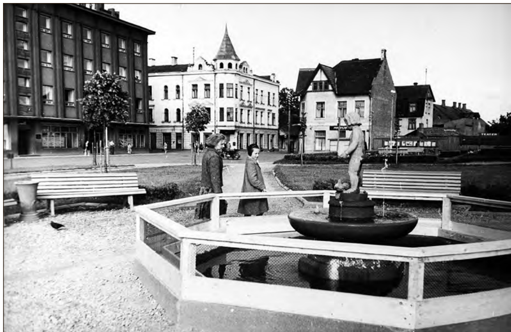
Viljandi kesklinn 1957. aastal. EFA.204.0.11345