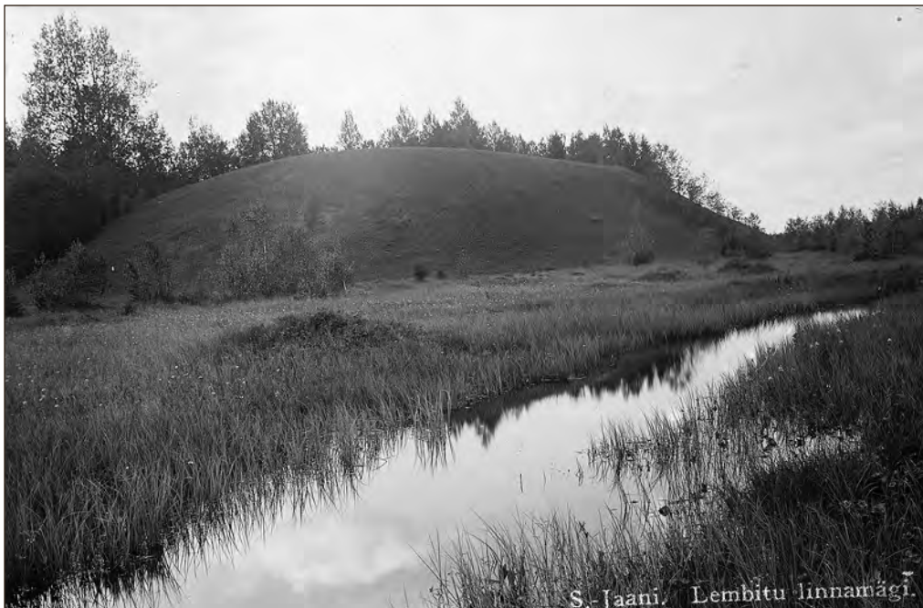
Lõhavere linnamägi, endine Lembitu Lehola linnus 1930. aastatel.