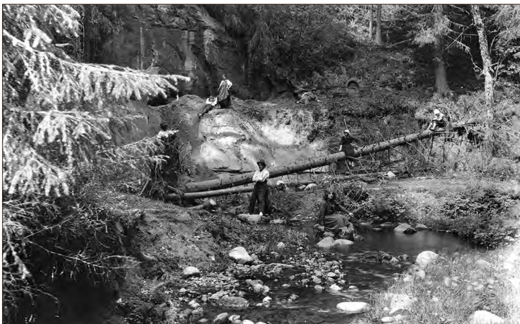
Paistu Põrguorg Siniälliku lähedal. 1925. EFA.554.0.186341