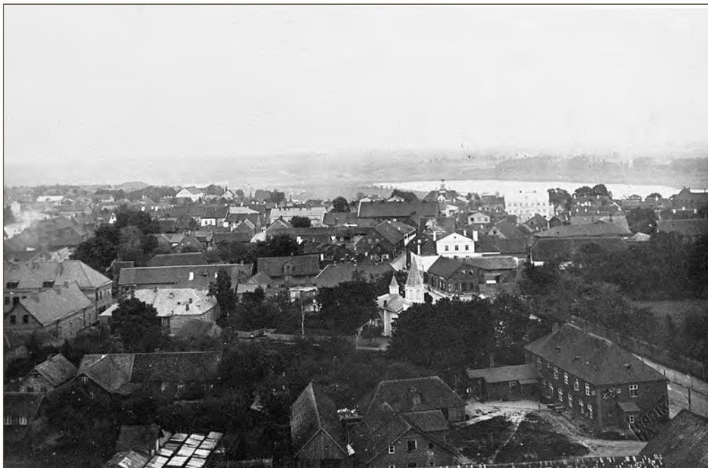
Vaade Viljandi linnale 1920. aastatel. EFA..98.A.19.31