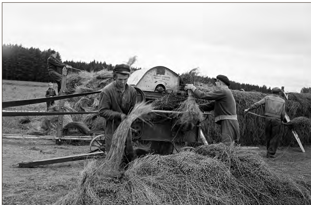
Linakupardamine Abja rajooni Sädeme kolhoosis 1958. aasta augustis.