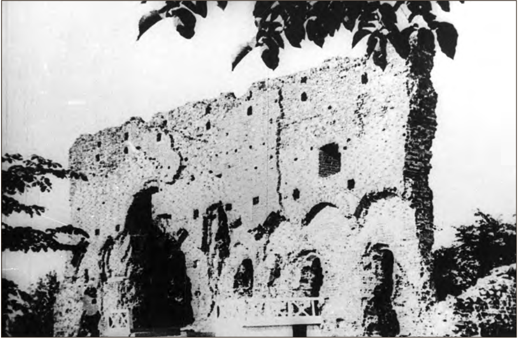
Viljandi lossi varemed. 1940.