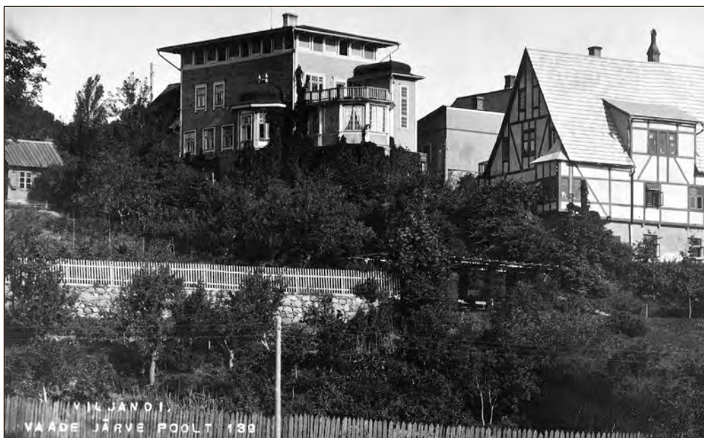
Vaade Viljandile järve poolt. 1940.