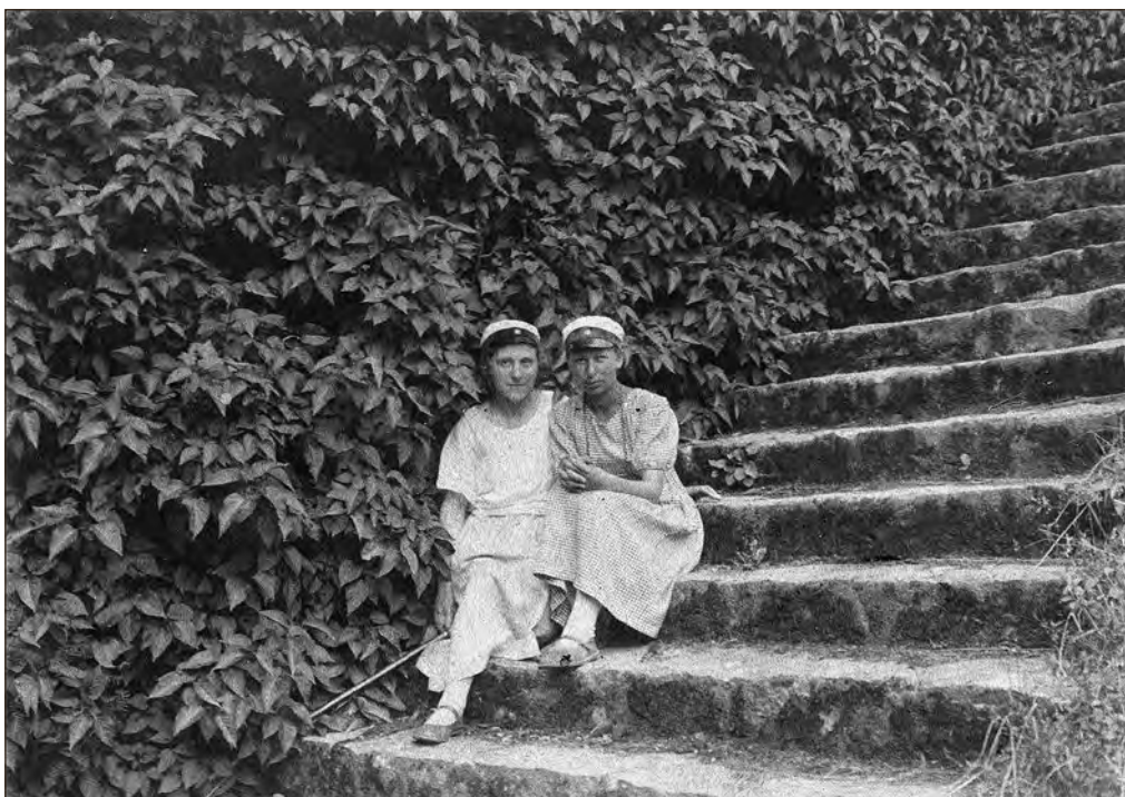
Trepp Öisu mõisa pargis 1935. aastal.