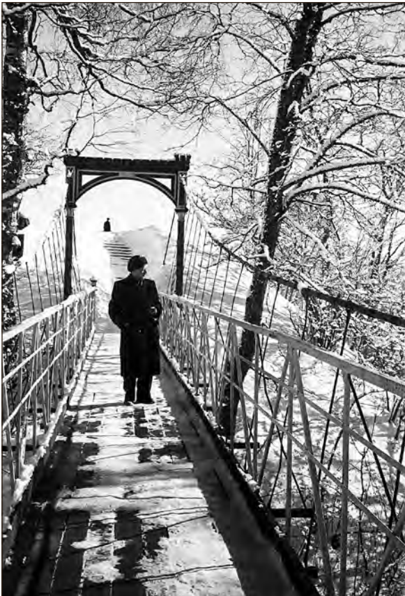
Rippsild Viljandi Lossimägedes. 1956.