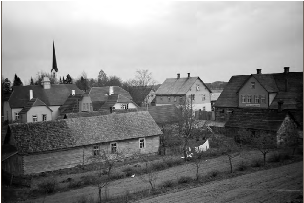
Vaade Kolga-Jaani alevikule pritsimaja tornist. 1940.