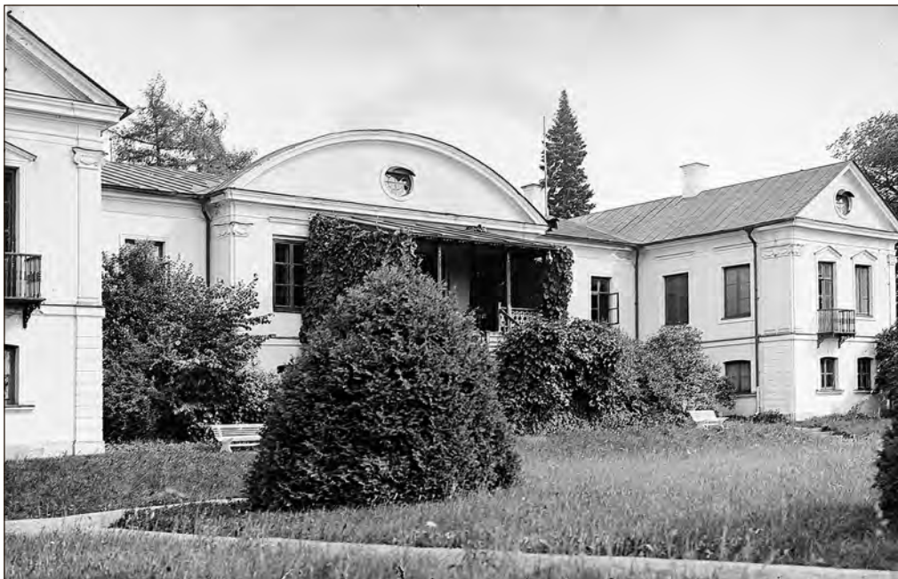
Vaade Öisu mõisale, kus alates 1922. aastast asus piimanduskool.