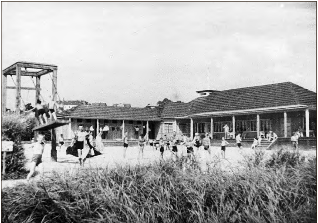
Suvitajad Viljandi järve ääres. 1940.