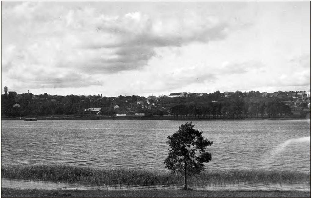
Vaade Viljandi järvele 1930. aastatel. EFA.98.A.104.28