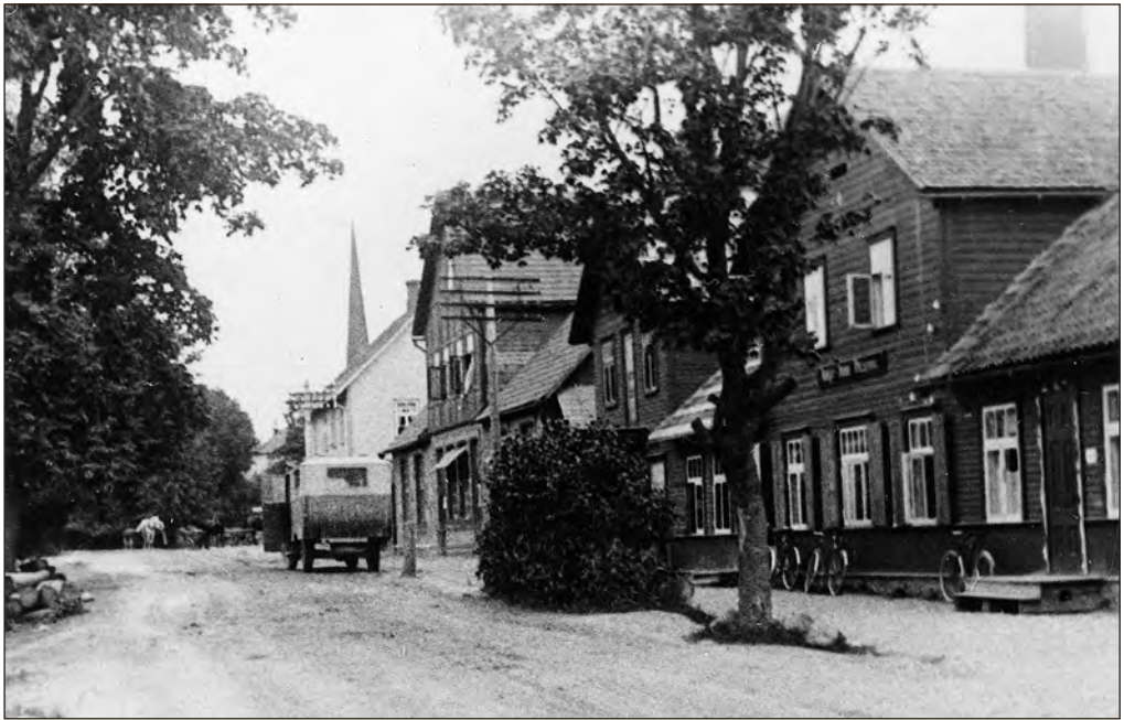
Kolga-Jaani alevik. 1.07.1931.