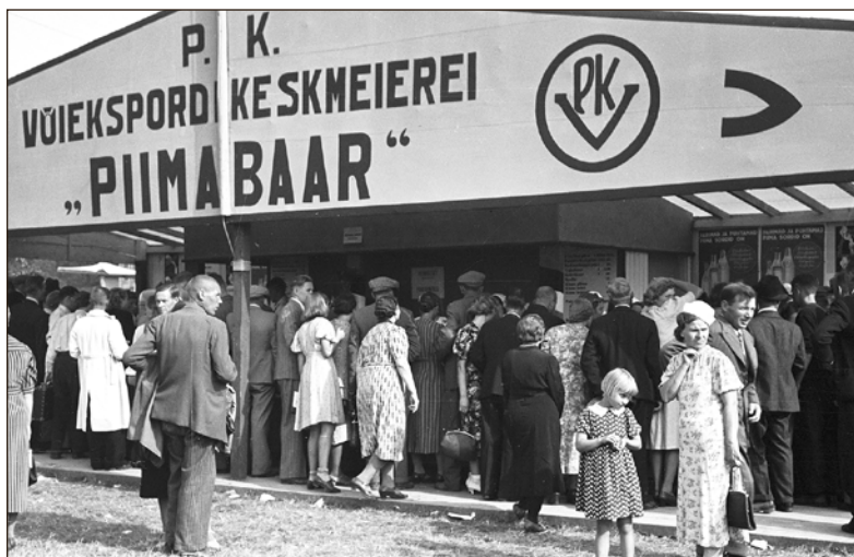
P. K. Vöiekspordi Keskmeierei Piimabaar Tallinna Eesti Põllumeeste Seltsi näituseväljakul 26. augustil 1939. aastal. EFA.446.0.193542