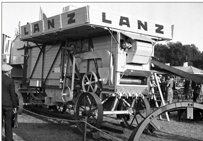
Firma Lanz rehepekumasin Tallinna Eesti Põllumeeste Seltsi näituseväljakul 27. augustil 1939. aastal.