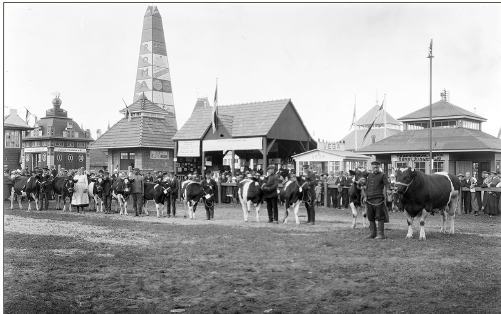
Eesti põllumajandusnäitusel Tallinnas I auhinna pälvinud friisi tõugu lehmad ja pullid 1922. aastal.