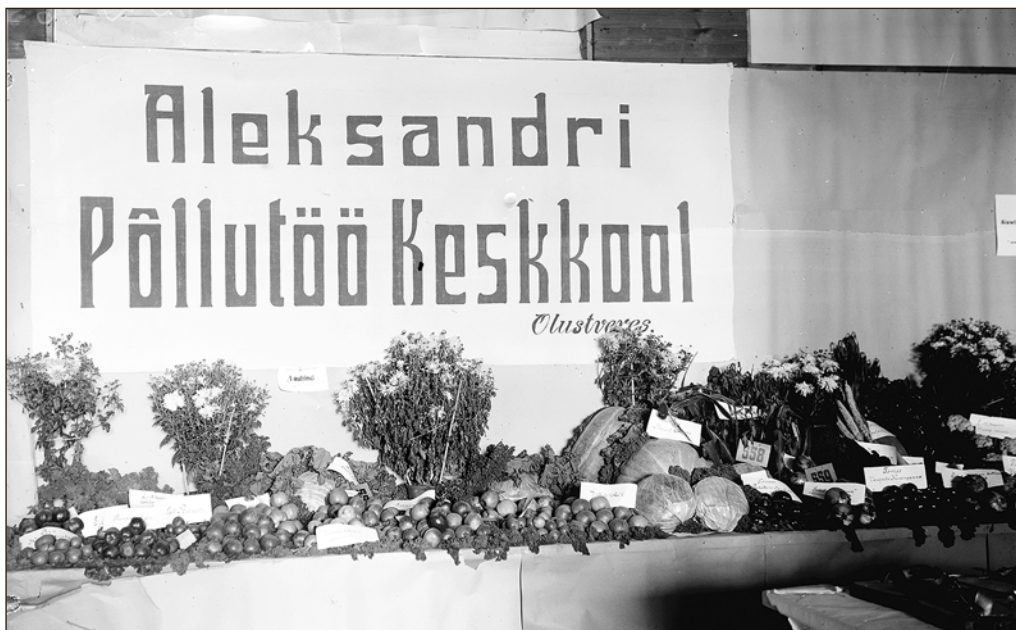
Olustveres asunud Aleksandri Põllutöö Keskkooli väljapanekud Viljandi Eesti Põllumeeste Seltsi näitusel 1925. aastal Viljandis.