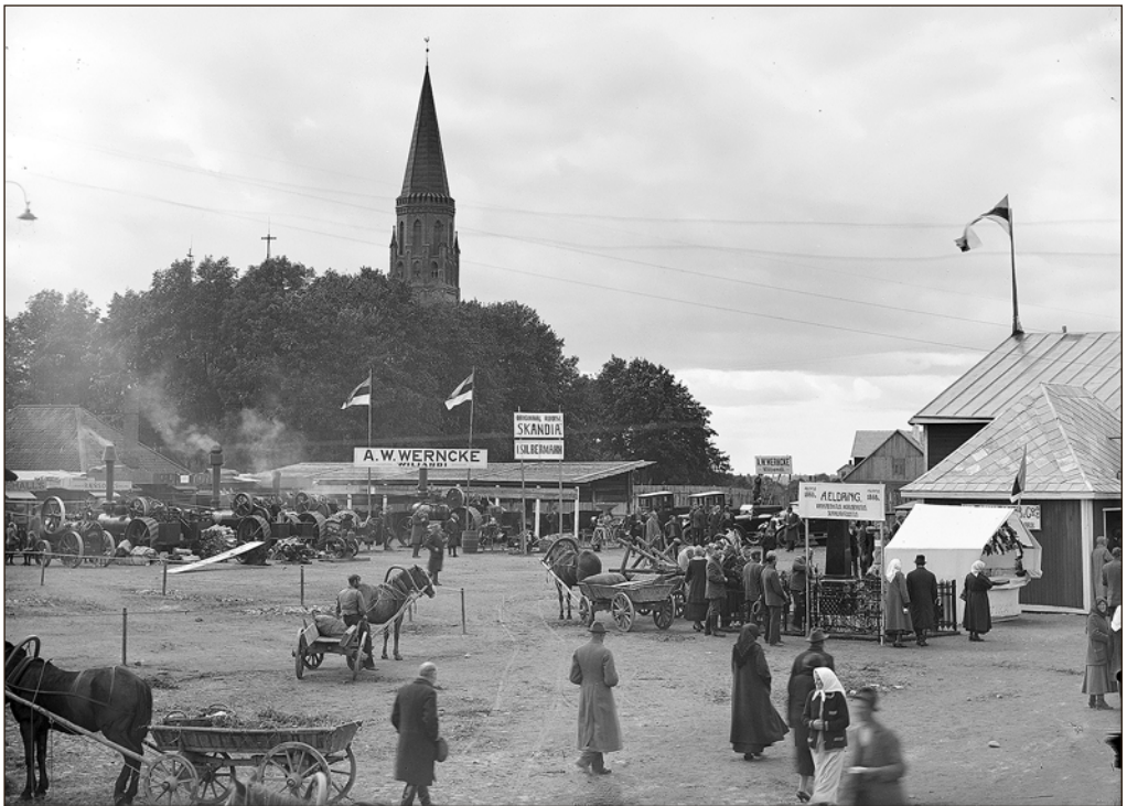
Viljandi Eesti Põllumeeste Seltsi näitus Tallinna tänaval Viljandis 1925. aastal.