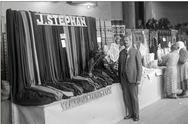
J. Stephani värvimistööstuse väljapanekud põllumajandusnäitusel Paides 1938. aastal.