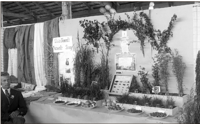
Viisu Koordi maanoorte ringi väljapanekud põllumajandusnäitusel Paides 1938. aastal.