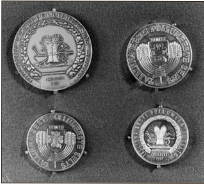
Tallinna Eesti Põllumeeste Seltsi aurahad. EFA.10.41154