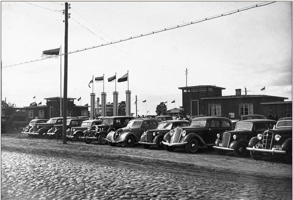
Tartu Eesti Põllumeeste Seltsi näitus 2. septembril 1939. aastal.