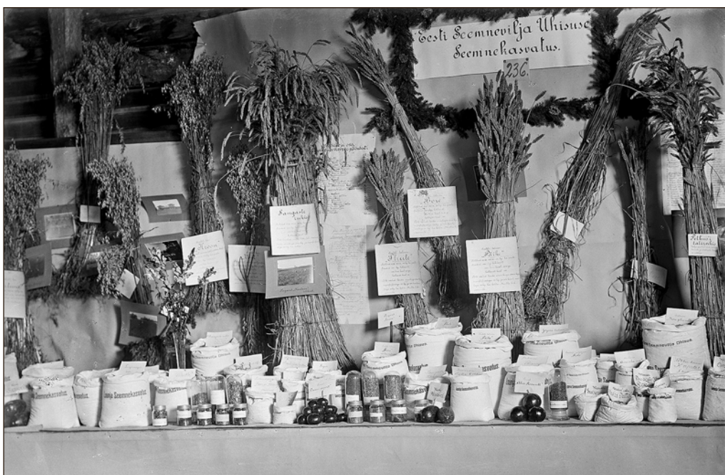
Eesti Seemnevilja Ühisuse Seemnekasvatuse väljapanek Viljandi Eesti Põllumeeste Seltsi näitusel Viljandis 1921. aastal.