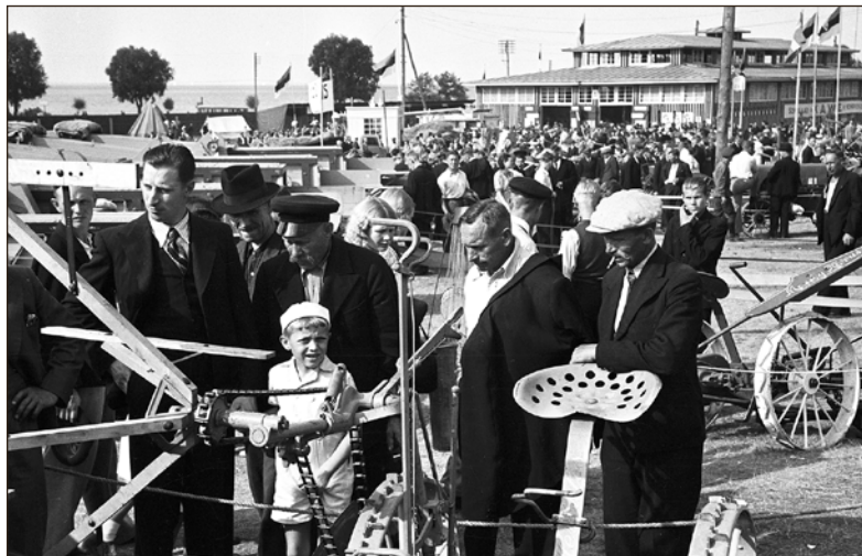
Näitusekülastajad põllutöomasinaid uudistamas Tallinna Eesti Põllumeeste Seltsi näituseväljakul Tallinnas 26. augustil 1939. aastal.