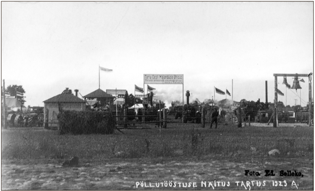
Põllumajandus- ja tööstusnäitus Tartus 1923. aastal.