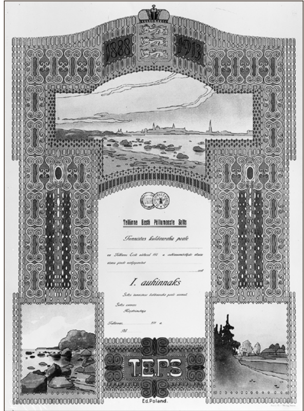
Tallinna Eesti Põllumeeste Seltsi tunnistuse blankett kuldaurahale.