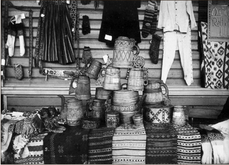
Eesti Rahva Muuseumi õlekappade väljapanek Tallinna Põllumeeste Seltsi näitusel 1911. aastal Tallinnas.