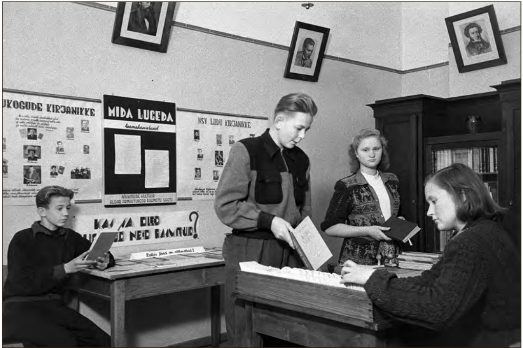
Külastajad Viljandi rajooni Õisu raamatukogus. Seinal Juhan Liivi ja Aleksander Puškini portreed. Tuleb märkida, et enamasti on näha Stalini ja Lenini portreed. 1951.