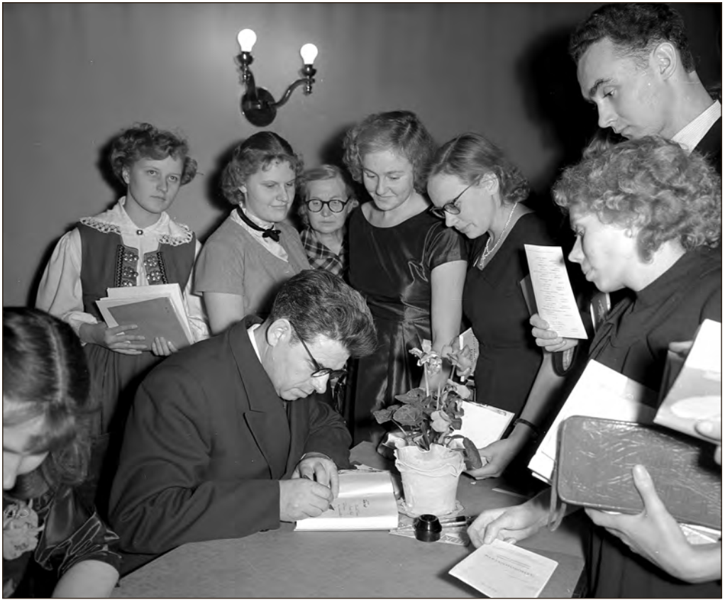
Kirjanik Aadu Hint jagab autogramme kirjanike kohtumisõhtul teatris Estonia 1959. aastal.