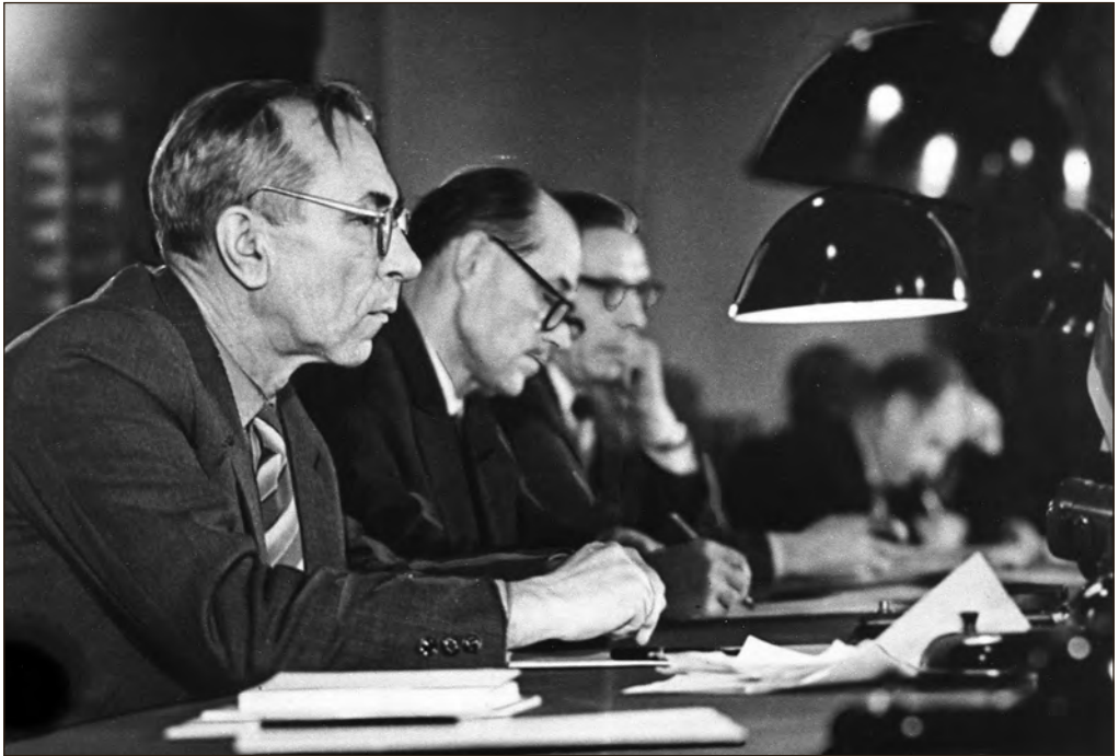
Eesti NSV Kirjanike Liidu IV kongress. Presiidiumis (vasakult) kirjanikud Mart Raud, Rudolf Sirge ja Juhan Smuul. 1958.