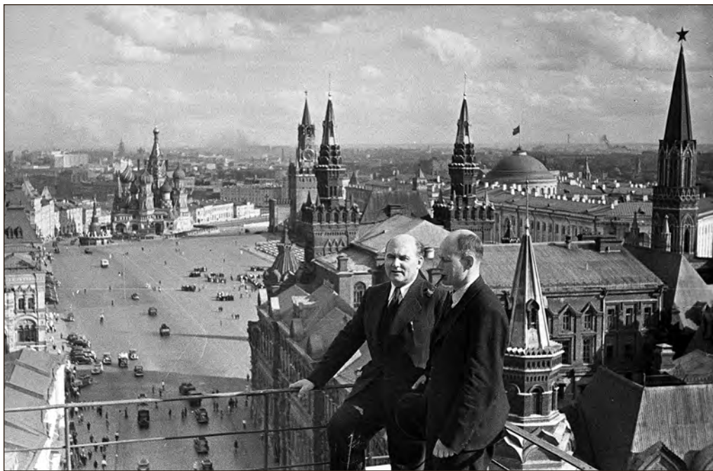
Eesti NSV rahvalitsuse peaminister Johannes Vares-Barbarus ja Eesti NSV välisminister Nigol Andresen hotelli Moskva katusel.