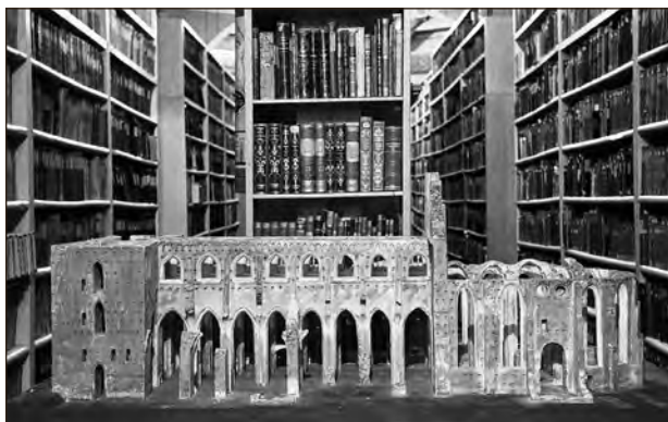
Tartu Ülikooli raamatukogu sisevaade 1952. aastal.

Fotonurga pealkiri on laenatud loosungilt Kabala raamatukogu seinal. Käesolev aasta on kuulutatud raamatukogude aastaks ja palju on pööratud tähelepanu just väiksemate, kohalike kogukondade raamatukogudele, sest neil on enamasti olnud alati rohkem ülesandeid kui vaid raamatute laenutamine. Võrreldes möödunuga on raamatukogude funktsioonid tänapäeval veelgi enam avardunud. Tavapärastele kirjandusõhtutele ja kohtumistele kirjanikega on lisandunud online -teenused, digitarkuste jagamine ja miks ka mitte õmblustoa avamine, nagu hiljuti kuulda oli.