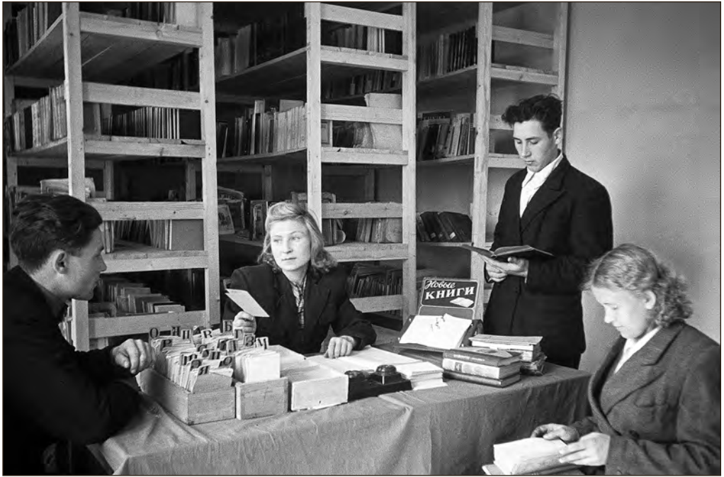
Kukuruse kaevanduse raamatukogu 1951. aastal. EFA.204.0.4045