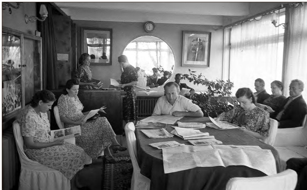
Puhkajad Pärnu sanatooriumi nr. 1 raamatukogus 1952. aastal.