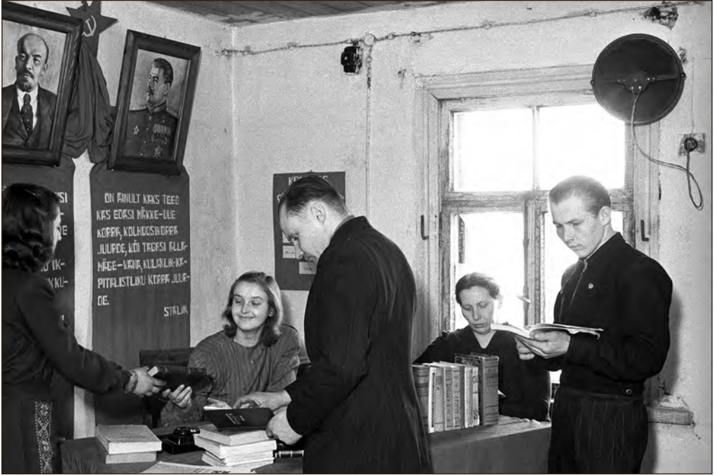
Valgemaal asuva Oktoobri Võidu kolhoosi 400 köitega raamatukogus 1949. aastal.