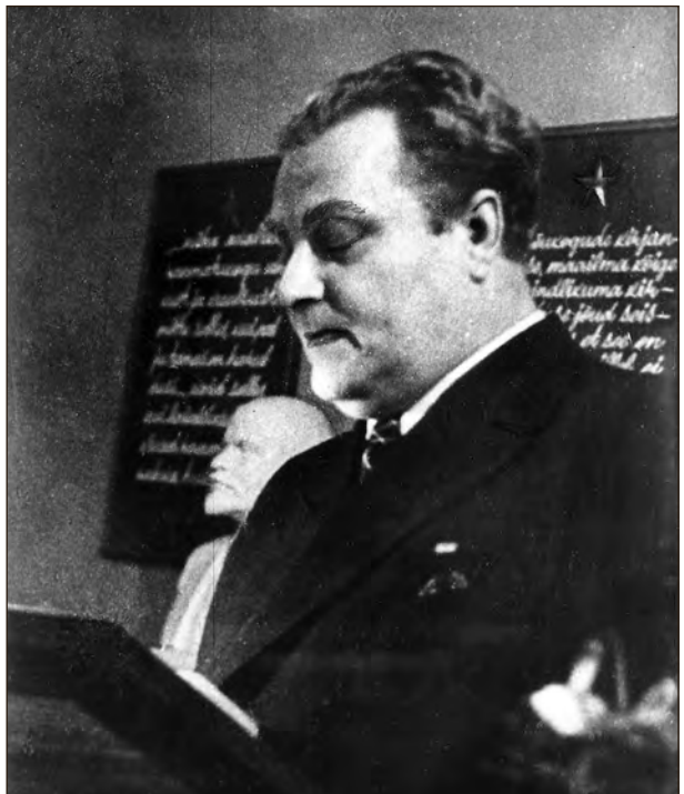
Eesti NSV rahvakirjanik August Jakobson Tallinna Keskraamatukogus lugejatega kohtumas. 1948.