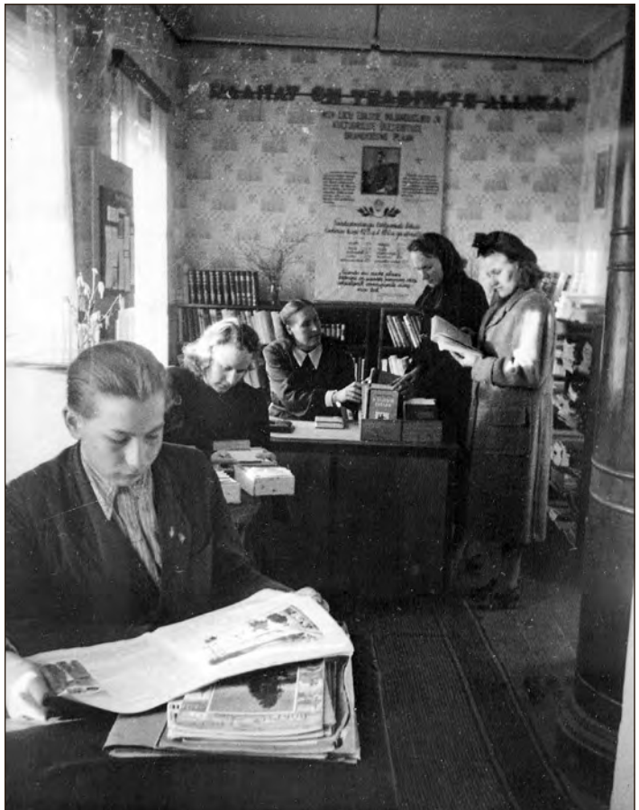
Orissaare rajooni raamatukogu 1953. aastal. Orissaares asus raamatukogu aastatel 1952–1959 kultuurimajaga ühe katuse all. 1946. aastal oli kogus 432 trükist, 1959. aastal juba 18 140.