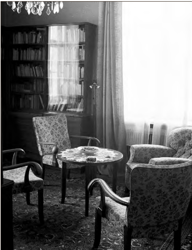
Eesti NSV Ülemnõukogu Presiidiumi esimehe ametikorter Kadrioru lossis. Raamatukogu asus ülemisel korrusel. 1947.