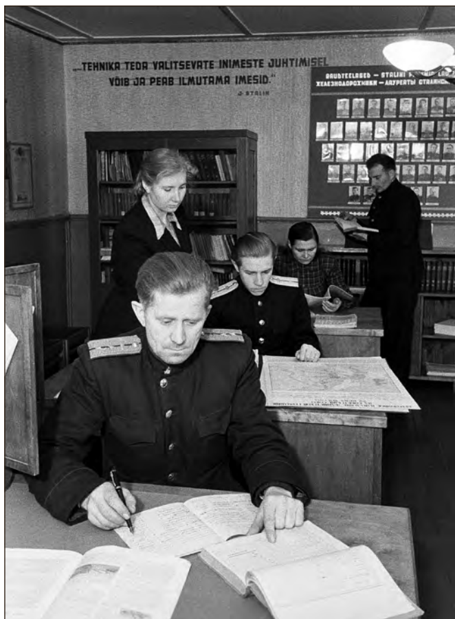
Tartu Raudteelaste Klubi raamatukogu lugemissaal 1953. aastal.