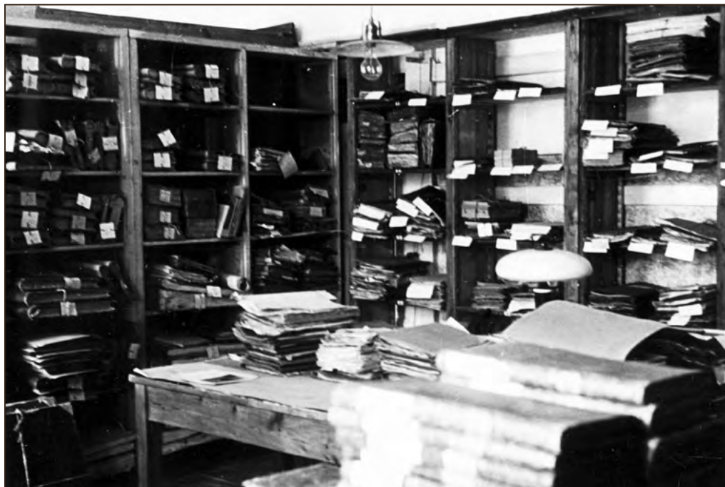
ENSV Riikliku Ajaloo Keskarhiivi tööruum aastail 1946–1950. Tartu.