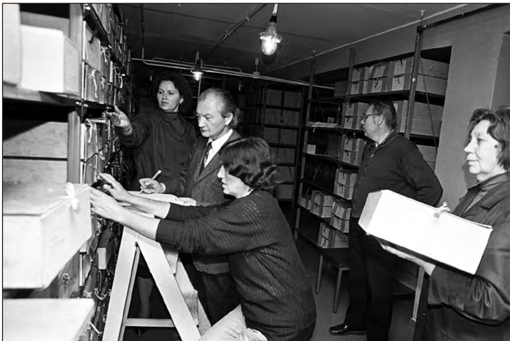
Eestimaa Kommunistliku Partei arhiivi üleandmine Riigiarhiivile. Olemik kontroll. 20.09.1991.