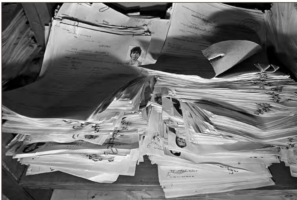
Arhiividokumendid Eestimaa Kommunistliku Partei arhiivist. 28.10.1991.