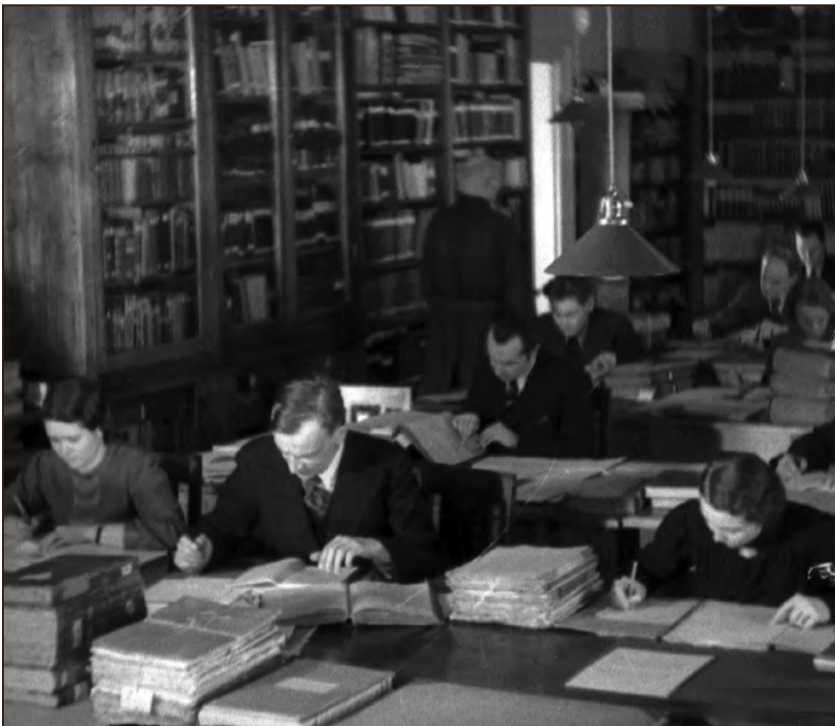
Riigi Keskarhiivi uurimissaal. Kaader Eesti Kultuurfilmi ringvaatest. EKF, nr. 13, 1938. EFA.4.0.192338