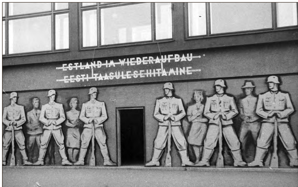
Näituse „Eesti taasülesehitamine” kujundus Tallinna Kunstihoone fassaadil. 1942.