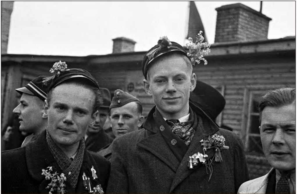
Eesti Leegionärid enne õpelaagrisse sõitu Balti jaamas Tallinnas. 1944.