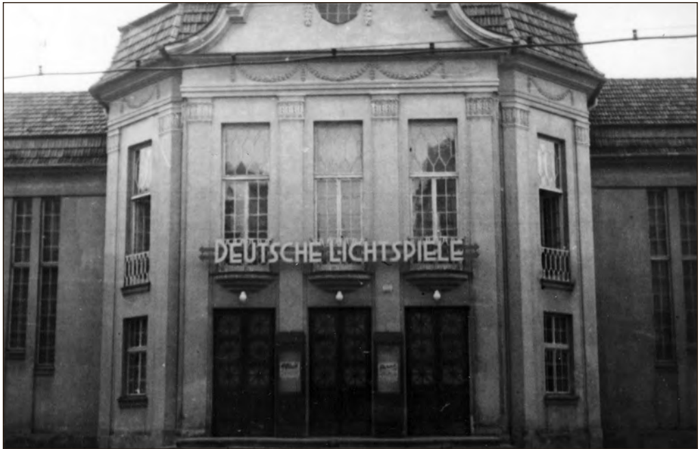
Kino „Deutsche Lichtspiele“ (saksa teatri ehk praegu tuntud kui väikese „Vanemuise“ ruumides) Tartus. Tartus oli sel ajal kolm kino, kuid samas olid need ka väga olulised propaganda- ja lõbustusasutused, nii et Eesti Rahva Ühisabi jagas emadele kinopileteid. 14.08.1942.