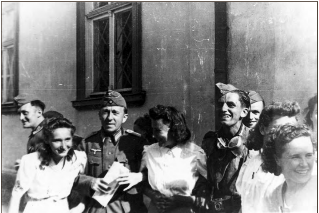
Saksa sõdurid Pärnu elanikega vestlemas. 1942.