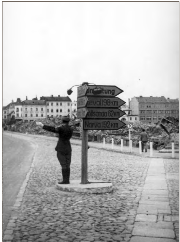
Liikluspolitseinik Võidu ja Uueturu tänava nurgal Tartus 14.08.1942.