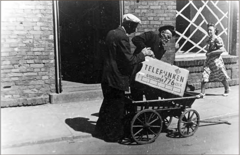
Nõukogude võim rekvideeris sõja puhkedes raadioaparaadid, Saksa ajal anti need tagasi ning osa inimesi peitis oma aparaadid ära. Pärnu, sügis 1941.