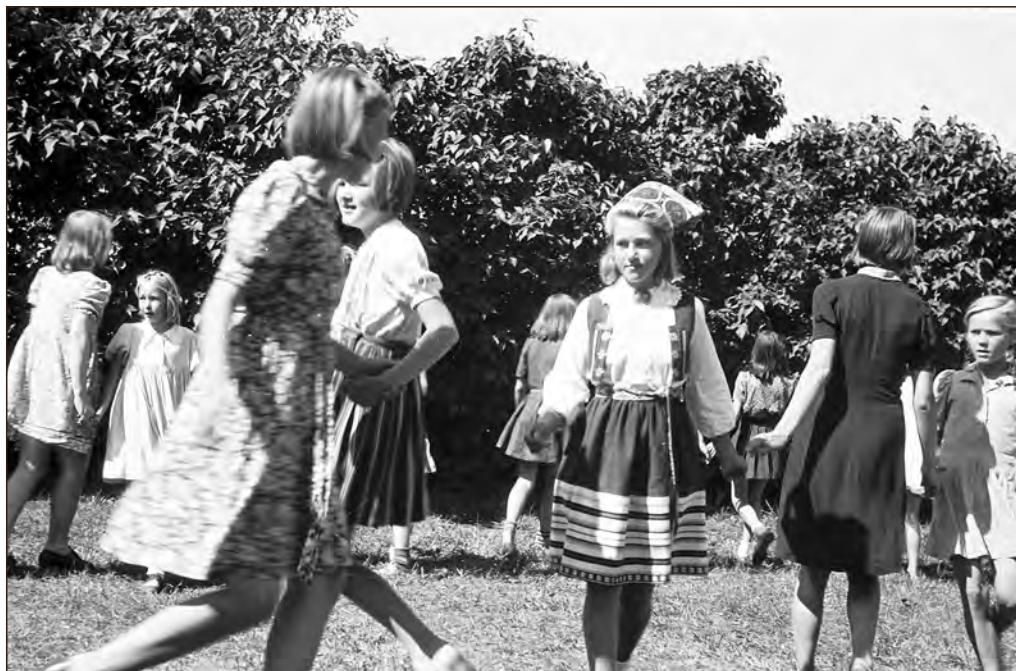
Endises Eesti Punase Risti sanatooriumis Eesti Rahva Ühisabi poolt avatud laste suvekodu lapsed väljas tantsimas. August 1942. Haapsalu.