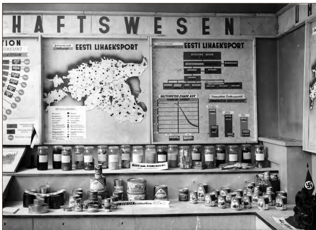
Näitusel „Eesti taasülesehitamine” välja pandud eksponaadid Tallinna Kunstihoones. Sellest näitusest on fotosid veelgi, kuid enamikus kajastavad need põllumajandust ja toiduainetetööstust, seega või, peekon ja munad olid plaanitud põhilisteks „taasülesehituse” materjalideks. 1942.