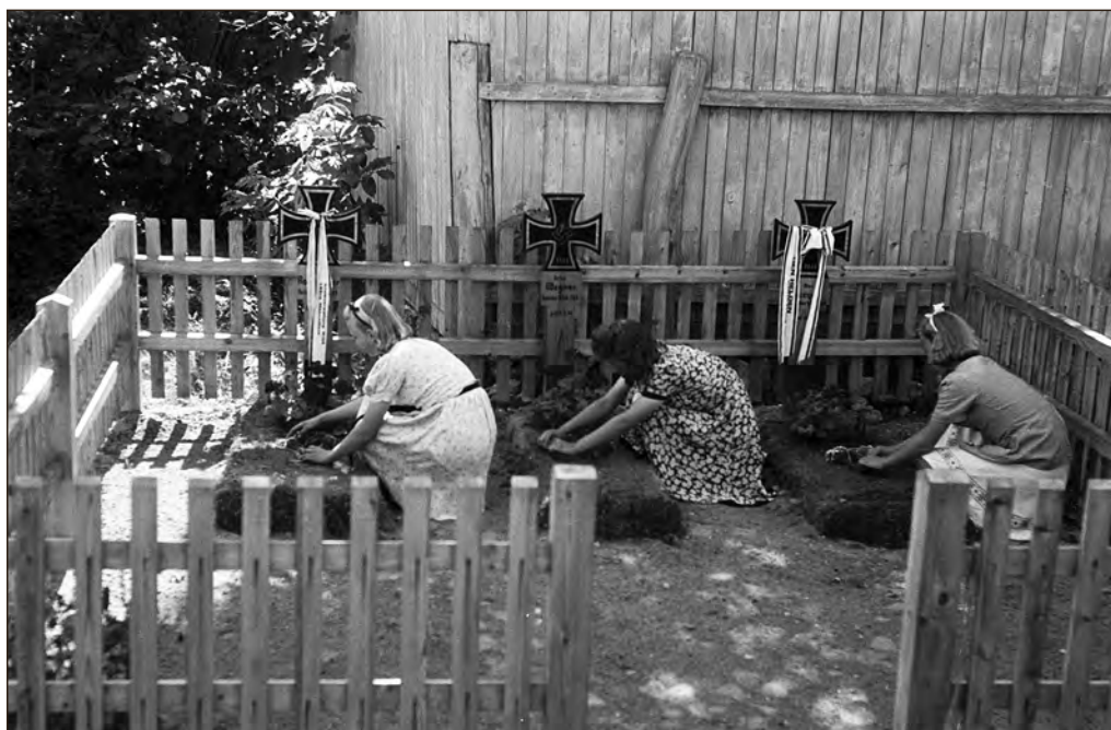
Endises Eesti Punase Risti sanatooriumis asuva Eesti Rahva Ühisabi suvekodu lapsed hoolitsevad sanatooriumi hoovis asuvate Saksa sõdurite haudade eest. August 1942. Haapsalu.