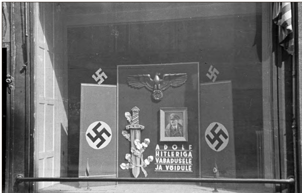
Adolf Hitleri sünnipäevaks dekoreeritud vaateaken Tallinnas. Aprill 1944.