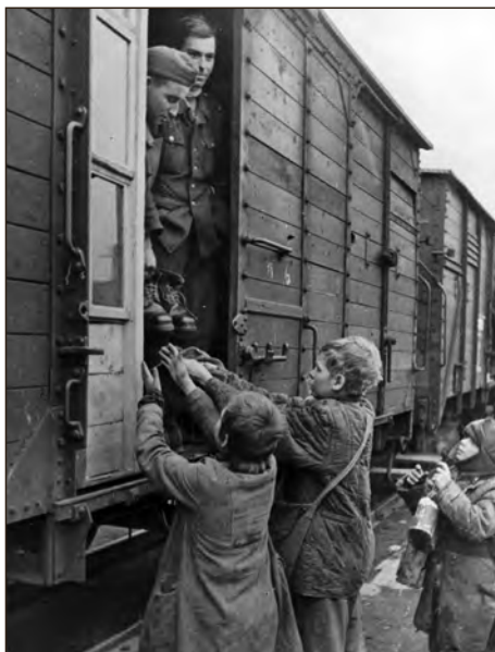
Foto tagaküljel on tekst: „Hetk idas asuvast raudteestaamast”. Kaks kätepaari sirutuvad sõdurite poole, et saada paar läikivaid ilusaid saapaid, mida üks saksa sõdur vagunist ulatab.