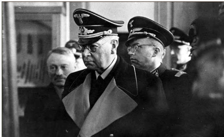
Saksa riigiminister dr. Dorpmüller külaskäigul Eesti Rahva Muuseumis Raadil.