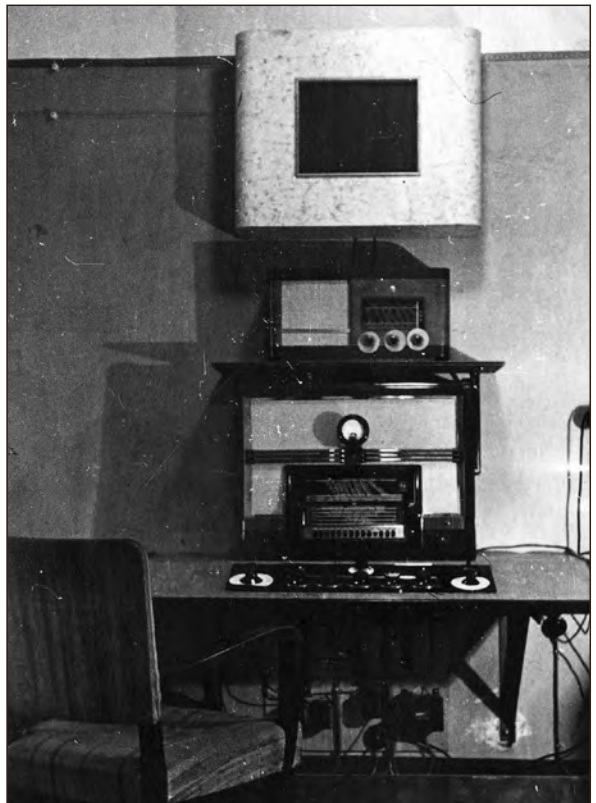
Tallinna Ringhäälingu Saksa ringhäälingu saadete vastuvõtja „Estonia” teatris Tallinnas 1942.–1943. aastal.