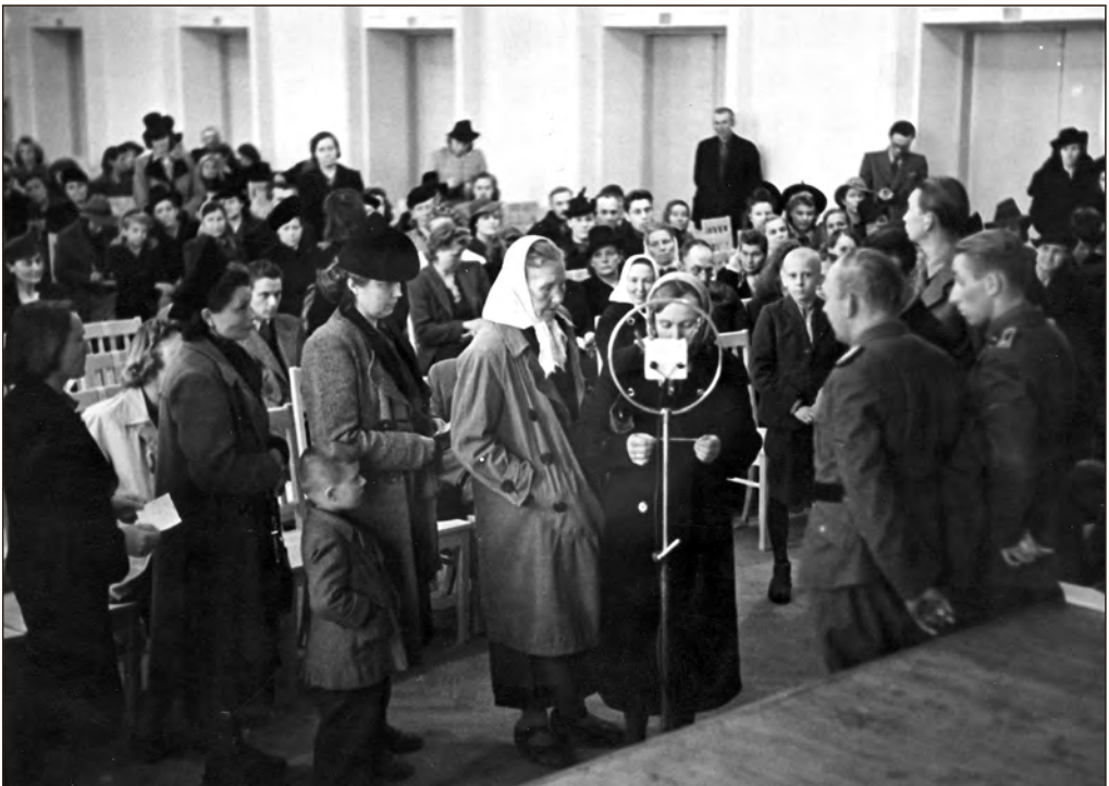
Tartu elanike esinemine ringhäälingus endises teaduste akadeemia saalis. Tasub tähele panna, et esinejatel on käes paberid, mis tähendab, et tekst on nii-öelda ette antud. 1942.