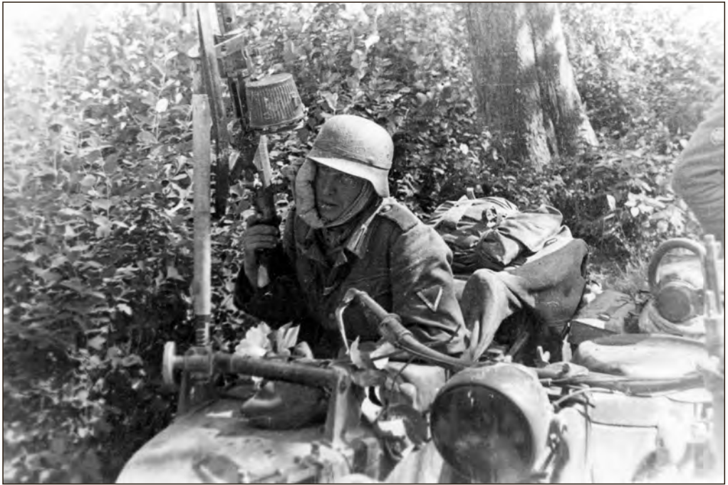
Saksa sõdur mootorrattal Pärnus. 1941.