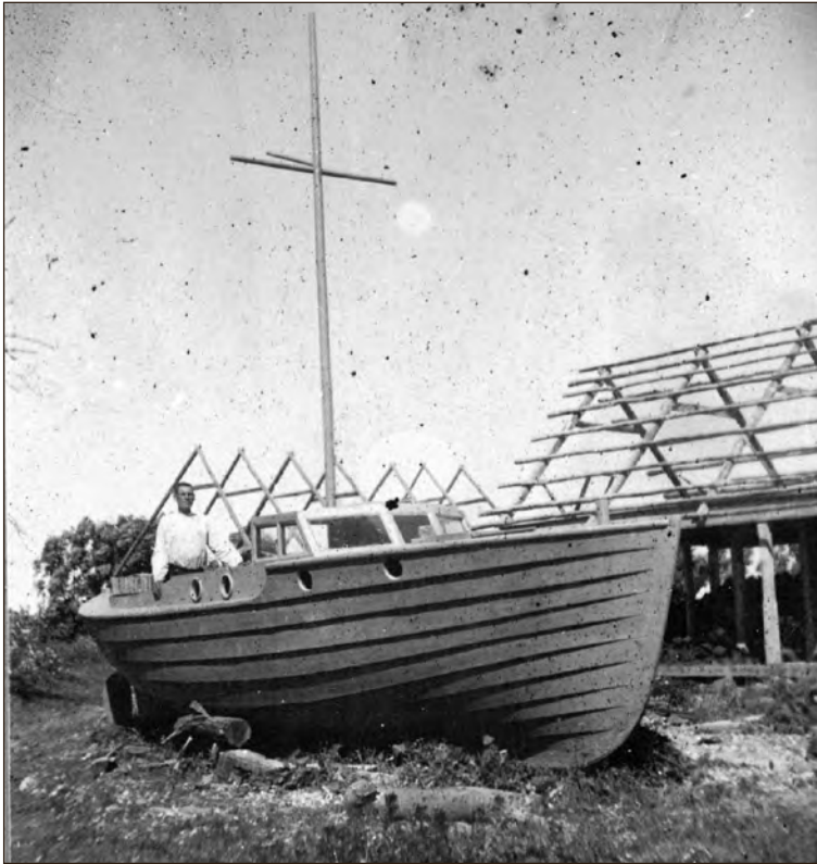
Muhumaa paadimeister töö juures 1939. aastal. EFA 0-141685