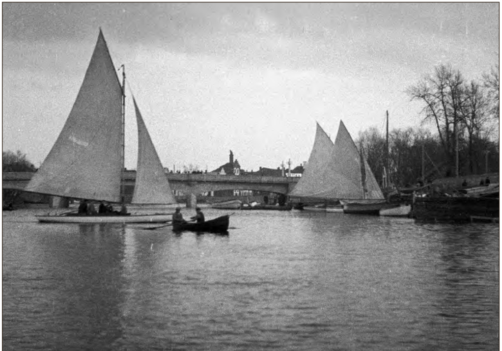
Purjekad ja paadid Emajõel 1930. aastatel. Foto: Hans Roland Vörk. EFA 0-178339