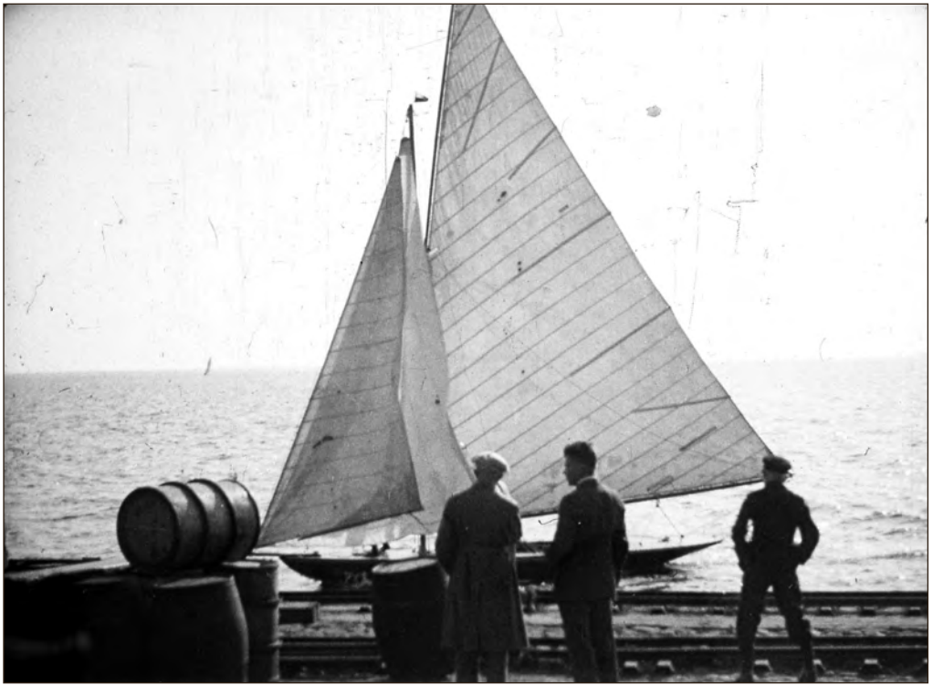
Purjekas sadamakai ääres Saaremaal 1930. aastal. Foto: Hans Roland Vörk. EFA d-3553