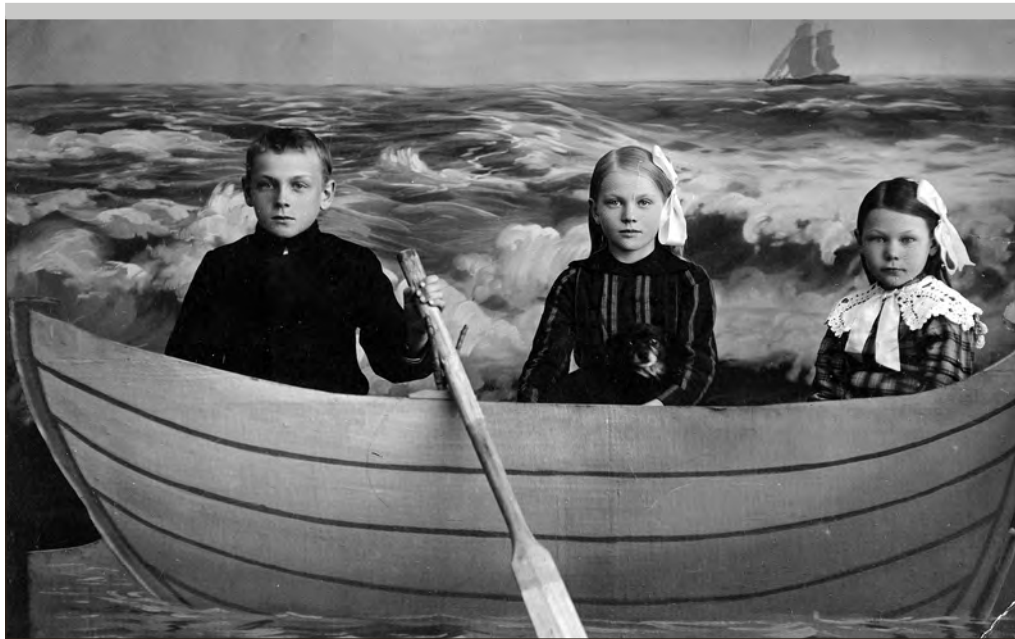
Ateljeefoto mereteemalise taustaga 1910–1920-ndatel aastatel. EFA 0-405361

O leme mereäärne riik ja meri on olnud meile elatusallikas ja transporditee. Merekultuuriaastaga seondult on selles Tuna numbris juttu laevaehitusest, mille kohta leidub üht-teist ka meie fotokogus. Ei suutnud loobuda ka sellisest romantilisest kooslusest nagu meri ja purjekad.