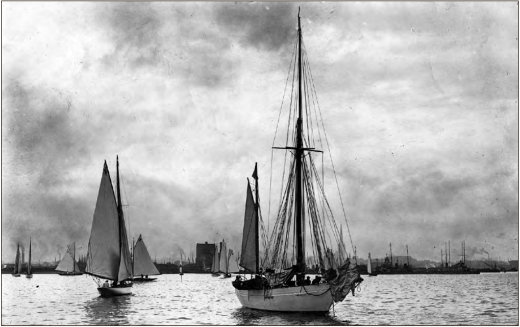
Purjekad Tallinna lähel. Foto: Peeter Parikas. EFA A-546-50