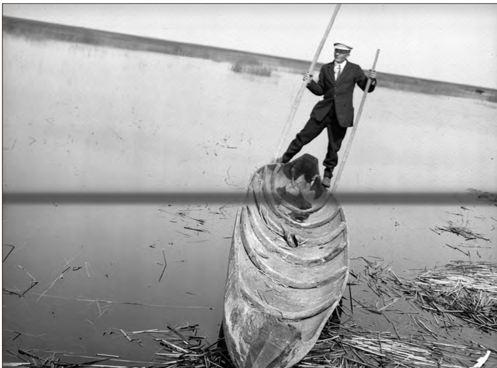
Ühepuulootsik Matsalu lahe ääres 1927. a. EFA 2-2481