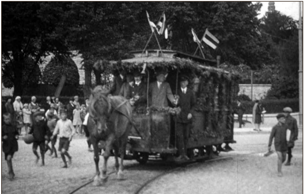
Hoburaudtee ehk konka asutamise 40. aastapäeva tähistamine Vabaduse platsil Tallinnas 1928. aastal. EFA.570.P.d-3398