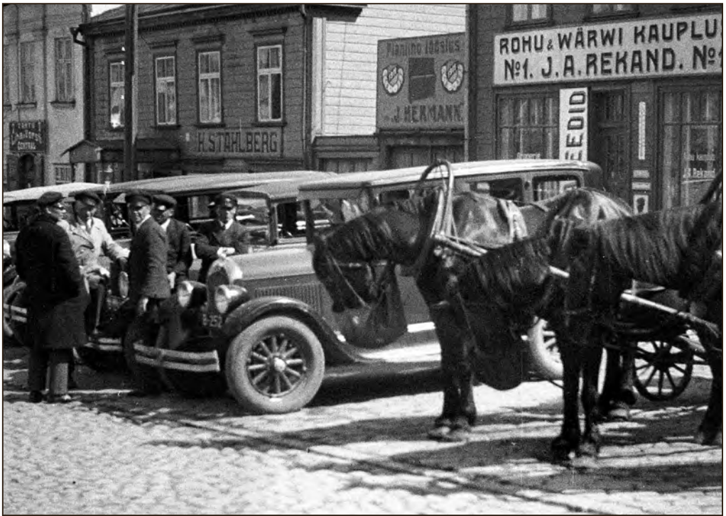
Hoburakendid ja autod Tartu südalinnas 1930-ndatel. EFA.570.P.0-178368