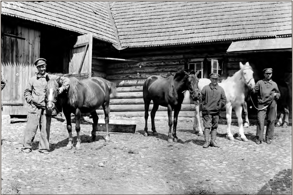
Telegraafi 1. kaablijao hobused Petseri kloostri tallis. EFA.10.P.3-6012