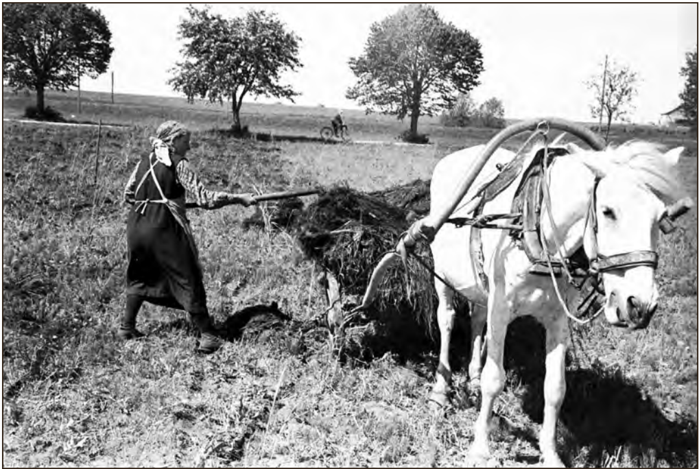
Heinaaeg Viljandimaal 1939. aastal. Foto: Oskar Viikholm. EFA.446.P.0-193506