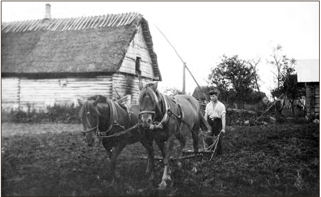
Kahe hobusega kündmine Meltsi talus Rahu külas Kogula vallas Saaremaal 1931. aastal. EFA.554.P.0-185737