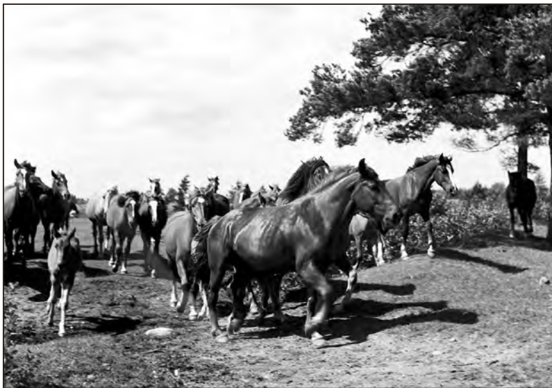
Tori hobusekasvatusduse tõuhobused karjamaal. Juuni 1953. EFA.240.P.0-54436