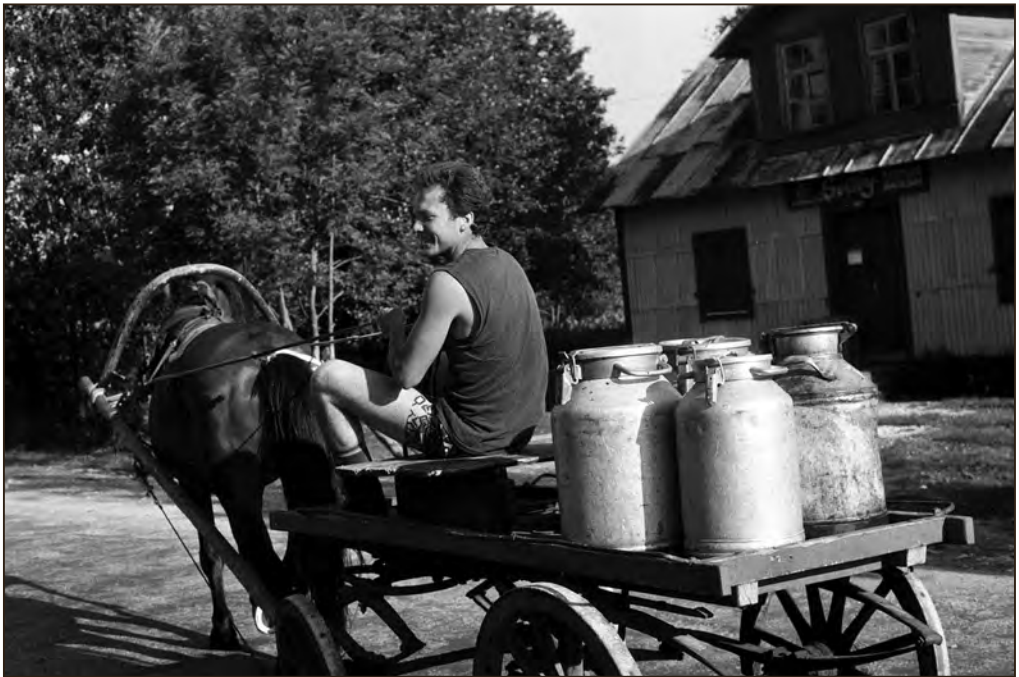
Piimaring Vormsi saarel. 18.07.1991.