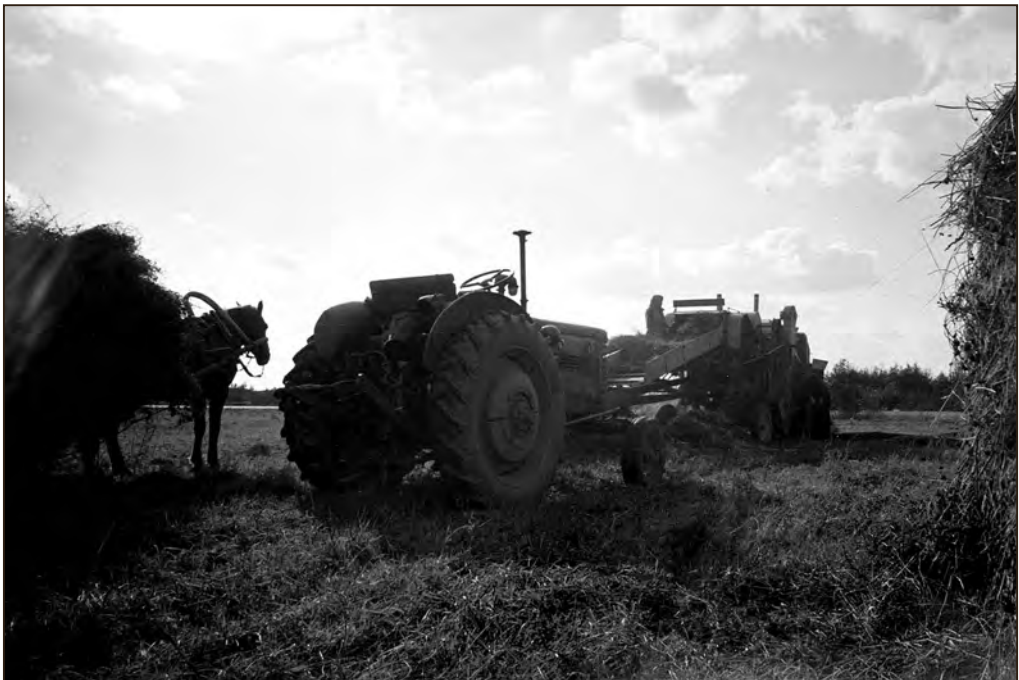
„Kaks põlvkonda“ – hobune ja traktor. September 1961.