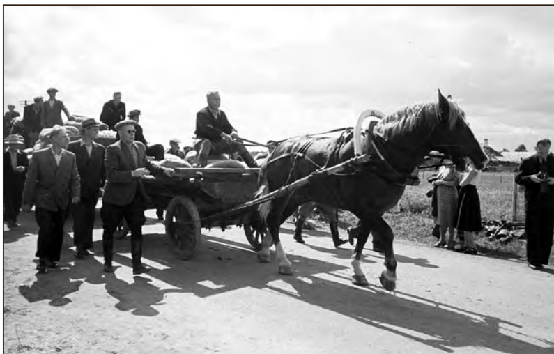
Tori Hobusekasvatuse 100. aastapäeva tähistamisel korraldati veovõistlused, mille võitis täkk Hormon (tema esivanemate seas on täkk Hetman, keda peetakse tori hobuste esiisaks). Juuli 1956. Hormonil on tütusõnna tunnus aastast 1955 ning tema järeltulijatena on tõuraamatusse kantud 91 „poega“ ja 102 „tütart“. Foto: Vitali Gorbunov. EFA.204.P.0-10183