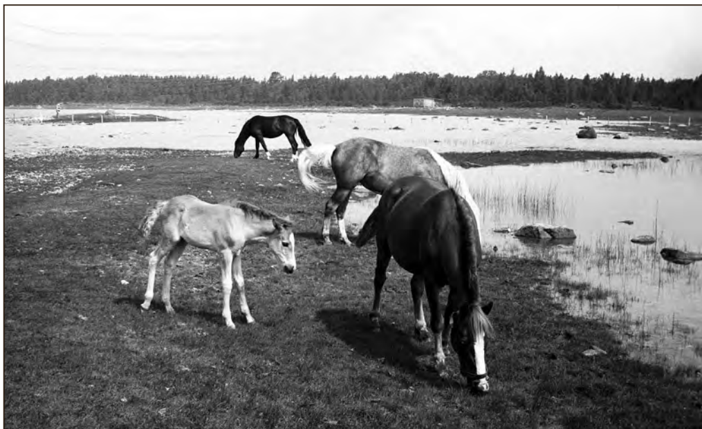
Hobused Topu rannas. August 1986. EFA.204.P.0-145670