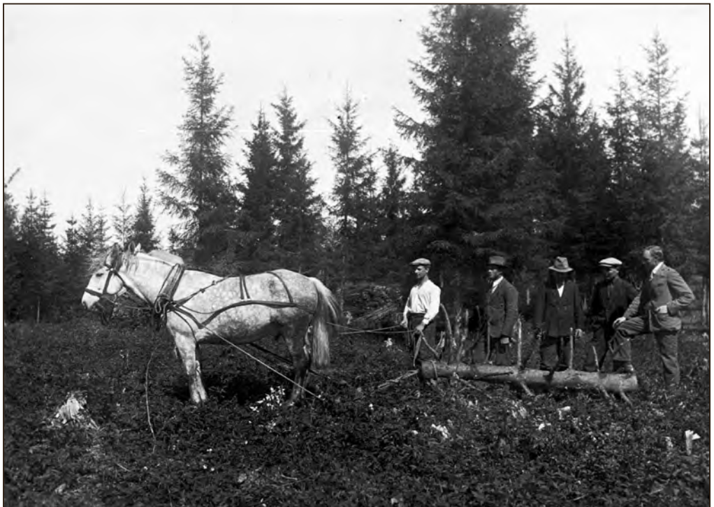
Heinamaa äestamine karuäkkega Tartumaal 1920.–1930-ndatel. Foto: V. Sepper. EFA.134.P.A-83-55