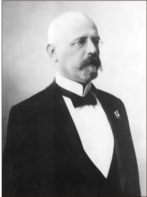
Jaan Poska.

Üks sajandi sajast Eesti suurkujust 1 on legendaarne, 1920. aastal Nõukogude Venemaaga Tartu rahu sõlminud Eesti poliitik Jaan Poska (1866–1920). Tema lahkudes ütles oma järelehüüdes Eesti esimene valitsusjuht, 1921. aastal riigivanemaks valitud Konstantin Päts: „Meie rahvas on kaotanud vaimse jõu, kelle asetäitjaid praegu ei leidu.“ 2