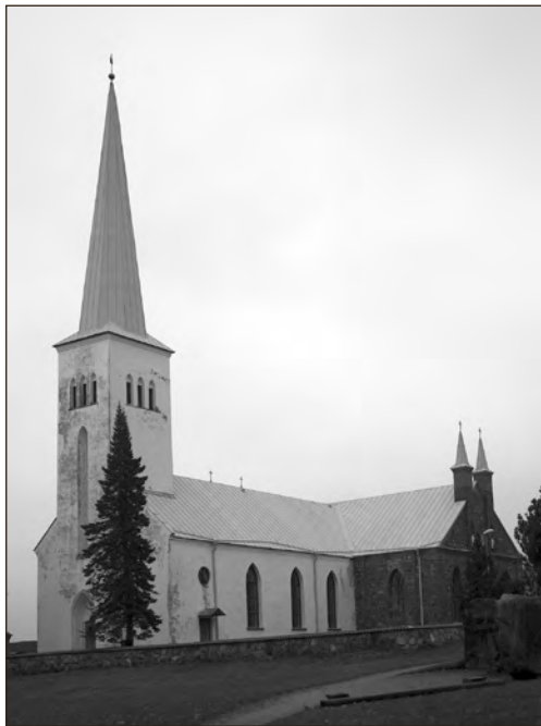
Kambja kirik, taastatuna tänapäeval. Pildistatud 21.10. 2012.