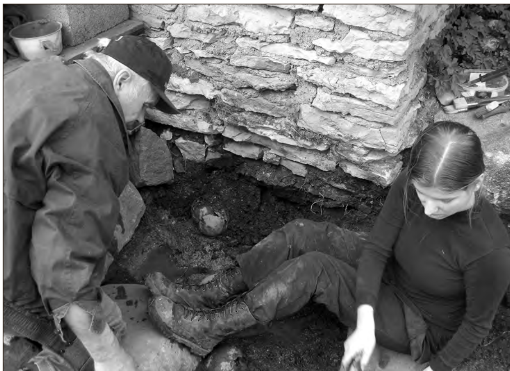
Esimesed pealuud juba paistavad.