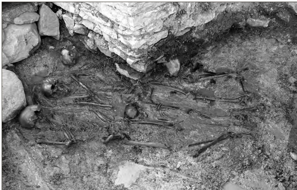
Luustikud on välja puhastatud.