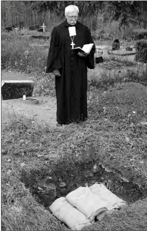
Matusetalitus haul.