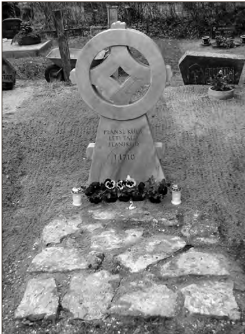
Karuse kirikaeda katku surnute hauale püstitatud ratasrist.