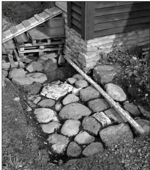
Luustikke kattis raudkivisillutis.

Vahepeal sai eemaldatud murukamar ja pealmine mullakiht piirkonnast, kuhu oletatavalt ulatusid maetute puusa- ja jalaluud. Murukamara eemaldamisel tulid päevavalgele uued ja uued suured raudkivid. Jäi ebaselgeks, kas raudkivisillutis oli laotud matuste katmiseks või mingil muul põhjusel. Kas kardeti surnute tagasipöördumist? Või oli tegu hoopis mingi matustest hilisema ehitise jäänusega. Pigem võiks siiski oletada viimast varianti, sest kivid ei olnud laotud vahetult matustele, vaid nende peal oli veel kümnekond sentimeetrit väiksemad kive, klibu ja mulda. Mingeid sillutist dateerivaid leide ei saadud. Mitmesugustel