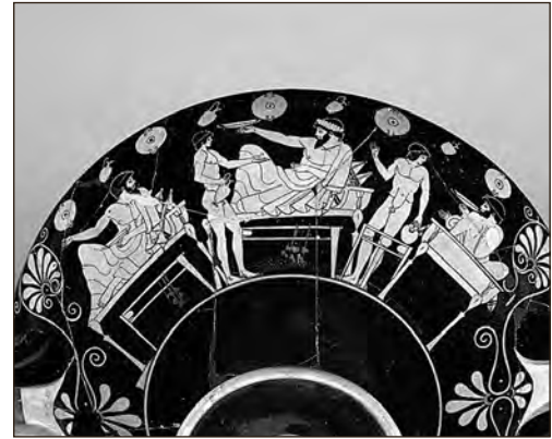
Sümposionistseen 5. sajandi esimesest poolest. Sümposioonil külitamine, mis juurdus Kreekas 7. sajandil, on idast üle võetud komme.