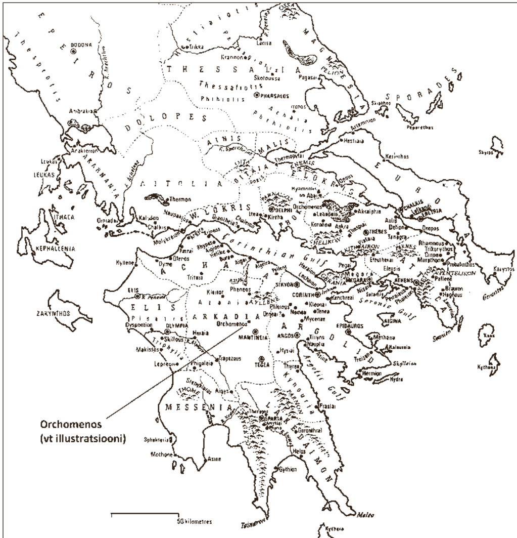
Balkani-Kreeka tähtsamad polised arhailisel ajal.