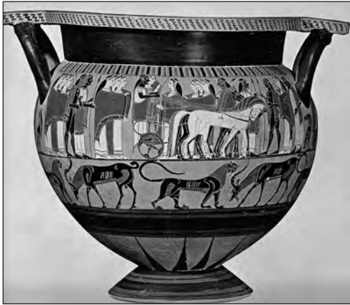
Aristokraatlik pulmastseen 6. sajandi algusest. Loomakujutised pulmastseeni all reedavad tugevat idamaade mõju.

tiale kuulusid keskmisest suuremad maavaldused, kuigi ei maatükkide suurus ega maaomandi kontsentreerumise mehhanismid ole kindlalt teada. On ka üsna kindel, et ülemkiht püüdis kaaskodanike arvel enda rikkust kasvatada ning vaesemaid ja viletsamaid oma võimu alla saada. Ateena puhul kuuleme, et paljud lihtkogukondlased langesid võlaorjusse, millega kaasnes oht saada võla katteks võõrsile müüdnud, 25 ja võib arvata, et sellesarnane saatus ähvardas teistegi poliste vaesemaid elanikke. 26 Ent põhjustel, millest põgusalt allpool, säilitasid kodanikustaatuses väikeomanikud enamasti sõltumatuse. Pole andmeid kogukonnasisestest sõltuvussi-