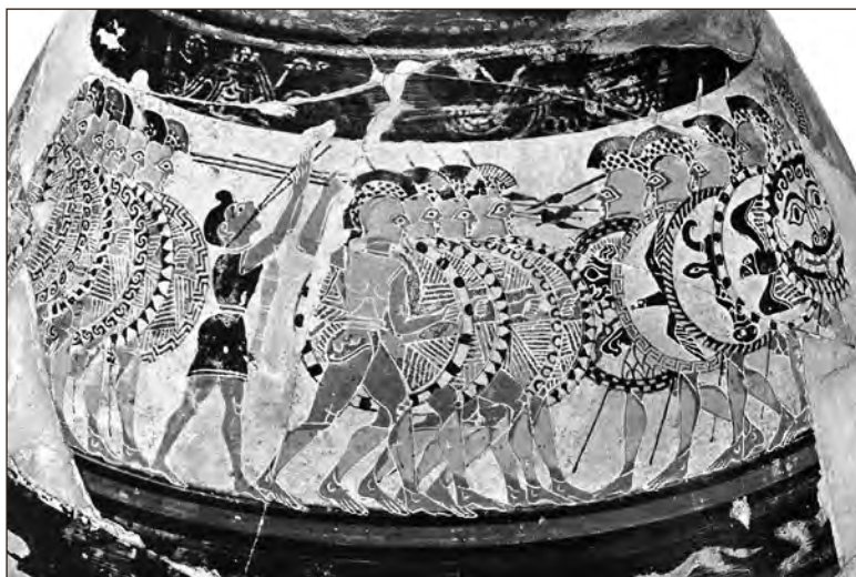
Varaseim hopliidifaal- lanksi kujutis nn. Chigi vaasilt 7. sajandi keskpaigast. Vaas on stiili järgi otsustades maalitud Korintose meistri poolt, kuid on leitud ühest etruski ülilukhuuast Itaalias.