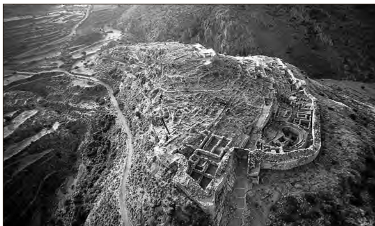
Aerofoto Mückeene kindlust. Esiplaanil on Lövivärv. Valitseja trooniruum paistab heleda ruuduna kindluse kõrgemas nurgas.

gist erinevustest hoolimata viitab sarnasustele Lähis-Ida riikidega, vähemalt majanduse valdas. 15 Aastatuhande jagu hilisemast klassikalisest kõrgajast pole seevastu teada ei paleesid ega bürokraatlikult reguleeritud majandust, mis viitab suurele erinevusele nende ajajärgude ühiskonnakorralduse vahel. Seda täiendab veel tõik, et nagu minoilised kirjatahvlid (nn. lineaarkiri A) tõendavad, ei kõnelnud Kreeta toonased asukad kreeka keelt ega kuulunud seega kreeklaste hulka. 16 Kas ja kui palju klassikaline Kreeta oma kaugelt ja etniliselt erinevalt eelkäijalt mõjutusi sai, jääb meile saladuseks.