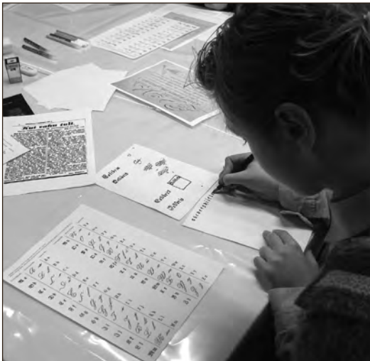
Konserveerimise ja kalligraafia töötöad.