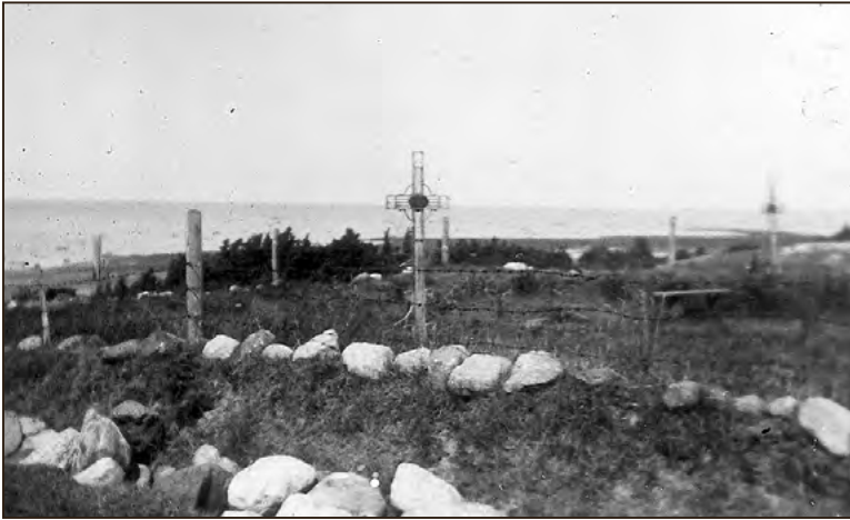
Kalmistu enne 1930-ndaid aastaid.