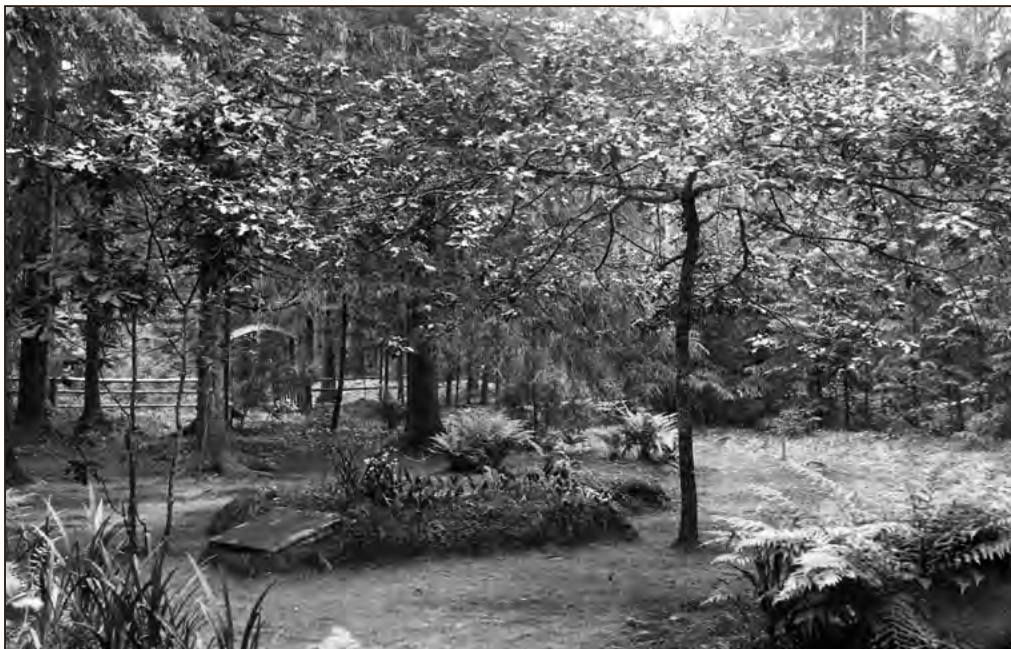
Postkaart. C. R. Jakobsoni haud, vaade edelast.

Arvata võib, et Jakobsoni soovil rajatud kalmistu metsa sees kippus ajapikku loodusega ühte sulama. Eesti Vabariigi majanduslike olude edenedes kaaluti uuesti varem lubatud kabeli rajamist, kuid ajad ja moed olid muutunud, mistõttu otsustati skulpturaalse monumendi ja seda ümbritseva kivist piirdeaia kasuks. Tagasihoidlikust matusepaigast sooviti kujundada omamoodi rahvuslik pühapaik.