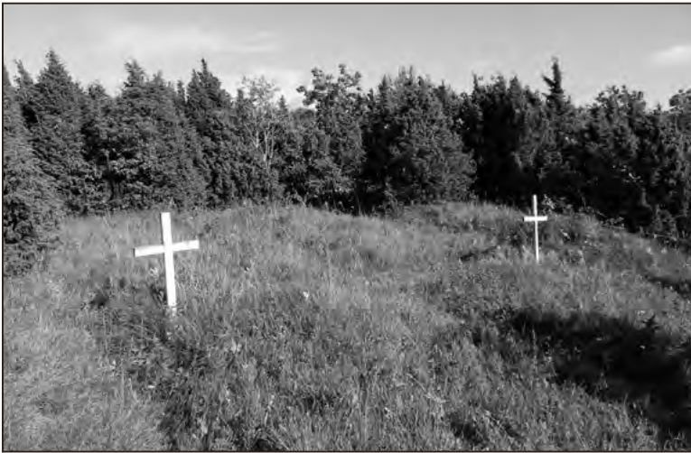
Vesikaare kalmistu 2015. aasta suvel.