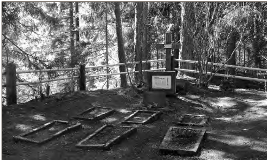
Lemuselja talu kalmistu 2015. aasta kevadel.