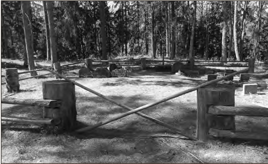
Pauna talu kalmistu 2015. aasta kevadel.