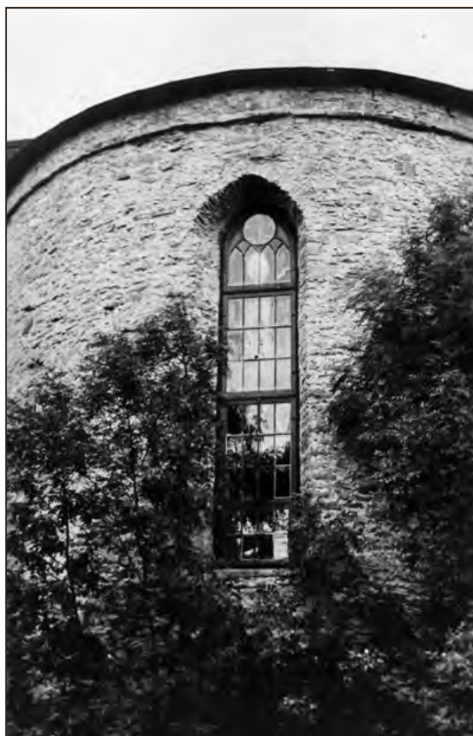
Haapsalu lossi torn, mille aknale ilmub Valge Daam. 1940. Foto autor teadmata. EFA.419.P.0-114170