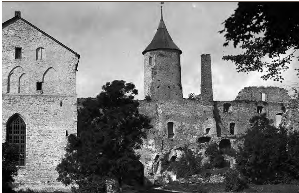
Haapsalu lossi varemed 1937. aastal. Filmikaader. Operaator Konstantin Märskä. EFA.4.P.0-48068