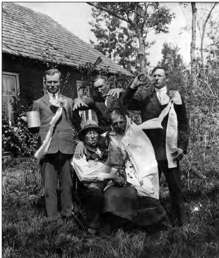
Pulmaseltskond Paljasma külas Vigala kihelkonnas 1930. aastal. Tegu on ilmselt juba teise päeva nn. vale pruutpaari ja selle kaaskonnaga. EFA.554.P.0-187283