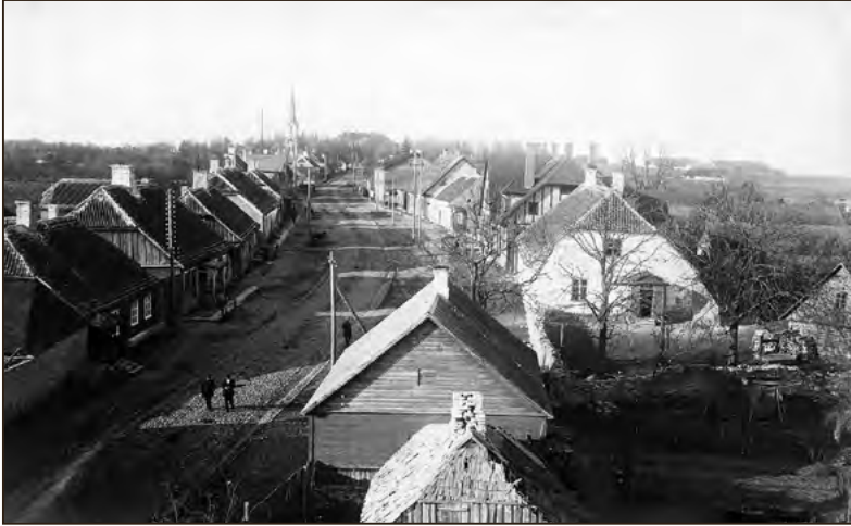
Vaade Lihula alevile pitsimaja tornist 1930. aastal. EFA.554.P.0-183067