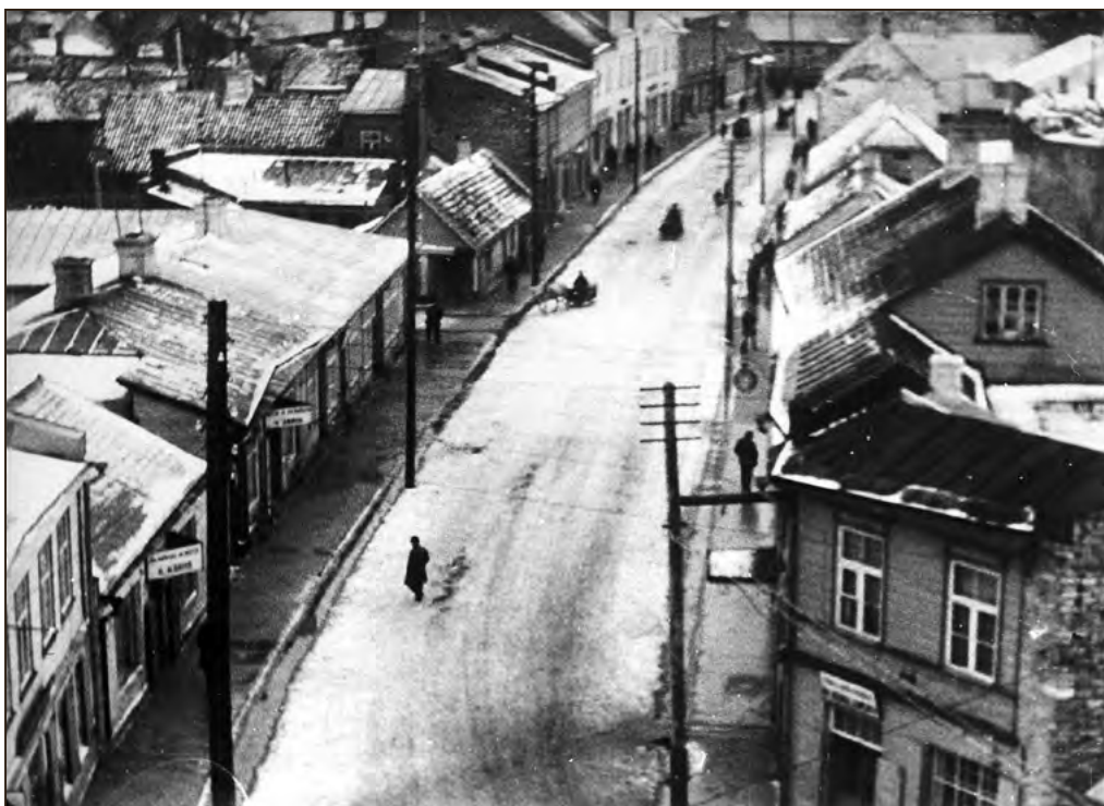
Vaade Karja tänavale tuletõrjemaja tornist 1937. aastal. Filmikaader. Operaator Konstantin Märskä. EFA.4.P.0-48069