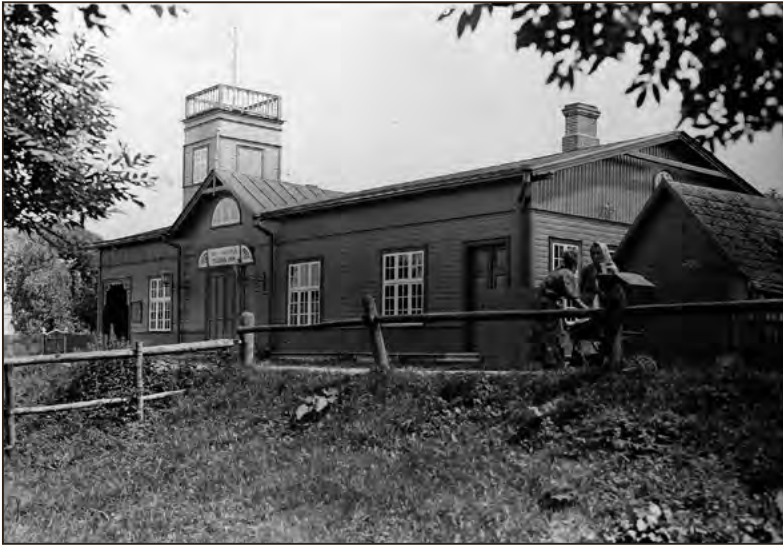
Lihula Vabatahtliku Tuletõrjeühingu hoone 1930. aastal. Foto: H. Schultz. EFA.554.P.0-183071