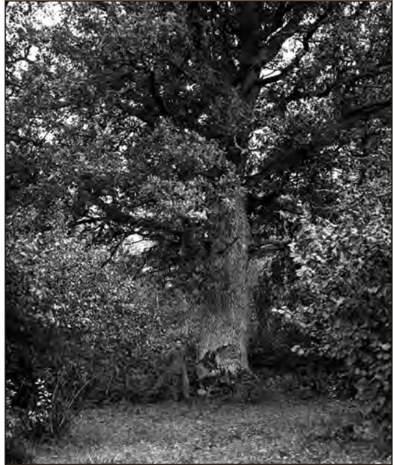
Hiietamm Valgu metskonnas Velise vallas 1926. aastal. Foto: H. Schulz EFA.554.P.2-2603

Tänapäeva Haapsalu reklaami ei vaja – spaad, erinevad kultuurisündmused, lapsesõbralik rand ja Iloni Imedemaa teevad ilmselt saja aasta pärast fotode valimise veelgi raskemaks.