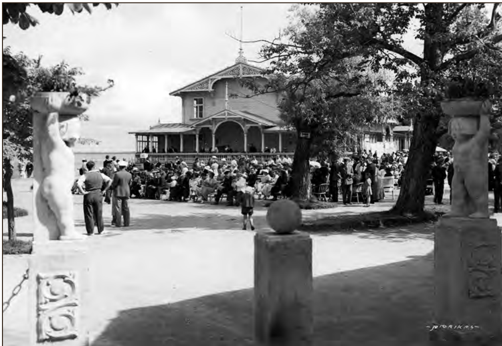
Kuursaal 1930-ndatel aastatel. EFA.3.P.0-28948