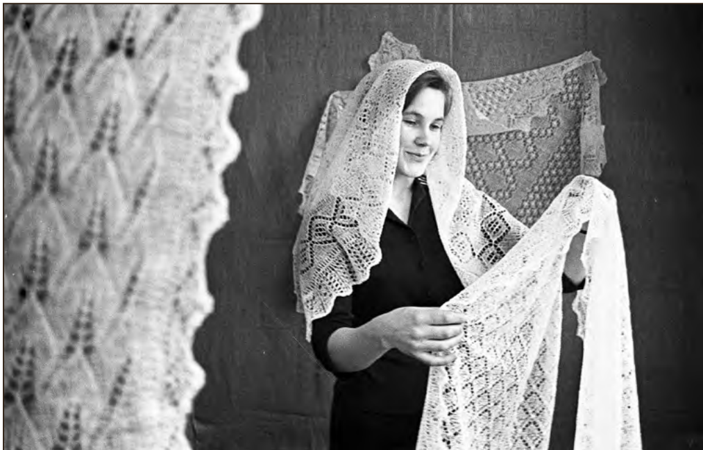
Haapsalu pitsilised sallid 1967. aastal. Foto: P. Raukas. EFA.204.P.0-81234