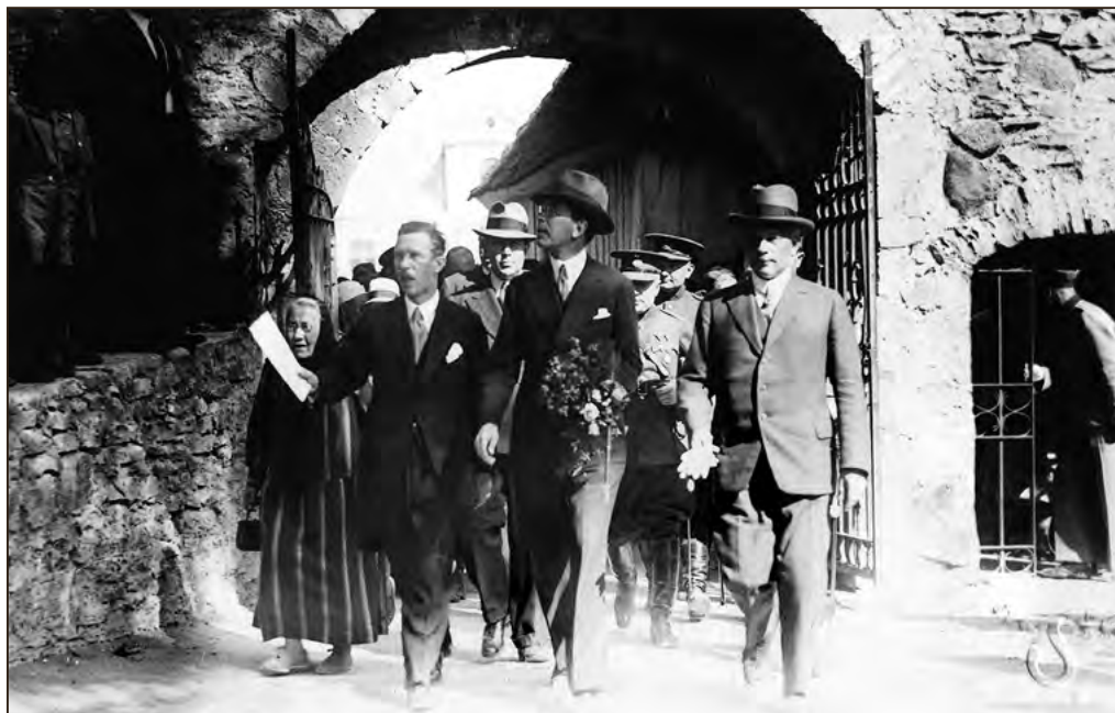
Rootsi kroonprints Gustav Adolf Haapsalus 1932. aastal. EFA.2.P.0-65238