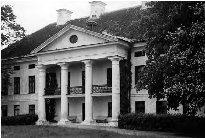
Lihula mõisa härrastemaja 1939. aastal. Foto: Carl Sarap EFA.554.P.0-183066