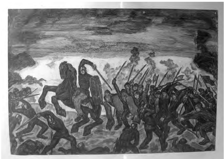
2. Kristjan Raud. Assamalla lahing. 1935. Süsi, leht 69,9 × 100 cm. Tartu Kunstimuseum, B 1709