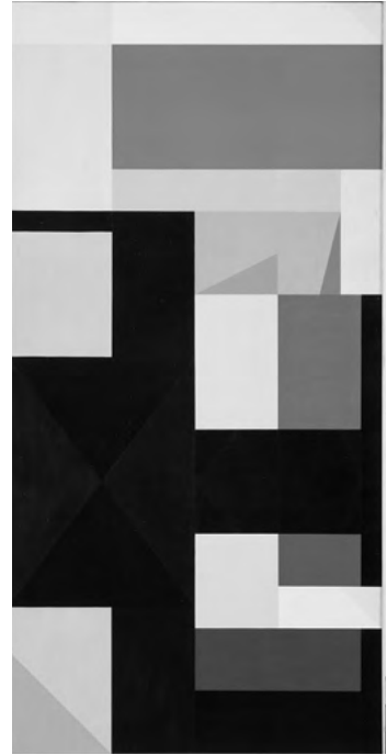
5. Leonhard Lapin. Ornament Kalevipoja ja Sarvikuga. 1988. Õli, 180,2 × 90,2 cm. Eesti Kunstimuuseum, M 6467

mustaga, nagu kinnitab Leonhard Lapini geomeetriline „Ornament Kalevipoja ja sarvikuga“ (ill. 5). Kalevipoja jätkuvast tähtsusest ja püsimisest eesti ajaloo- ja kultuurimälus kõnelevad tema üha uued ja uued esitlused, olgu siis populaarsete koomiksitude kujul või Kalevipoja muuseumi rekonstrueerimisest EAS-i rahadega.