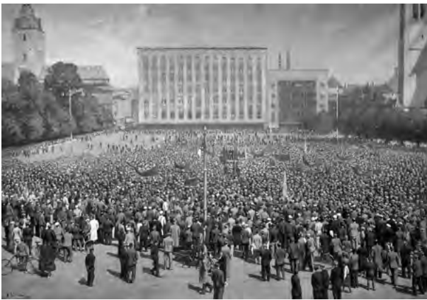
14. Andrei Jegorov. Miiting. 1950. Õli, 123 × 180,5 cm. Tallinna Linnamuuseum, G 599