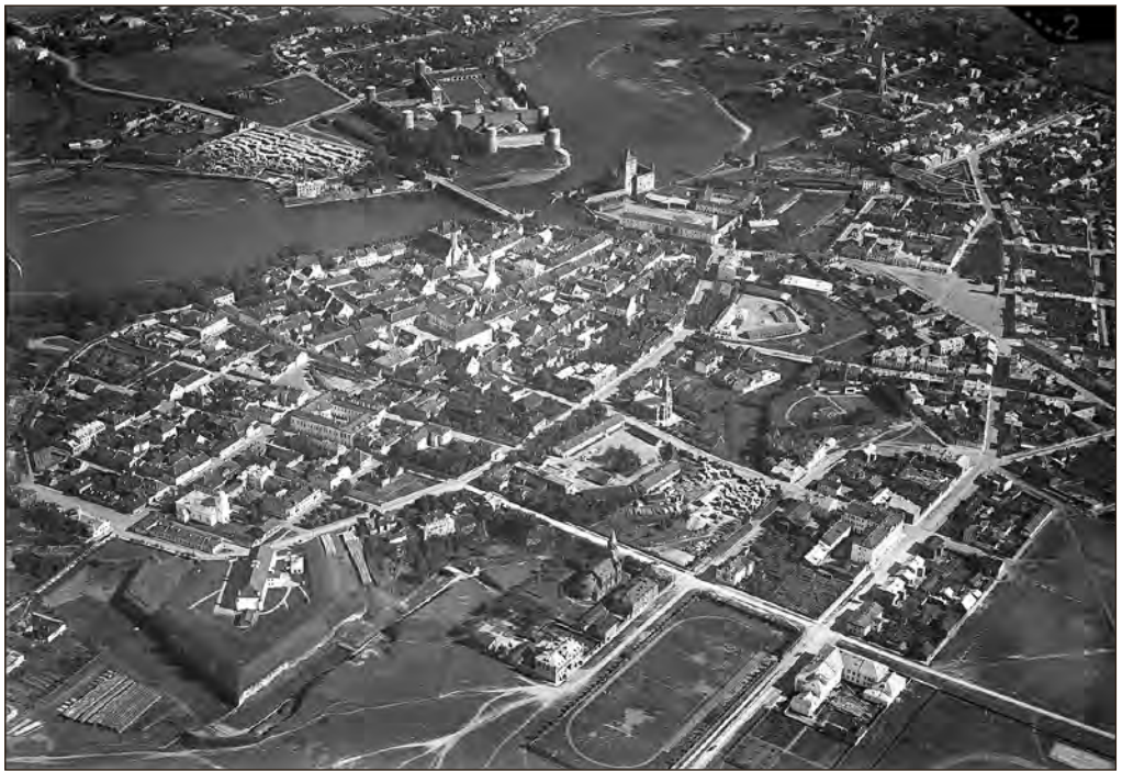
Üksiku lennuväedivisjoni nr 1 lendurvaatleja tehtud aerofoto Narva linnast 1932. aastal. Pilt ilmus Tuna esimese numbriga fotonurgas.