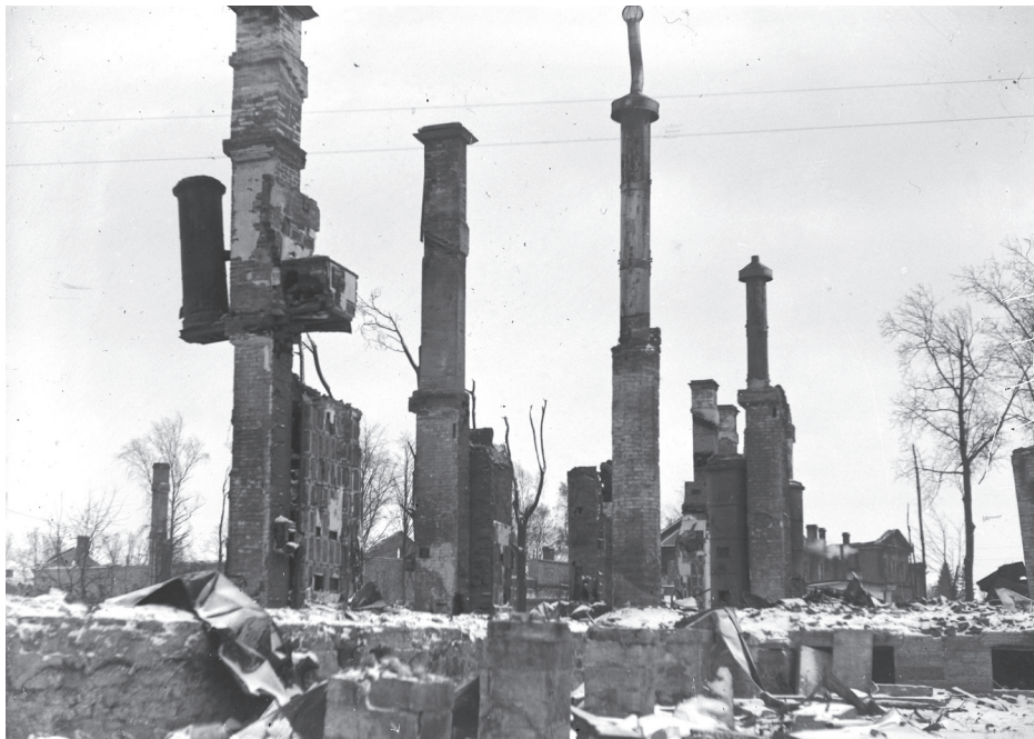
Narva kalevivabriku tööliselamute varemed 1944. aastal.