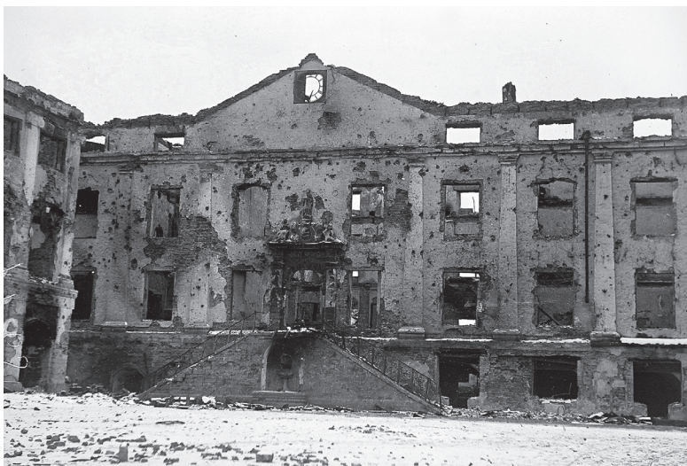
Narva raekoja varemed 1944. aastal.

Foto autor teadmata. RA, EFA.272.0.206555