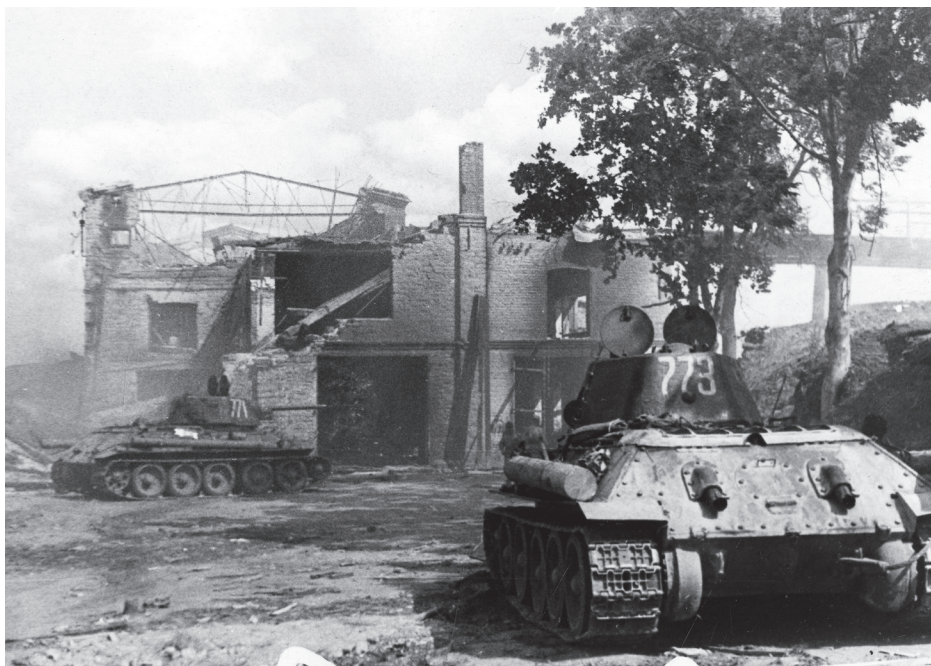
Tankid ja varemed Narvas 1944. aasta juulis.