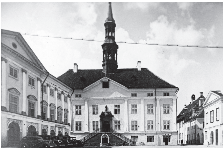
Börsihoone (vasakul) ja Narva raekoda 1930. aastatel. Raekoda ehitati ajavahemikul 1668–1671, olles üks esimesi barokkehitisi Eestis. Börsihoone pärineb veidi hilisemast ajast (ehitati 1695–1704) ja esindab hollandi nn vanaklassitsistlikku stiili.

Eelnevalt on fotonurgas käsitletud Narvat Tuna 2009. aasta 1. numbris. Käesolevas fotonurgas on kasutatud andmete täpsustamiseks Toomas Karjahärmi koostatud väljaannet „Vana Narva: ehitised ja inimesed“, mille 2006. aastal andis välja kirjastus Argo.