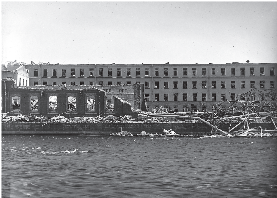
Purustatud elektrijaam, tagaplaanil Kreenholmi manufaktuuri hooned. 1944. aasta.