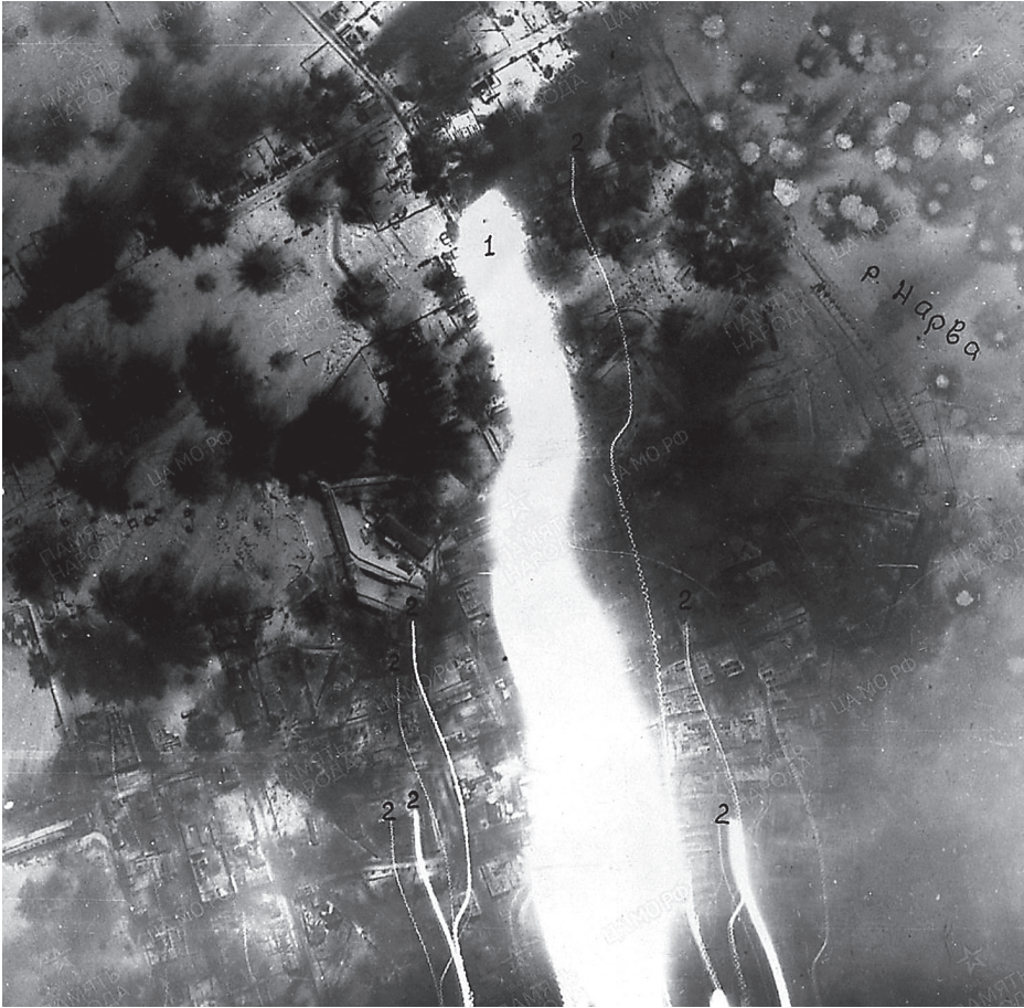
ADD 3. kaardiväediviisi 10. kaardiväepolgu Il-4 pardalt 2200 meetri kõrguselt 8. märtsil kell 01.50 tehtud aerofoto eesmärgiga kontrollida pommitamise tulemusi. Heledad jooned ja laigud pildil on Narva vanalinna kohal alla langevate valguspommide kuma. TsAMO.22480.272210s.5, l. 38, 10. kaardiväepolgu sõjapäevik

ajal oli seetõttu raskendatud. 50 Muide, planeerijad Punaarmee staapides ei olnud sildade hävitamist tegelikult soovinud – hellitati hoopis lootust, et sillad õnnestub 8. märtsi pealetungi käigus tervetena vallutada, et kasutada neid seejärel ära oma pealetungi huvides. 51