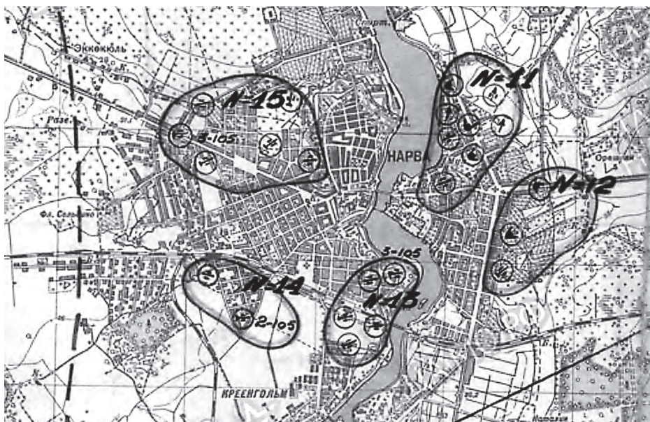
2. löögiarmee 5. märtsist 1944 pärineva lennuväetoetuse plaani juurde lisatud sihtmärkide kaardi fragment, millele on muu hulgas märgitud Saksa suurtükiväepositsioonid Narvas.

2. löögiarmee pealetungioperatsiooni õnnestumise tagamiseks oluiks ilmselt otstarbekam kontsentreerida ADD rünnakud Jaanilinna sillapeale, et tekitada võimalikult suurt kahju seal asuvatele Saksa vägedele, mis kujutasid endast põhilist takistust 2. löögiarmee teel. Võib oletada, et Jaanilinna ulatuslikumast pommitamisest