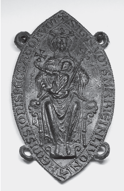
Wismarist leitud Liivimaa/Riia palverännumärk, 13. saj II p.

(Rootsi), Lübeckist, Kielist ja Wismarist 12 ning Liivimaal Kuldīgast. 13 Märk on väga sarnane Rocamadouri palverännumärgiga ja kujundatud ilmselt viimase eeskujust lähtuvalt. Majusklite kasutamine osutab, et märk pärineb 13. sajandi teisest või 14. sajandi esimesest poolest. Ehkki pealiskirjas mainitakse üksnes Liivimaad ja mitte Riia, on uurijad arvamusel, et seda jagati Riia kirikuid, eeskätt toomkirikut külastanud palveränduritele. 14 Kui Liivimaa ristiusustamise esimestel sajanditel võis selline üldine märk osutada Maarjamaa „reklaamimiseks“ piisavaks, siis Tallinna leiud viitavad, et hiliskeskajaks oli olukord muutunud.