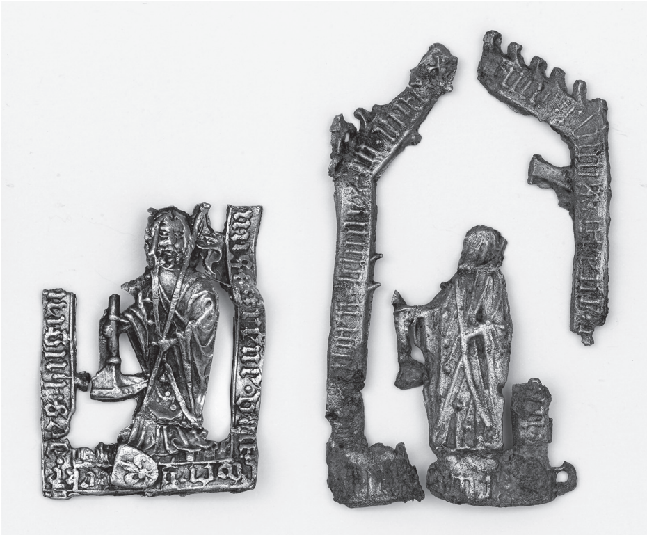
Riia Püha Vere palverännumärgid Tallinnast. Vasakul Jahu tn 6, paremal Estonia pst 7 leid. Tinaplii, 15. saj II p.

tipust algava teksti esimene pool paljastab meile Schwerini krahvi nime: guncelinus greue van swery[n] . Teksti teine pool, mis põhiosas jääb vasakule servale, on aga veelgi põnevam: teke[n] des hilgen blodes to rige („Riia Püha Vere märk“). Pealiskirja lõpus näib olevat kaks ristamisi asetatud võtit – Riia vapimärk. Seega pärinevad Jahu tn ja Estonia pst märgid keskaegse Liivimaa ühest varaseimast ja olulisimast palverännusihktohost – Riia toomkirikust, kus paiknes Püha Vere reliikvia. Teadaolevalt pole Riiaast ega mujalt Euroopast selliseid märke seni päevalgele tulnud, mis teeb Tallinna leidudest väärtusliku lisanduse keskaegse Läänemere piirkonna palverännukultuuri uurimiseks.