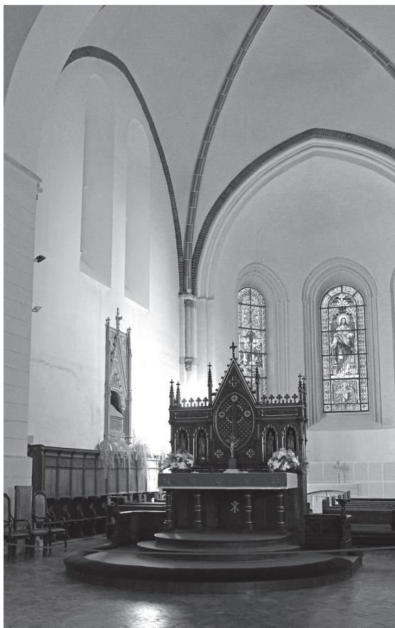
Piiskop Meinhardi hauanišš Riia toomkiriku koori põhjaseinas. Niši läheduses asus Püha Vere altar.