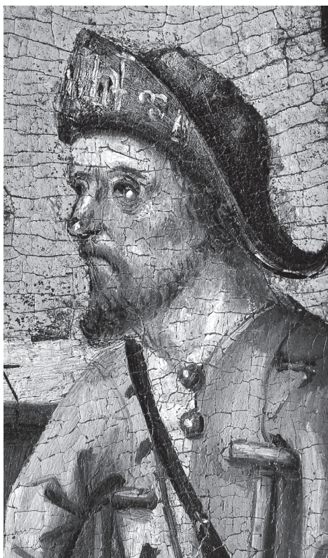
Üks kolmest palverändurist, keda on kujutatud Tallinna Püha Vaimu kiriku peaaltari retaablil. Berni Notke töökoda, 1483.