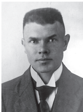
Oskar Kangro 1919. aastal. RA, ERA.1599.1.5

Nagu nähtub Kangro novembri alguses kirjutatud kirjast Asutava Kogu esimehele, saatis ta 120 eksemplari brošüürist tööpoolest Asutava Kogu liikmetele tutvumiseks. 52